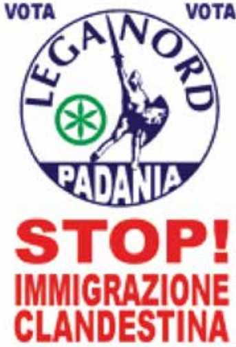
Resim 1. Lig Partisi Seçim Afişi