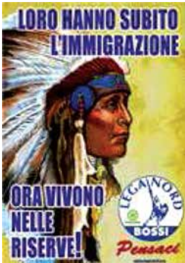
Resim 3. Lig Partisinin Seçim Afişi