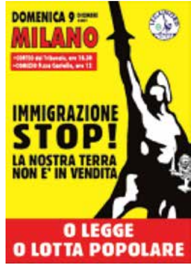
Resim 2. Lig Partisi Seçim Afişi