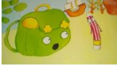
Nötr karakter için örnek resim