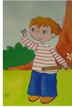
Erkek çocuk karakter için örnek resim