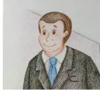
Erkek karakter için örnek resim