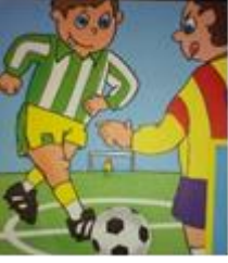
Spor faaliyeti ile ilgilenme (Erkek Çocuk)