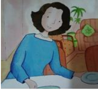
Kadın karakter için örnek resim.