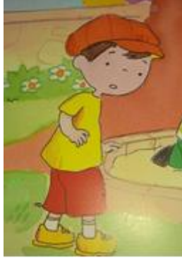
Aksesuar içeren kıyafet (Erkek çocuk)

İncelenen kitaplardaki çocuk kıyafetlerinin çoğunlukla rahat hareket edilebilir kıyafetler olduğu gözlenmiştir. Çocuk kıyafetlerinin hareket olanığı ve aksesuar içermesine dair frekans ve yüzdeler Tablo 3'te gösterilmiştir.