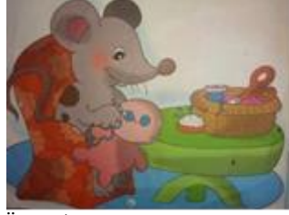
Örgü/ dikiş (Nötr)