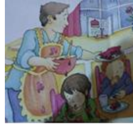
Yemek yapma (Erkek)