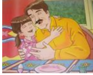
Sevgi gösterme (Erkek- Kız çocuk)