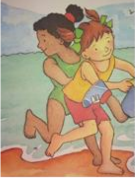
Aksesuar içeren kıyafet (Kız çocuk)