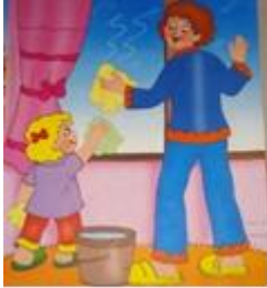
Ev işleri yapma (Kadın- Kız Çocuk)