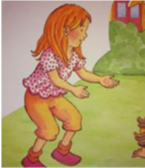
Kız çocuk karakter için örnek resim