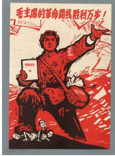
Resim 3. “Başkan Mao” Konulu Propaganda Posterleri

1966-1967 yılları arasına tarihlenen “Başkan Mao” konulu propaganda posterleri, Hebei Halk Güzel Sanatlar Yayınevi tarafından hazırlanmıştır. Propaganda posterinde “Yaşasın Başkan Mao'nun devrimci çizgisinin zaferi! (毛主席的革命路线胜利万岁!)” yazısı bulunmaktadır.