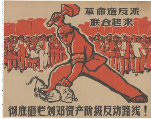
Resim 7. “Mücadele” Konulu Propaganda Posteri

1967 yılına tarihlendiği tahmin edilen “mücadele” konulu propaganda posterinin yayıncısına dair bilgiye ulaşılamamıştır. Propaganda posterinde “Kapitalist sınıfı ve Liu ile Deng'in gerici çizgisini tamamen yerle bir edin! (彻底砸烂刘邓资产阶级反动路线!)” yazısı bulunmaktadır.