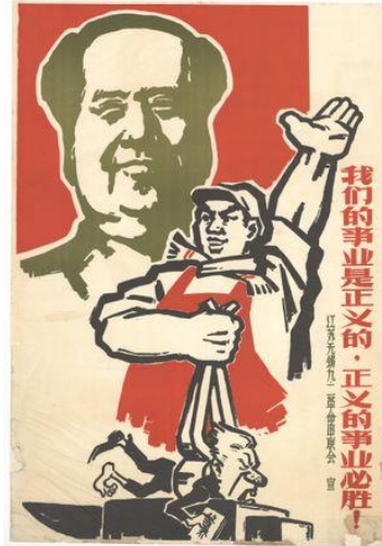
Resim 5. “Dava” Konulu Propaganda Posterleri

1967 yılına tarihlendiği tahmin edilen “dava” konulu propaganda posterinin yayıncısına dair bilgiye ulaşılamamıştır. Propaganda posterinde “Davamız haklı, haklı dava galip gelmeli! (我们的事业是正义的，正义的事业必胜!)” yazısı bulunmaktadır.