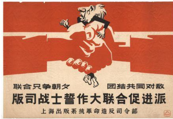
Resim 6. “Birleşme” Konulu Propaganda Posterleri

1967 yılına tarihlendiği tahmin edilen “birleşme” konulu propaganda posterleri, Şangay Yayın Sistemi Devrimci Asi Karargahı tarafından hazırlanmıştır. Propaganda posterinde “Basım Departmanı askerleri, ilerlemeyi destekleyenlerle birleşme sözü verdi (版司战士誓作大联合促进派; 联合只争朝夕团结共同对敌 -)” yazısı bulunmaktadır.