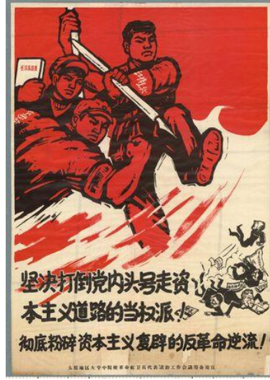
Resim 1. “Kapitalist” Konulu Propaganda Posteri

tarafından hazırlanmıştır. Propaganda posterinde “Kapitalist yol izleyen partide bir numaralı iktidar sahiplerini kararlılıkla ezin! Kapitalist restorasyonun karşı-devrimci ters akımını iyice ezin! (坚决打倒党内头号走资本主义道路的当权派! 彻底粉碎资本主义复辟的反革命逆流!)” yazısı bulunmaktadır.