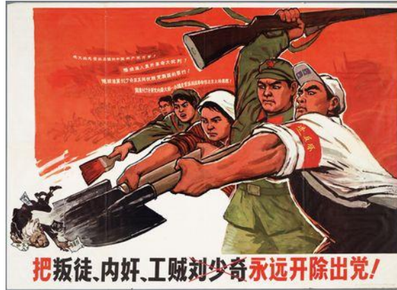
Resim 8. “İhraç” Konulu Propaganda Posterleri

1968 tarihlenen “ihraç” konulu propaganda posterleri, Şanghai Halk Güzel Sanatlar Yayınevi tarafından hazırlanmıştır. Propaganda posterinde “Dönen hain ve zorba Liu Shaoqi, partiden ilelebet ihraç edilmelidir! (把叛徒、内奸、工贼刘少奇永远开除出党!)” yazısı bulunmaktadır.