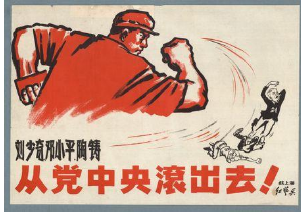
Resim 2. “Merkez Komite” Konulu Propaganda Posterleri

1966 yılına tarihlenen “Merkez Komite” konulu propaganda posterleri, Şanghay Kızıl Muhafızları tarafından hazırlanmıştır. Propaganda posterinde “Liu Shaoqi, Deng Xiaoping ve Tao Zhu, Parti Merkez Komitesinden çıkmalı! (刘少奇, 邓小平, 陶铸从党中央滚出去!)” yazısı bulunmaktadır.