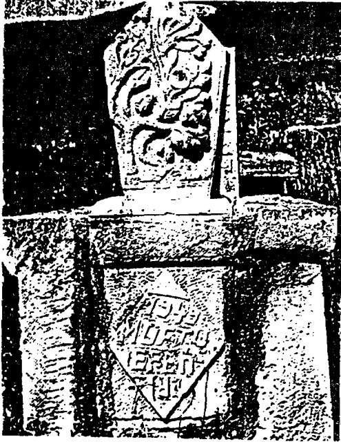
Kadı Şevki Efendi'nin Kabri

Kadı Şevki Efendi diye anılan bu büyüğümüze "Yurtbaşı" soyadını Mustafa Kemal Atatürk vermiştir. 21 Nisan 1949 tarihinde vefat eden Kadı Şevki Efendi'nin mezarı Refahiye ilçemizin Günyüzü Köyü kabristanlığında bulunmaktadır. 25