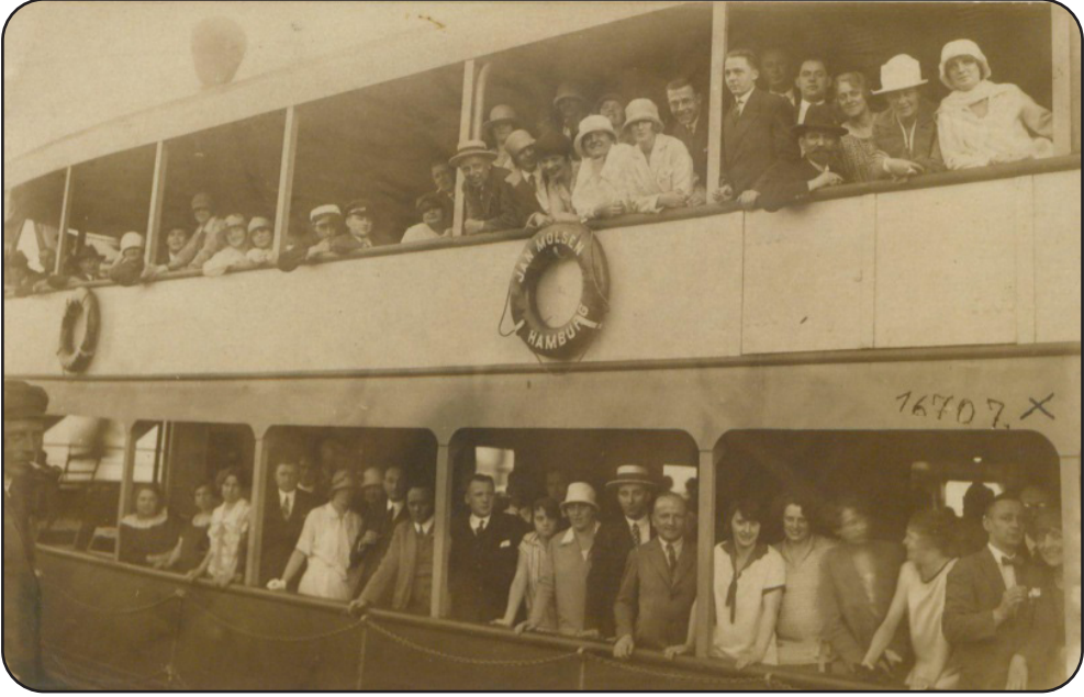
Fotoğraf 3: Seyyar sergi gemisi Karadeniz'in Hamburg'da çekilmiş fotoğraf, 17 Temmuz 1926 61

denizlerde olan sergi personelinin birbirleri arasında bazı olumsuzlukların ve dargınlıkların geliştiğini, serginin idaresi hususunda bazı aksaklıkların oluştuğuna dikkat çekiyordu. 60 Dört gün boyunca Hamburg limanında kalan ve Almanlarda olumlu bir intiba bırakan Seyyar Sergi, İsveç'e gitmek üzere Almanya'dan ayrılmıştı.