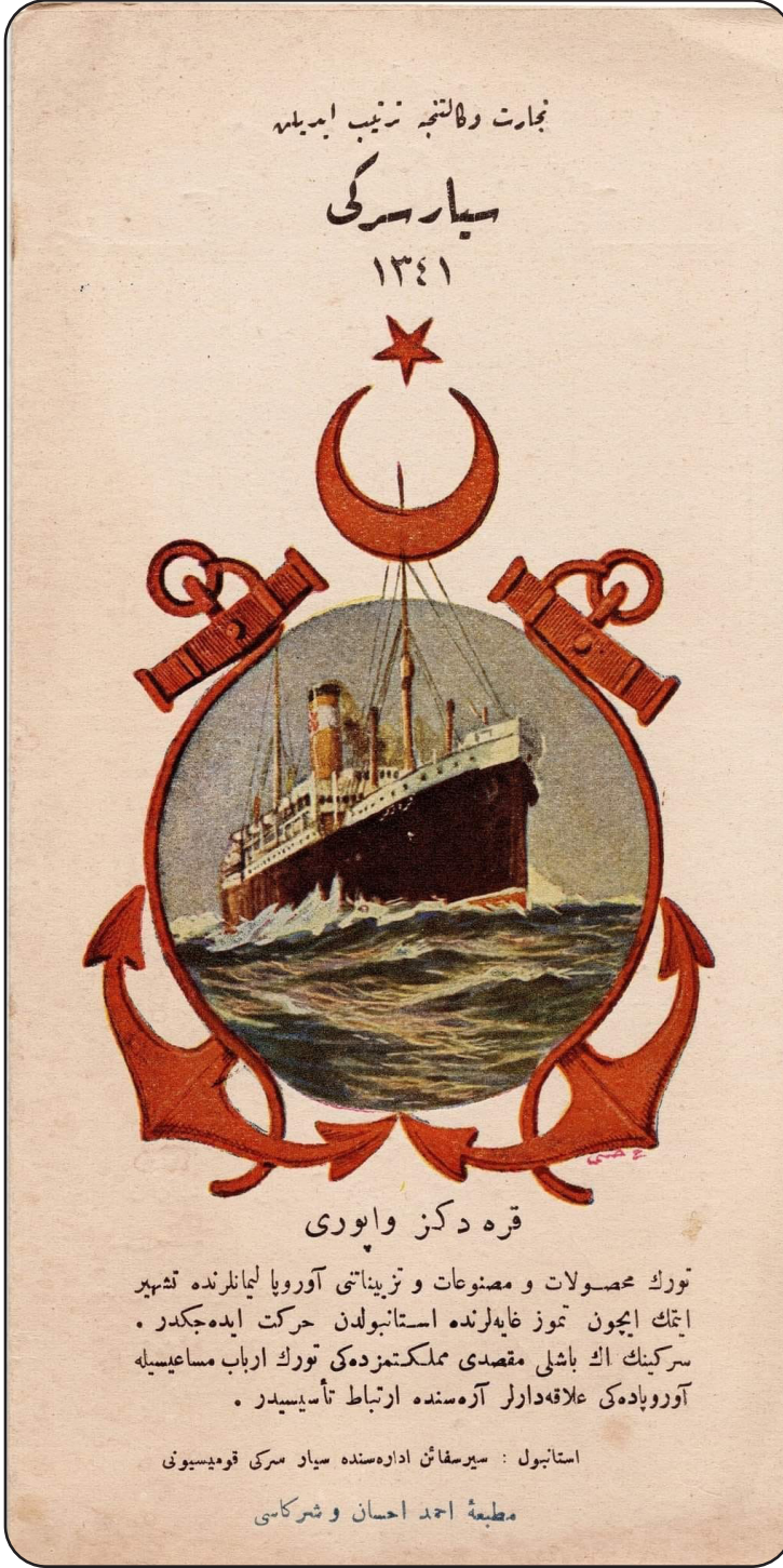
Resim 1: "Ticaret Vekaletince Tertip Edilen Seyyar Sergi-1341" başlıklı broşür kapağı