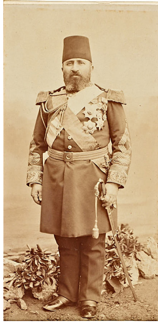
Resim 2. Tophane-i Âmire Müşiri ve Mekatib-i Umumiye-i Askeriye Nazırı Zeki Paşa.

olmasıyla beraber Umum Topçu ve İstihkam Müfettişi olarak komisyonun görev ve sorumluluğu da üzerine almıştır. Ayrıca yine Ali Saib Paşa'nın müşirliğinin son bir yılında Şehremaneti'nden, Tophane-i Âmire Müşiriyeti'nin idaresine nakledilen Dolmabahçe Gazhanesi'nin idaresi de Zeki Paşa'ya verilmiştir 9 .