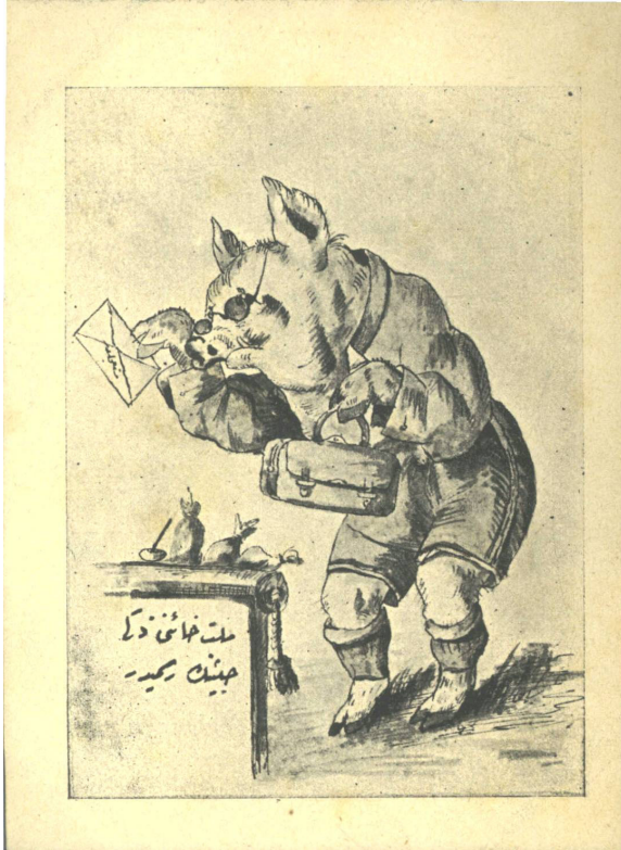
Resim 5. “Millet Haini Zeki Habisi'nin Resmidir” yazılı olan bu karikatürde, Zeki Paşa'nın elindeki zarfın üzerinde “müsta'celedir” notuyla onun jurnalcılığına vurgu yapılmıştır. TTK Arşivi, OFS, 15/37.

ifade etmiştir. Birinci mektubuna istinaden ağır bir şekilde eleştirildiği jurnalcılık ve hafiyecilik bahsine gelince, kendisinin idaresinde hafiyecilerin yalnız mekteplerde değil devletin her kurum ve birimlerinde icra edildiğini, jurnalcılık yapmama gibi bir lükslerinin olmadığını zira jurnalcılığa karşı koymaya kimsenin kudretinin de yetmediğini ifade etmiştir 59 . Padişah II. Abdülhamid'e günde birden fazla jurnal yazan ve bu doğrultuda her tarafta hafiyecileri olduğu herkesçe bilinen Zeki Paşa 60 , padişahın isteği ve emriyle bir tek askerî mekteplerde değil her tarafta jurnalcılığın yaygın olduğunu ifade ederek üzerine isnat edilen jurnalcılığı reddetmeyerek sorumluluğu açık bir ifade ile olmasa da padişah II. Abdülhamid'e yüklemiş ve bu konuda onun emirlerine itaat edildiğini söylemeye çalışmıştır 61 .