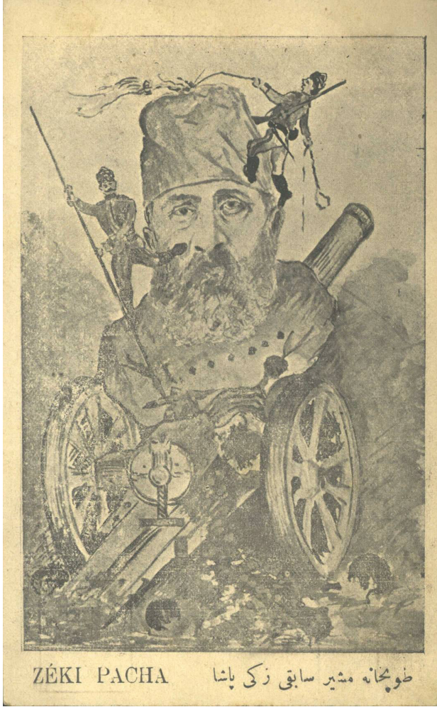
Resim 4. Tophane Müşiri Sabık Zeki Paşa'ya Dair Resmedilmiş Bir Kartpostal.

İlgili haberlerde her ne kadar bu paşaların ve diğerlerinin tutukluluk halleri devam etse de aslında sadece Bahriye Nazırı sabık Hasan Rami Paşa hakkında kanunen bir takibata başlanıldığı ve diğerleri hakkında herhangi bir kanuni muamele icra edilmediğinden Hasan Rami Paşa haricindeki paşaların kanunen tutuklu bile addedilemediği yazılmıştır 54 . Nitekim diğer tutuklular hakkında ne yönde muamele icra edileceği resmen kararlaştırılmamıştır. Bu durum karşısında İstinaf Müdde-i Umumiliği, Adliye Nezareti'ne hitaben yazdığı bir yazıda Zeki, Tahsin, Memduh ve Reşid paşaların aleyhlerinde herhangi bir şikâyet olmadığı ve bu nedenle Adliye Nezareti'nde henüz kendilerini müdafaa etmelerine gerek görülmediği yazılmıştır.