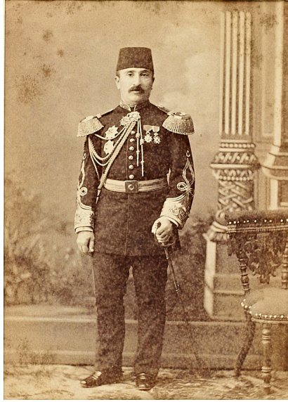
Resim 1. Mekatib-i Umumiye-i Askeriye Nazırı Mirliva Zeki Paşa. İstanbul Üniversitesi Nadir Eserler Kütüphanesi, II. Abdülhamid Fotoğraf Koleksiyonu, 91283.

Mekatib-i Umumiye-i Askeriye Nazırı Mirliva Zeki Paşa, ikbali yolundaki basamakları hızlı bir şekilde çıkmış ve 29 Kasım 1884'te "Feriklik" rütbesi kendisine tevcih edilmiştir 5 . Padişah yaverliği de uhdesinde kalmak üzere uzun yıllar Mekatib-i Umumiye-i Askeriye Nazırlığı vazifesini devam ettiren Ferik Zeki Paşa, Tophane-i Âmire Müşirliği ile beraber Seraskerlik vazifesini devam ettiren Ali Saib Paşa'nın ani vefatıyla boşta kalan Tophane-i Âmire Müşirliği'ne, 30 Ağustos 1891 tarihinde tayin edilmiştir 6 . Bu tayinden sonra bir önceki vazifesi olan Mekatib-i Umumiye-i Askeriye Nazırlığı da uhdesinde kalmış ve kendisi, "Müşirlik" rütbesine terfi etmiştir 7 .