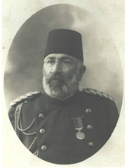
Resim 7. Tophane Müşiri Sabık Zeki Paşa.

Zeki Paşa, kendisi ve eşlerinin üzerinde bulunan vakıf emlakinin iadesi ve akabinde İlane-i Milliye adına elli bin kuruşluk bir bağışın ardından serbest bırakılmıştır. Serbest bırakılmasının ardından emeklilik işlemlerini başlatmak üzere müracaatta bulunmuştur. Ancak yaptığı müracaatına binaen başlatılan inceleme uzun sürmüştür. Zeki Paşa'nın askerlik hizmetinin toplamda kırk bir seneye ulaştığı ve hizmet yılına göre aylık yedi bin beş yüz kuruş maaşla emekliliğinin uygun görüldüğü Harbiye Nezareti'nden Sadaret makamına tebliğ edilmiştir 88 . Sadaret makamı da 20 Aralık 1908'de Zeki Paşa'nın emeklilik talebinde herhangi bir beis görülmediğini bildirerek işlemlerin yapılmasına müsaade etmiştir 89 . Zeki Paşa'nın yürütülen emeklilik işlemleri neticesinde fiili askerlik hizmetinin kırk bir sene üç ay ve on gün olduğu tespit edilmiştir 90 . Emeklilik işlemlerinin tamamlanmasının ardından Zeki Paşa, 24 Aralık 1908'de emekli edilmiş ve bu tarihten itibaren de kendisine emekli maaşı bağlanmıştır 91 .