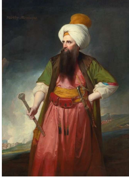
Görsel 4. Edward Wortley Montagu portresi, 1765/66, George Romney, tuval üzerine yağlıboya, 162.7x119 cm, Özel Koleksiyon (Kaynak: https://www.sothebys.com/en/auctions/ecatalogue/2014/old-master-british-paintings-evening-114033/lot.45.html Erişim tarihi: 21.05.2023)

arkadaşlığının ortak Doğu ilgilerinin bu arkadaşlığı uzun ömürlü tutması beklenirken, Romney tarafından bir portresi de yapılmış ve dönem kaynağı sayılabilecek William Hayley'in 1809 tarihli kitabındaki bilgiye göre Montagu, Romney ile birlikte iken yedikleri küçük bir kuşun kemiğinin boğazına batması sonucu oluşan enfeksiyon sebebiyle birkaç gün içinde yaşamını yitirmiştir (Hayley, 1809, s. 59-60).