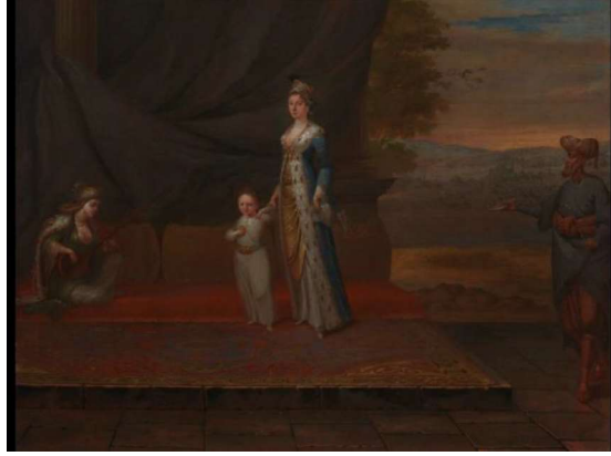
Görsel 1 , Ođlu ve hizmetlileri ile birlikte Lady Montagu, 1717, Jean Baptiste Vanmour'a atfediliyor, yağlıboya, 69.3x90.9 cm, © National Portrait Gallery, London, NPG 3924 (Finnigan, 2006, s.70)

Bu bölümde incelenecek olan bir diđer portre olan Türk giysileriyle Türk halısı üzerinde oturan Levant Company tüccarının portresi ( G.2 ) Osmanlı ve İngiltere arasında yüzyıllarca ticaret yapmış olan Levant Şirketi tüccarlarının, Dođu Akdeniz'deki görevlerinin hatırası olarak görev süreleri bitiminde yaptırdığı (Williams, 2015, s.56) Türk kostümlü portrelere aittir. Genellikle 1730'lu yıllarda yaptığı Türk kostümlü Levant Şirketi'nin tüccarlarının portreleri ile adını duyuran sanatçı Andrea Soldi 1703 yılında Floransa'da doğmuş; portrelerindeki başarısından dolayı Londra'ya davet edilmiş ve yaşamının geri kalanını burada sürdürmüştür (Ingamells, 1978-80, s.1). Türk halısı üzerinde yarım bağdaş kurmuş şekilde oturan figürün kim olduğu bilinmemekte ancak resmin adında bir Levant Company tüccarı olduğu belirtilmektedir. Figür şalvarı, entarisi, kaftanı ve sarığıyla bir Türk kostümü giymenin yanı sıra bir Türk halısı üzerine Türk gibi oturup, elinde Türk kahvesi sunumu ile özdeşleşen bir fincan tutmaktadır. Resmin açık havada yapılmış olması, fonda ağaç ve çok uzakta bir şehir manzarasına yer verilmesi de bir av dönüşü sahnesini andırmak için tercih edilmiş olabilir. Bu ve bir önceki resimlere bakıldığında resim yaptıranların yalnızca Türk kostümü ile değil aynı zamanda Türk alışkanlıklarıyla da resimlerde aktarılmak istediği görülmektedir.