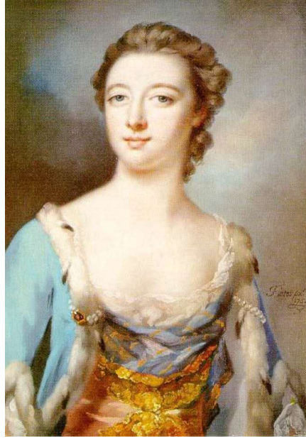
Görsel 5, Elizabeth (Gunning), Barones Hamilton Portresi, 1751, Francis Cotes, 59.1x43.8 cm, National Portrait Gallery, NPG 4890 (Kaynak: https://www.npg.org.uk/collections/search/portraitExtended/mwo2868/Elizabeth-ne-Gunning-Baroness-Hamilton-of-Hameldon Eriřim tarihi: 10.05.2023)

Daha önce de belirtildiđi üzere 'Türk ressamı' olarak bilinen Liotard, sayısız Türk kostümlü portre yapmıřtır. Bunlardan biri olarak Lady Hawke Portresi'nde (G.6) -sanatçı için klasikleřmiř pozlardan biri olarak- yarım boy portre řeklinde, gömlek üzerine giyilmiř yazlık bir kaftan ya da bir entari ile birlikte, bařının diđer yanına dūřecek řekilde yan oturtulmuř kalpak benzeri bir aksesuar ve buna deđerli bir tař ile tutturulmuř kuř tüyüne yer verilmiřtir.