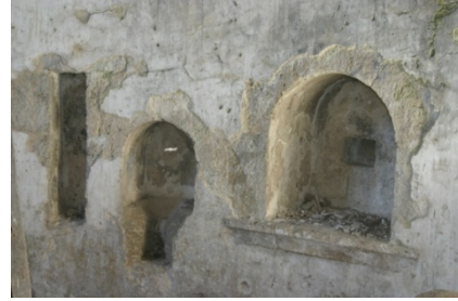
Resim 10: Yaylalı Meryem Ana Kilisesi II

Orta Mahalle Köprüsü: Meryem Ana Kilisesinin batısına yer alan yuvarlak kemerli tek gözlü küçük ölçülerdeki köprü, 5.40 m. uzunluğunda 2.83 m. genişliğindedir. Köprü'nün kemeri kesme taştan, tabliye ve tempan duvarları moloz taşandır. Kilise yolu üzerindeki dereyi aşmak için inşa edilmiştir.