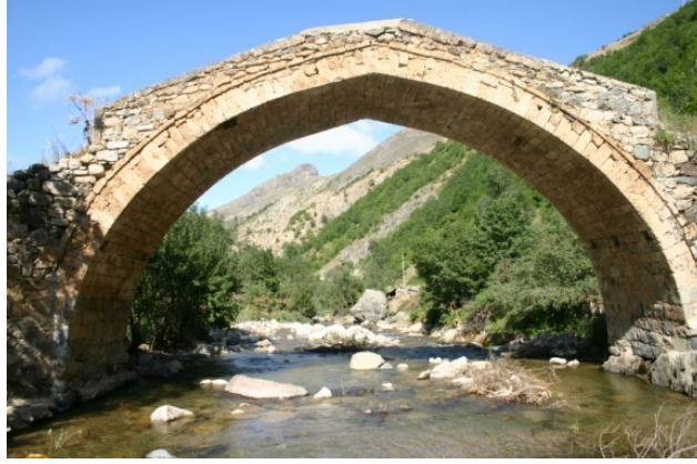
Resim 3: Sarıbaba Değirmen Köprüsü

Söğüteli Camii: Söğüteli Kürtün'ün 36 km. güneyindedir. 8.60 x 8.37 m. ebatlarındaki cami moloz taş örgülü ve çamur sıvalıdır. Üzerindeki kitabesinden H.1286-M.1869 tarihli olduğu anlaşılmaktadır. Rakamla verilen tarihinden başka, herhangi bir yazıt yoktur. Doğu cephesinin kuzey köşesine yakın olan girişi kesme taştan yuvarlak kemerlidir. Özensiz duvar işçiliğinde yer yer kesme taşlar da kullanılmıştır. Güneyde iki, doğuda üç küçük pencere ile içerisi aydınlatılmıştır. Kuzey kısımda mahfilin olduğuna dair izler bulunmaktadır. Cami ahşap hatılların taşıdığı bir ahşap örtüye sahiptir. Dıştan saca kaplıdır. Mihrabı oldukça sadedir. Ahşap minberin bir özelliği yoktur. (Resim: 4, 5).