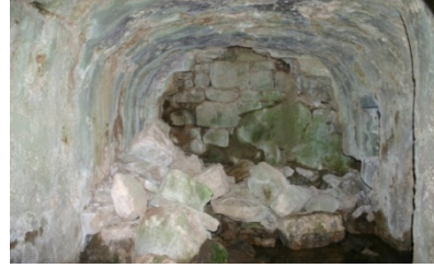
Resim 7: Yaylalı Meryem Ana Kilisesi II Ayazma