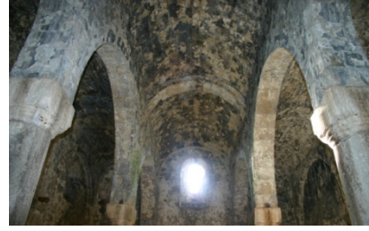
Resim 15: Yaylalı Meryem Ana Kilisesi III

Gümüşhane'nin Kürtün ilçesinde yer alan kültür varlıkları, bölgenin diğer eserleri ile benzerlik göstermektedir. Gümüşhane ve çevresinin dağlık bir arazi olması dolayısıyla, kale ve gözetleme kuleleri çok sayıdadır. Vadiler ve yollar bunlarla denetim altında tutulmuştur. Köprüler harpuşa tarzında ve tek gözlüdür. Kemerlerinde kesme taş, diğer yerlerinde moloz taş kullanılmıştır. Camiler küçük ölçülerde ve sade bir işçiliğe sahiptir. Çeşmeler bezemesiz, kitabesiz ve eyvan tarzındadır. Bölgedeki diğer kiliselerde olduğu gibi Kürtün'de yer alan kiliseler XIX. yüzyılda yapılmış olup tek veya üç nefli küçük ölçülerdeki yapılardır.