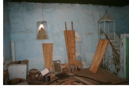
Resim 5: Söğüteli Camii

Söğüteli Yıkık Kilise (Meryam Ana Kilisesi I): Yaylalı Orta Mahallede bulunan Meryemana Kilisesi 11.00 x 7.40 m. ebatlarında tek neflidir. Kilisenin üslup özelliklerinden hareketle XIX. yüzyıl eseri olduğu anlaşılmaktadır. Apsisi içten yarım yuvarlak dıştan beş köşeli olarak