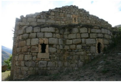
Resim 9: Yaylalı Meryem Ana Kilisesi II