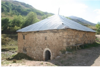
Resim 4: Söğüteli Camii

Söğüteli Camii: Söğüteli Kürtün'ün 36 km. güneyindedir. 8.60 x 8.37 m. ebatlarındaki cami moloz taş örgülü ve çamur sıvalıdır. Üzerindeki kitabesinden H.1286-M.1869 tarihli olduğu anlaşılmaktadır. Rakamla verilen tarihinden başka, herhangi bir yazıt yoktur. Doğu cephesinin kuzey köşesine yakın olan girişi kesme taştan yuvarlak kemerlidir. Özensiz duvar işçiliğinde yer yer kesme taşlar da kullanılmıştır. Güneyde iki, doğuda üç küçük pencere ile içerisi aydınlatılmıştır. Kuzey kısımda mahfilin olduğuna dair izler bulunmaktadır. Cami ahşap hatılların taşıdığı bir ahşap örtüye sahiptir. Dıştan saca kaplıdır. Mihrabı oldukça sadedir. Ahşap minberin bir özelliği yoktur. (Resim: 4, 5).