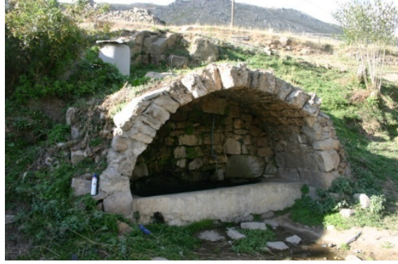
Resim 11: Yaylalı Orta Mahalle Çeşmesi I

Orta Mahalle Çeşmesi I: Orta Mahallede bulunan bu eyvan türü çeşme 4.40 m. genişliğinde 2.20 m. yüksekliğinde olup tek lülelidir (Resim:11). Mimari bir özelliği yoktur. Yöredeki diğer çeşmelerle benzerlik gösterir. Malzemesi moloz taştır.