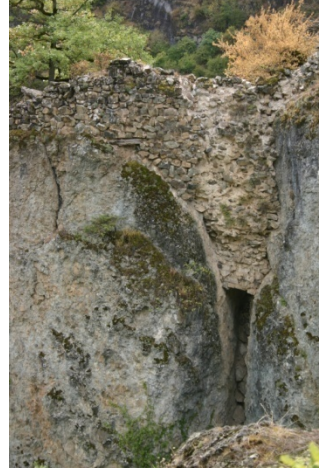
Resim 2: Süme Gözetleme Kulesi

Sarıbaba Değirmen Köprüsü: Sarıbaba Kürtün'ün 34 km. güneyindedir. Söğüteli Deresi üzerine kurulmuştur. 29.70 m. uzunluğunda, 2.45 m. genişliğindeki köprünün kemer açıklığı 12.00 m.'dir. Köprünün korkuluk tepe noktası, su seviyesine 7.70 m.'dir. Sivri kemerli tek gözlü bir köprüdür (Resim: 3). Köprünün kemeri kesme taştan, tabliye ve tempan duvarları moloz taştan inşa edilmiştir. Tabliyenin iki yanındaki korkuluklar 0.30 m. genişliktedir. Köprü günümüzde harap bir vaziyettedir. Kuzeyinde ve kuzey doğusunda birer değirmenin varlığı kalan izlerden anlaşılmaktadır.