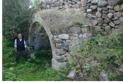
Resim 12: Yaylalı Orta Mahalle Çeşmesi II

Orta Mahalle Çeşmesi II: Orta Mahallede bulunan eyvan türü ikinci çeşme de 2.70 m yüksekliğinde 4.50 m. genişliğinde olup, sivri kemerli tek lülelidir (Resim: 12). I. çeşmeye göre daha sağlamdır. Eyvan düzgün kesme taş işçiliğe sahiptir. Çeşmenin kemer köşelikleri ve üst örtüsü yıkıktır.