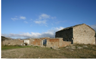
Resim 14: Yaylalı Meryem Ana Kilisesi III