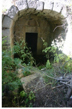
Resim 8: Yaylalı Meryem Ana Kilisesi II Ayazma