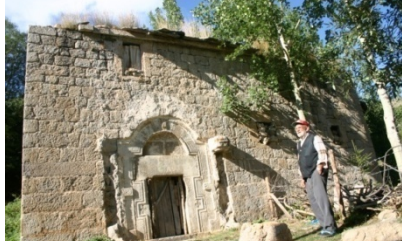
Resim 6: Yaylalı Meryem Ana Kilisesi II