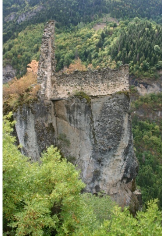
Resim 1: Süme Gözetleme Kulesi

genişlikte, 58.00 m. uzunluğundadır 5 . Duvar örgüsünde yer yer ahşap hatılların kullanıldığı dikkat çekmektedir. Yıkık olan duvarların dışında, gözetleme kulesi içerisinde başka bir yapının mevcudiyetine rastlanılmamıştır (Resim:1, 2).