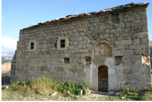
Resim 13: Yaylalı Meryem Ana Kilisesi III