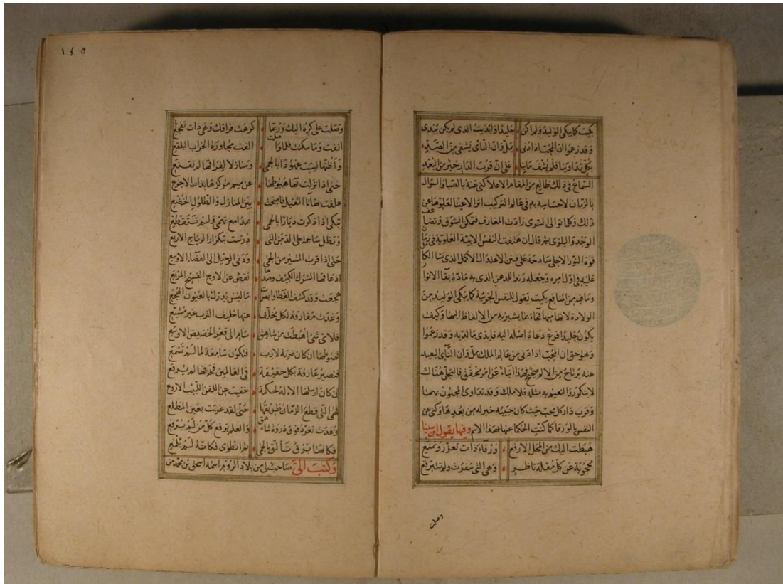
Ek-1: Muhyiddin İbnü'l-Arabî'nin Mevdüddin İshak'a yazdığı beyitler: (Muhyiddin İbnü'l-Arabî, Muhâdaratü'l-ibrâr, KYAK. , nr: 546, 145a-b)