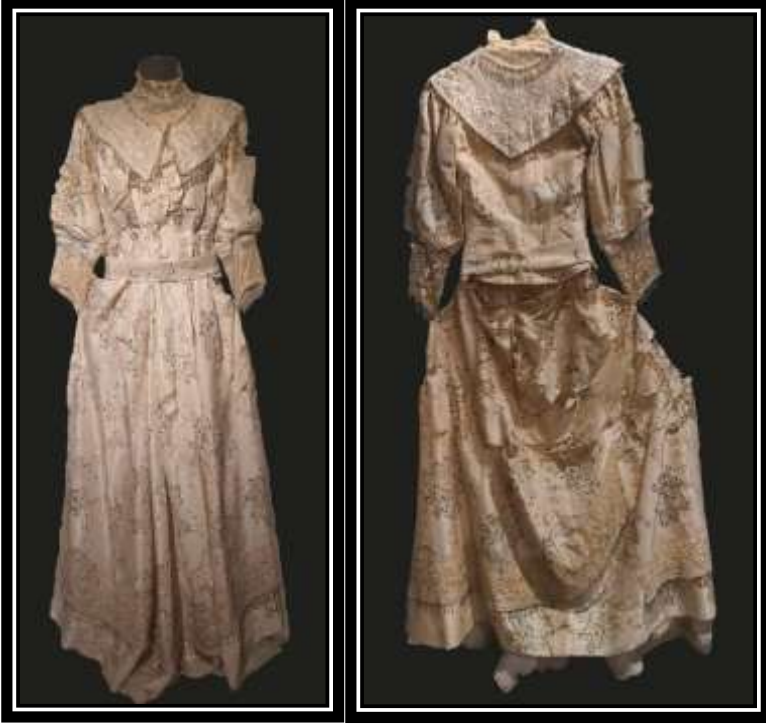
Fotoğraf No 4: Gelinlik Ön ve Arka Görünüm

İlgili Koleksiyon : Samsun Büyükşehir Belediyesi Kent Müzesi Sergi Koleksiyonu