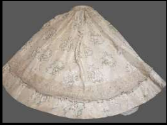
Fotoğraf No 10: Belden Büzgülü Evaze Kesim Etek

Bölgede gelinliğin rengine ve işlemelerine uygun olarak kumaş ya da deri ayakkabı ve çantalar tamamlayıcı unsur olarak kullanmışlar; fakat alan araştırmasında bu tamamlayıcı unsurlara rastlanmamıştır.