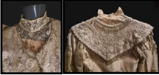
Fotoğraf No 8: Dik Yaka Ön ve Arka Görünüm

Avrupa modasına uygun kesimli bluzun göğüs, yaka kısmı ve kol ağzı Fransız gipürü (dantel) ile süslenmiştir (Fotoğraf 9). Ayrıca roba kısmı dantelle süslenmiş olup uç kısımları aşağı yönde sarkan boncuklarla tamamlanmıştır (Fotoğraf 8).