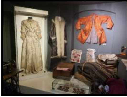
Fotoğraf No 3: Samsun Büyükşehir Belediyesi Kent Müzesi Mübadele Bölümü

Balkan ülkelerinden olan Kuzey Makedonya'nın bu göç olayı ile birlikte gelişen kültürlerarası etkileşimin, giyim kavramı üzerinde önemli derecede etki sahibi olmuştur. Anadolu ve Balkanlar bir zamanlar Osmanlı İmparatorluğu toprakları içinde iki ulusu, iki kültürü, iki dini bir araya getirmiş topraklardır. Bu topraklarda insanlar yıllarca bir arada yaşamış, gelenek-görenek ve alışkanlıklarını paylaşarak ortak bir kültür yaratmışlardır. 11 Bu bağlamda giyimin kültüre ait en önemli taşıyıcı ve yansıtıcı konumunu ortaya çıkarmıştır. 12