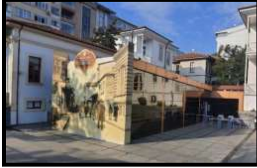
Fotoğraf 1. Samsun Büyükşehir Kent Müzesi

lehçelerinin, kısacası, kültürel miraslarının ve kimliklerinin Türkiye’de yaşatılması açısından büyük önem arz etmiştir. 9