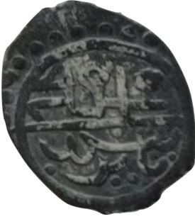
Ön yüz Mehmed bin Bayezid

Çelebi Mehmet ile İlyas Bey'in 1415 tarihli müşterek sikkesi, 0.76 gr 12 mm ölçülerindedir. (Damalı, 2009, s. 206)