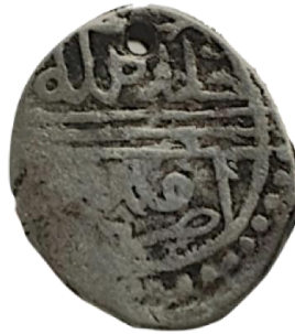
Arka yüz Halled mülkehu duribe Germiyan