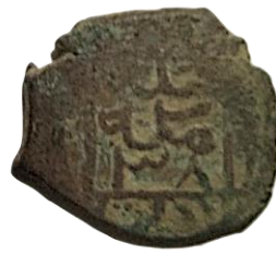
Arka yüz halledede mülkehu 38 duribe Ladik