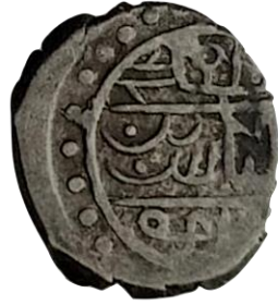
Arka yüz İlyas bin Mehmed zide ömrühü

Çelebi Mehmet ile İlyas Bey'in 1415 tarihli müşterek sikkesi 0.37 gr 10 mm ölçeklidir. (Damalı, 2009, s. 206)