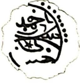
Ön yüz Mehmed bin Bayezid Cüneyd Gazi