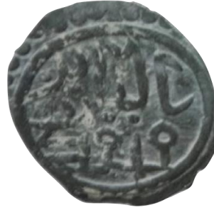
Arka yüz İlyas bin Mehmed zîde

Çelebi Mehmet ile İlyas Bey'in tarihsiz müşterek akçesi 0.78 gr 15 mm ölçülerindedir. (Damalı, 2009, s. 205)