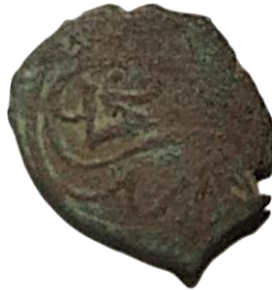
Ön yüz Tuğra (2. Murat)

Karamanoğullarının 2. Murat adına darp ettiği mangır, 1.17 gr, 17.5 mm ölçeklidir. (Damalı, 2009, s. 255)