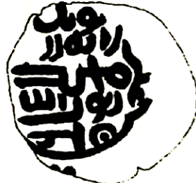
Arka yüz Lailahe illallah Muhammedün Resulu'llah Ömer, Ebubekir, Osman, Ali

Yukarıda bilgileri verilen sikkeler tarihsiz olsa da üzerinde iki beyin isminin var olması, Aydınoğullarıyla Osmanlının müşterek sikkeleri olduğunu göstermektedir. Ancak hangi tarihlerde darp edilebileceğine dair fikir yürütemek için, iki devletin arasındaki siyasi ilişkileri tahlil ederek, sikkelerin darp edildiği dönemi ortaya koymak gerekir.