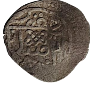
Arka yüzü Yakub ibn-i Süleyman 828

İstanbul Arkeoloji Müzesi'nde Germiyanolu Yakup Bey'in 2. Murat adına darp ettiği tarihsiz bir mangır bulunmaktadır. Bu mangır muhtemelen vasallık dönemine ait olmalıdır.