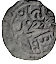
Ön yüz Sultan Mehmed 813