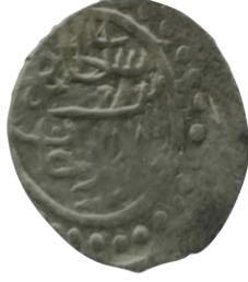
Öyüzü Sultan Mehmed bin Bayezid Han