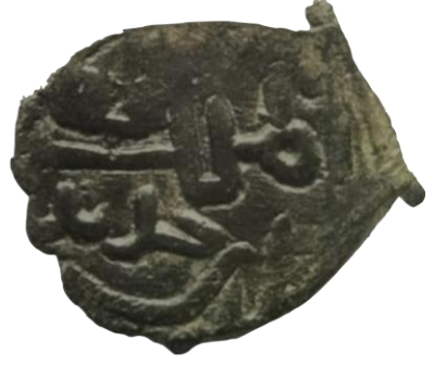
Arka yüz el-mülk-ü l'illah duribe Balad