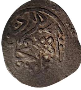
Ön yüzü Murad ibn-i Mehmed

2. Murat ve 2.Yakup'un 1425 tarihli müşterek akçesi, 0.63 gr, 1.6 mm ölçeklidir. (Damalı, 2009, s. 202)