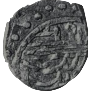
Arka yüz İlyas bin Mehmed zîde ömrühü

Çelebi Mehmet ile İlyas Bey'in 1415 tarihli müşterek sikkesi, 0.76 gr 12 mm ölçülerindedir. (Damalı, 2009, s. 206)