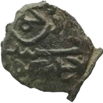
Ön yüz Mehmed bin Bayezid, Cüneyd halledede mülkehû

Çelebi Mehmet ve Cüneyt Bey'in müşterek Mangırı, 15 mm, 1.44 gr ölçeklidir. (Damalı, 2009, 2004)