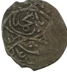
Ön yüzü Mehmed bin Bayezid, Cüneyd halledede mülkehû

Çelebi Mehmet ve Cüneyt Bey'in müşterek akçesi, 15 mm, 0.70 ölçeklidir. (Damalı, 2009, 2004)