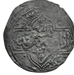
Arka yüz el minnet ü li'llah İbrahim bin Mehmed bin Karaman duribe Konya- 824

Karamanoğullarının Osmanlıya tabiiyeti, 2. Murat'ın tahta çıktığı 1421 yılından sonra iki devlet arasındaki ilişkiler kopmaya başlamıştır. Düzmece Mustafa isyanını fırsat bilen Karamanlılar, Osmanlı topraklarına saldırınca, bu bağlılık nihayete ermiştir denilebilir.