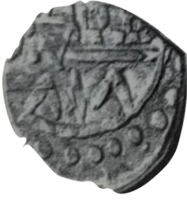
Ön yüz Mehmed bin Bayezid, hallede mülkehü 818