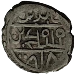
Ön yüz Mehmed bin Bayezid, hallede mülkehü 818

Çelebi Mehmet ile İlyas Bey'in 1415 tarihli müşterek sikkesi 0.70 gr 15 mm ölçeklidir. (Damalı, 2009, s. 205)