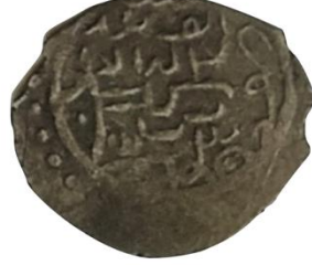
Arka yüzü Lailahe illallah Muhammedun Resulu'llah Ehubekir. Ömer. Osman. Ali