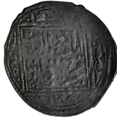
Ön yüzü Eyyam-ı devletü 'z-zaman Mehmed bin Bayezid Ebu Bekir, Ömer, Osman, Ali