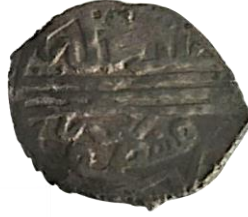
Arka yüz halledede mülkehu duribe Kastamonu

Karamanoğullarının 2. Murat adına darp ettiği mangır, 1.17 gr, 17.5 mm ölçeklidir. (Damalı, 2009, s. 255)