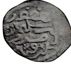
Arka yüz Yakub İbn-i Süleyman durube Germiyan