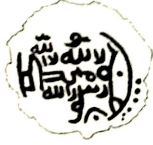
Arka yüz Lailahe illallah Muhammedün Resulu'llah Ömer, Ebubekir, Osman, Ali