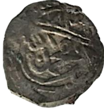
Ön yüzü 825 Tuğra (2. Murat)

İlk sikke, Karamanoğullarının 2. Murat adına darp ettiği akçe, 14 mm 0.81 ölçülerindedir. Atom Damalı gerekçe göstermeden, bu sikkenin darp tarihi H.825 değil 827 olması gerektiğinin ifade etse de 2. Murat'ın tahta çıktığı tarihlerde İsfendiyar Bey'in Osmanlıya itaati tamdı. (Damalı, 2009, s. 254)