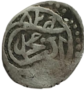
Ön yüz 825 Murad bin Mehmed Han

İkinci Murat adına darp edilmiş sikke, H.825/M.1422 tarihli, 0.88 gr, 14 mm ölçөгindedir. (Yapı Kredi Sikke Koleksiyonu Sergileri 4, 1995, s. 37), (Pere, 1968, s. 84)