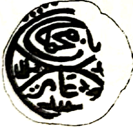
Ön yüzü, Mehmed bin Bayezid Cüneyd

Çelebi Mehmet'in Cüneyt Beyle müşterek akçesi, 12 mm, 0.76 gr ölçeklidir. (İzmirli, 2005, s. 164)