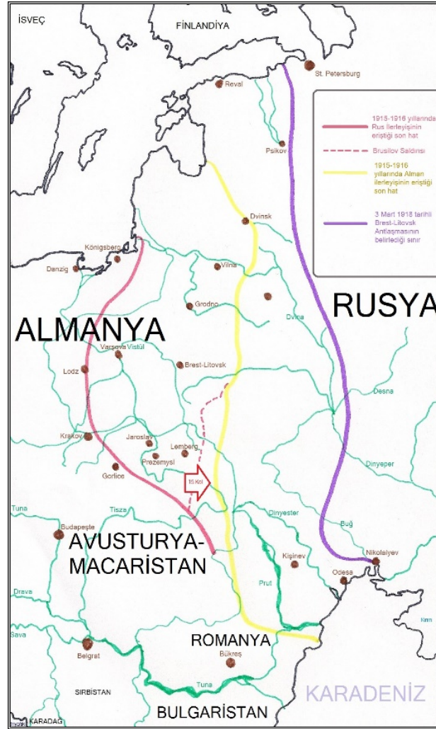
Şekil 2: 1914-1918 Yıllarında Doğu Avrupa Cephesi 22

Batı Avrupa'da mevzi savaşlarına dönüşen harbin kaderini tayin edeceği cephelerin Doğu Avrupa'da olduğuna dair kanı, 1916 yılında yaygınlaşmaya başlamıştır. Müttefiklerinin desteğiyle 1916 yılının yaz aylarında başlayan Rus genel taarruzuna karşı, Doğu Avrupa cephelerinde Alman takviyesinin gerekliliği ortaya çıkmıştır. 23 Her ne kadar Rusya'nın 130 tümeninin karşısında 46 Alman, 40 Avusturya tümeni bulunuyor olsa da Rus birliklerinin teçhizat eksiklikleri vardı. 24 Ancak Rus General Brusilov, müttefiklerinin durumunu da gözeterek "özel bir tertiplenme şekli olmadan" giriştiği taarruzda Avusturya birliklerinin hatlarını koruyamadıklarını fark etmiştir. Bu taarruz, henüz kararını verememiş Romanya için bir işaret olmuş; böylece İtilaf devletleri safına katılmıştır. 25 Batı cephesinden kuvvet naklini uygun görmeyen ve Romanya'nın seçeceği taraf konusunda strateji belirleyemeyen; aynı zamanda Avusturya-Macaristan'a askerî yardım konusuna sıcak bakmayan Falkenhayn, Doğu