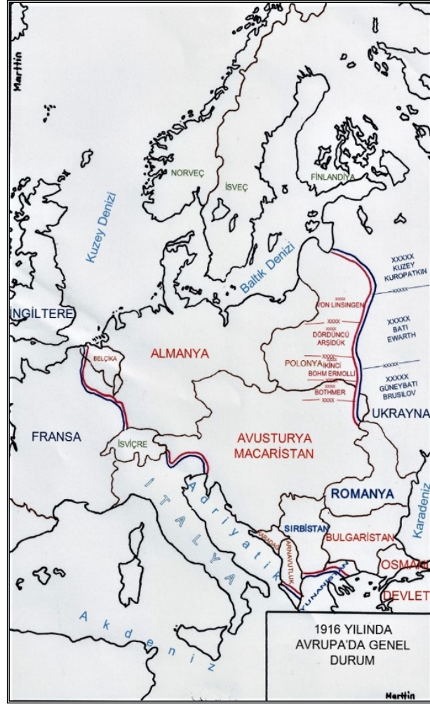
Şekil 1: 1916 Yılı'nın İlk Aylarında Avrupa'da Cephe Durumu 17

Stratejik derinliğin belirlenmesinde Birinci Dünya Savaşı'nın başlangıcından itibaren Doğu Avrupa'daki seyri önemlidir. 18 Şekillerde aşamalı olarak gösterilen bu seyir, Doğu Avrupa cephesinin büyüklüğünü ortaya koymaktadır (Bkz. Şekil 2). Savaşın başlamasından 1916 yazına değin Doğu Avrupa cephesindeki manzara, Batı Avrupa cephesine bağlı olarak şekillenmiştir. 19 Bu bağımlı durumu yalnız İttifak devletleri için değil İtilaf devletleri için de geçerlidir. Avusturya-Macaristan İmparatorluğu'nun Almanya'nın yardımına ihtiyaç duyması, Batı cephesiyle eşgüdümlü bir harekâtın Doğu Avrupa'da sürdürülmesine neden olmuştur. 20 Keza, Çarlık Rusya'sının taarruz harekâtını şekillendirme aşamasında müttefiki olan Fransızların tavsiyelerini dikkate alması tesadüf değildir. 21