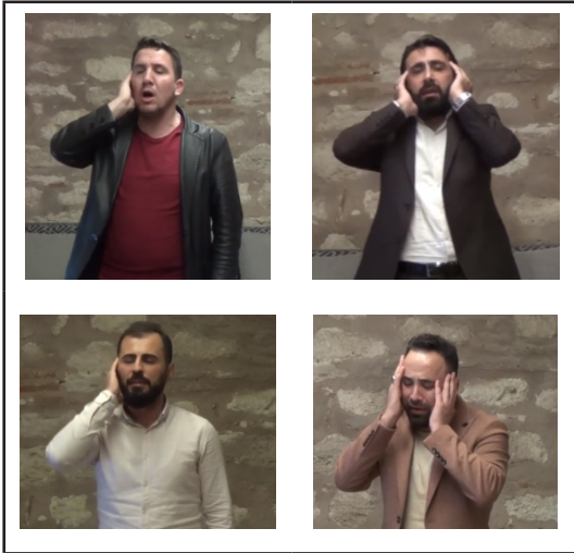
Fotoğraf 2. Bazı katılımcıların ezan performans görüntüleri

Deneysel işlem basamağını oluşturan ses eğitimi çalışmasında katılımcılara öncelikle ses eğitiminin temel konuları olan sesin tanımı, oluşumu, fiziksel özellikleri, insanda ses sistemini oluşturan organların ve fonksiyonlarının tanıtılması, solunum sistemi ve anatomisinin tanıtılması, insanda ses sınıflarının açıklanması, sesin oluşturulması ve kullanımı için uygun bedensel duruşun (postür) gösterilmesi, ses sağlığı ve korunması hakkında bilgi verilmesi, diyafram kası ve nefesi hakkında bilgi verilmesi, rezonans kavramının tanıtılıp rezonans bölgelerinin anatomik yapı özelliklerinin açıklanması ve rezonans sisteminin işlevinin açıklanarak ses eğitiminde göğüs rezonatörlerinin ve kafa rezonatörlerinin yapısal özelliklerinin ve işlevlerinin tanıtılması gerçekleştirilmiştir.