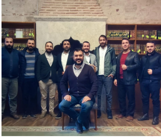
Fotoğraf 3. Deneysel işlem sürecinde araştırmacı ve katılımcıların yer aldığı görüntü

Deneysel işlem basamaklarında katılımcıların hitabet gücünün arttırılmasına yönelik olarak artikülasyon çalışmaları, konuşma sorunlarına yönelik belirlenmiş tekerlemeler, vurgu ve tonlama çalışmaları yapılmıştır.