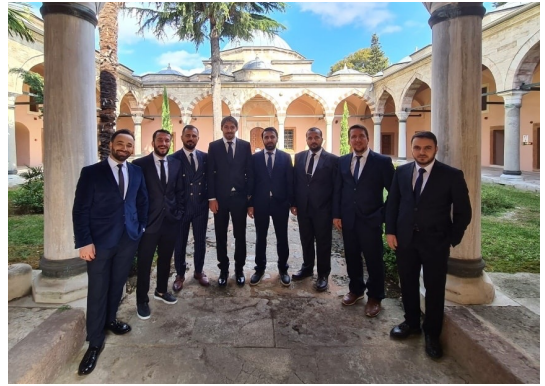
Fotoğraf 4. Deneysel işlem sonunda İstanbul Haseki Reisulkurra Abdurrahman Gürses Dini İhtisas Merkezi'nde 2 katılımcıların yer aldığı görüntü