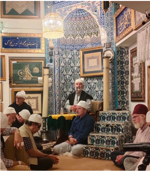
Fotoğraf 1. Mevlid cemiyetinden bir görünüm

Mevlid kelime anlamı itibariyle “doğum” demektir; ancak dinî musiki literatüründe hazret-i Muhammed’in (s.a.v.) doğumunu anlatan manzum eserleri temsil eder. İslâm coğrafyasında ve Türklerde pek çok mevlid yazılmış olsa da Süleyman Çelebi’nin kaleme aldığı “Vesîletü’n-necât” yüzyıllardan bu yana Türk toplumunda toplumsal ve bireysel mühim günlerde okunmaktadır. Mevlid Tevhîd, Nûr, Velâdet, Merhaba, Miraç, Münâcaat olmak üzere altı bahirden oluşur ve hepsi farklı makamda okunur. Kur’ân-ı Kerim tilaveti ve ezan gibi bu form da çok parlak ve dinamik bir eserdir ve icrası için kuvvetli bir ses tekniği, makam ve aruz bilgisi gerekir.