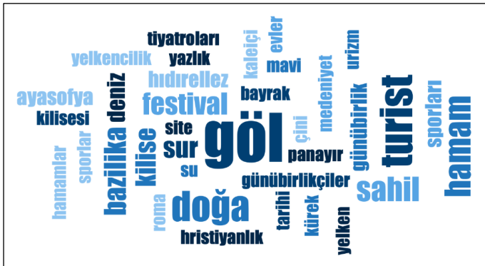
Şekil 2. Katılımcıların zihninde İznik kent kimliği.

Görüşme metinlerinin analizinde öncelikli olarak kent kimliğinin tespiti amaçlanmıştır. Buna göre, görüşme metinleri boyunca mekansal ve tarihsel-kültürel olmak üzere 19 bileşen toplam 104 kez tekrarlanmıştır. Bununla birlikte kent kimliğini tanımlamaya yönelik imgelerde mekansal unsurlara daha fazla yer verilmiştir (Şekil 2). Buna göre, araştırmaya dahil olan katılımcıların zihinsel inşasında İznik'i tanımlayan en önemli unsur İznik Gölü'dür. Ardından doğa ve göl kıyısı olan sahil bölümü sıralanmıştır.