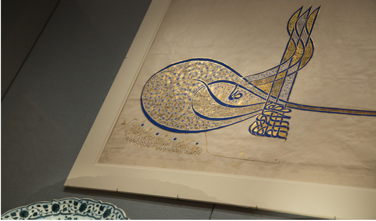
Görsel 4 Muhteşem Süleyman sergisinde sergilenen Kanuni'nin muhteşem tuğrası.

National Gallery of Art'ta başlayıp İngiltere, Federal Almanya, Japonya ve nihayet Fransa'da Louvre Müzesinin katkıları ile Grand Palais'te bitirilen, Kanuni Sultan Süleyman dönemine ait paha biçilemeyen 210 parça eserden oluşan "Muhteşem Süleyman" sergileri, küresel ya da yerel bazda geleneksel sanatlarımızın görmeye başladığı ilginin dönüm noktası olmuş ve koleksiyonerlerimizin cesaretlenmesine çok önemli bir katkıda bulunmuştu (Görsel-4). Çünkü o güne kadar bu eserlerin yalnızca muhafazakâr/mütedeyyin toplum kesimlerinin sınırlı ilgisi ile camilerin tezyin edilmesinden daha öteye gitme şansı bulamayan geleneksel sanatlarımız bir anda ilgi odağı hâline geldi. Zira önemli yabancı devlet adamlarının, sanatçıların, bilim adamlarının, akademisyenlerin ve koleksiyonerlerin bu sergilere gösterdiği yoğun ilgi, bu sanat eserlerinin toplumumuzun her kesimi tarafından kabul görmesini sağlamıştı.