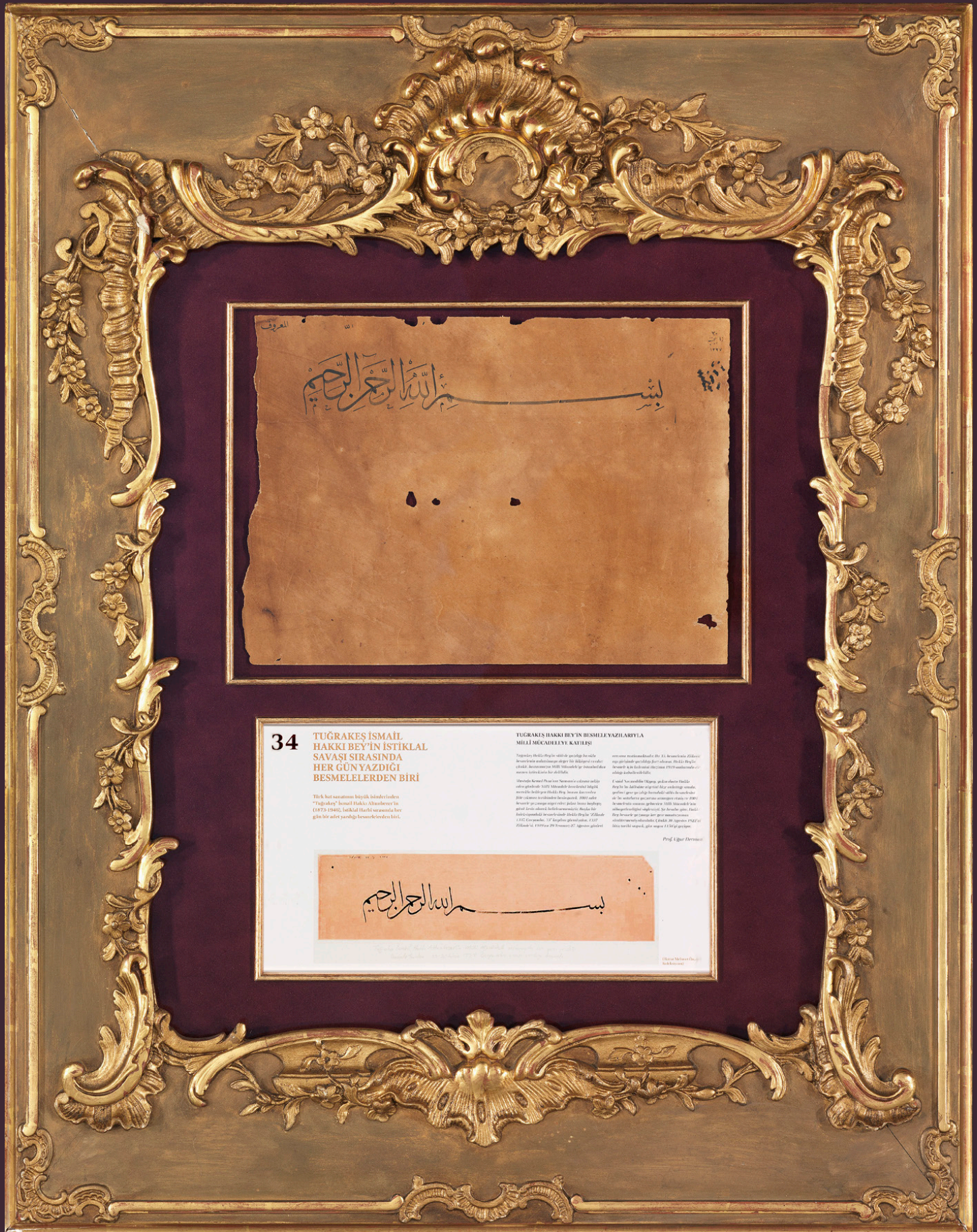
Görsel 1 Tuğrakeş İsmail Hakkı Altunbezer'in Millî Mücadele sırasında yazdığı 30. Besmele-1 Şerif