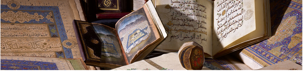
Görsel 5 Londra'da her yıl, yılda iki kez düzenlenen Islamic & Indian Arts müzayedelerinden birinin katalog kapağı.

müzayedelerde satılan tüm eserlerin bilgilerini içerisinde barındıran bir kaynaktı. Fakat bu veri tabanında yer alan kayıtların piyasanın yalnızca çok küçük bir kısmını temsil etmesi nedeniyle kısmen başarılı olsa da genel anlamda bir referans teşkil etme şansı yakalanamadı. Her şeye rağmen özellikle İngiltere merkezli dünyaca bilinen köklü müzayede şirketlerinin hâlen yılda iki kez yapmakta olduğu “Islamic & Indian Arts” müzayedeleri, geleneksel sanatlarımızın yaşayan sanatkarlarının eserleri için olmasa da eski örneklerinin satışlarında referans teşkil etmeye devam ediyor (Görsel-5).