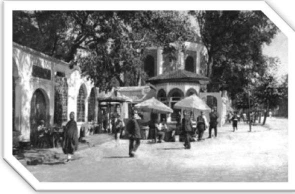
Koca Sinan Paşa'nın Mezarı

siyasetnamelerde olsun bir padişahın iyi ve adaletli olması için sağlam vezirlerinin olması gerektiği üzerinde durulur. En önemlisi de karakter olarak hamasi bir tavrının olmaması istenir. Çünkü bu gibi vezirler haksız yere suçlamalar yaparak faydalı kişilerin öldürülmesine neden olmaktadır.