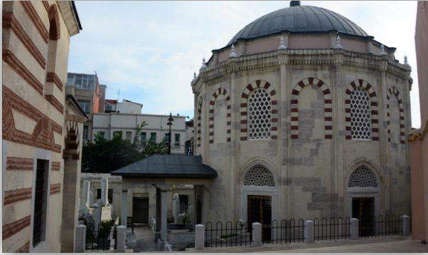
Koca Sinan Paşa Külliyesi

Ancak bu kimseler düşmanlıklarını açıktan belli etmezler, doğru zaman için fırsat kollarlardı. 16. yüzyıl sonundaki en büyük muhalif tavır Ferhat Paşa ve Koca Sinan Paşa tarafından takınıldı. Ferhat Paşa ve Sinan Paşa'nın birbirlerine takındıkları muhalif tavır devleti amansız bir mücadelenin içine sokmuştur. Bu gibi tutumlarından dolayı devşirmeler devleti yıkmakla da suçlanmışlardır. İsmail Hami Danişmend'e göre Koca Sinan Paşa da Ferhat Paşa da hain devşirmelerdir. Birisi Doğu'da birisi Batı'da devleti amansız maceraların içine sürüklemiştir. Hatta İsmail Hami Danişmend, bu konudaki sert değerlendirmesini, Koca Sinan Paşa'nın yüklü mirasını yazdıktan sonra şu şekilde belirtmektedir: "Türk Milleti, her türlü zararlarıyla ihanetlerine katlandığı devşirmeleri asırlar boyunca işte böyle beslemiş, fakat bir türlü doyuramamıştır." Devleti amansız bir maceraya soktukları gerçektir. Ancak bu durumu devleti yıkmak için plânladıkları söylenemez.