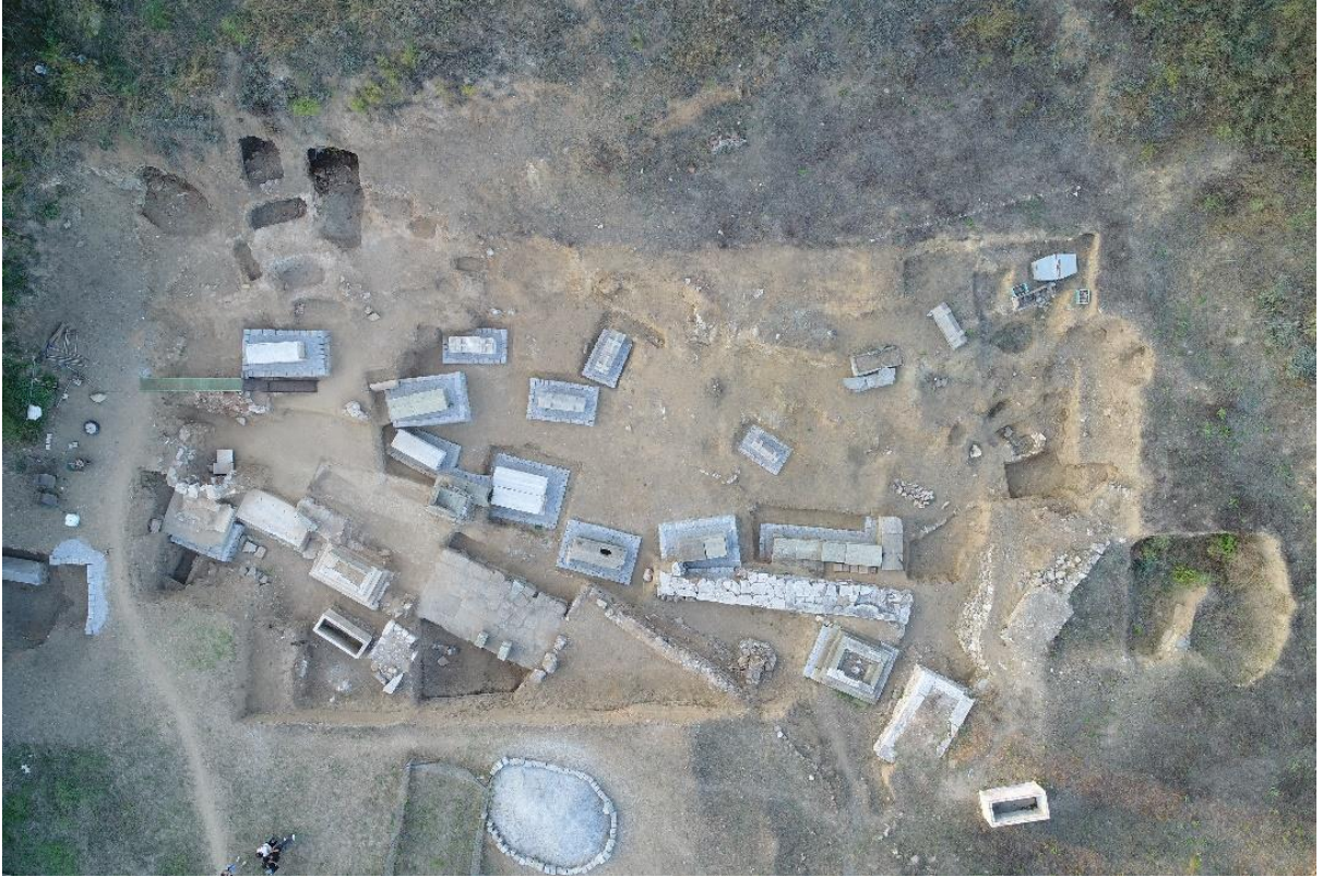
Figür 5: Güney-Tavşandere Nekropolisi