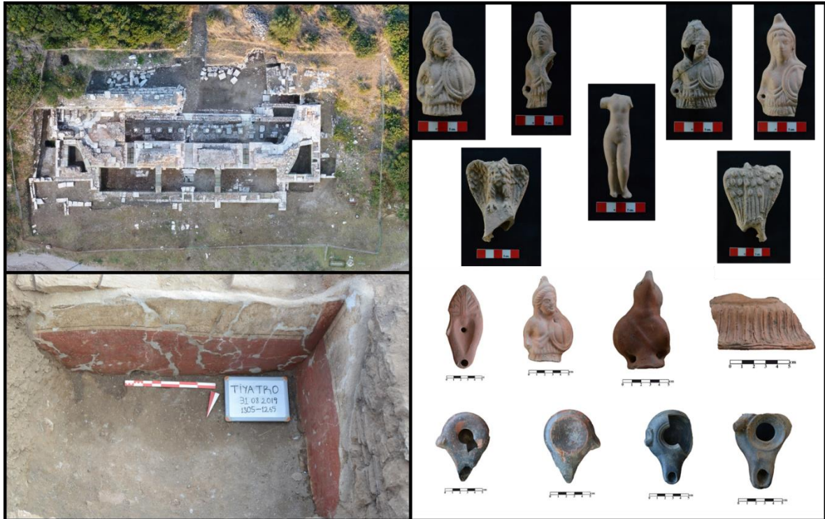
Figür 19: Tiyatro