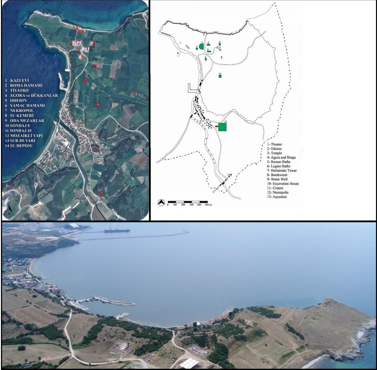
Figür 1: Parion kenti havadan görünüm ve çalışma yapılan alanlar