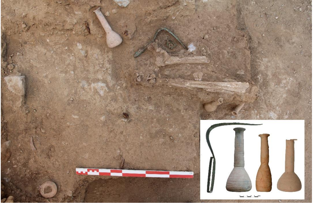
Figür 16: M 231 Numaralı Mezar gömü biçimi ve buluntular