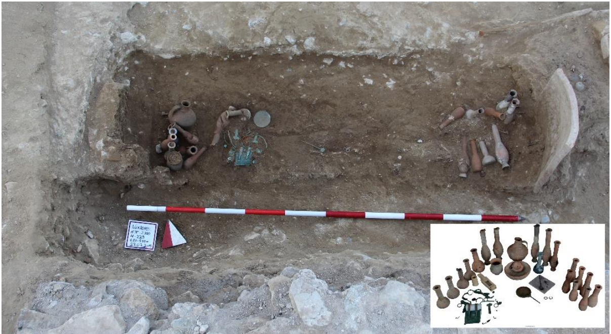
Figür 15: M 229 Numaralı Mezar gömü biçimi ve buluntular