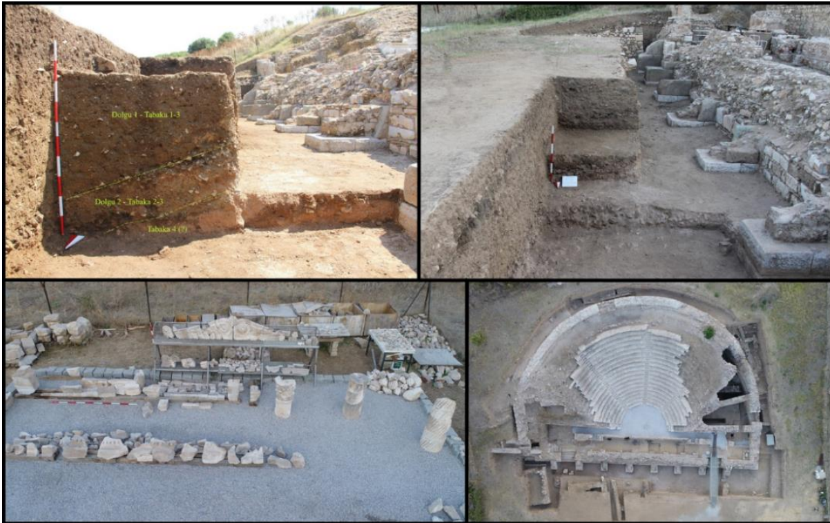
Figür 3: Odeion