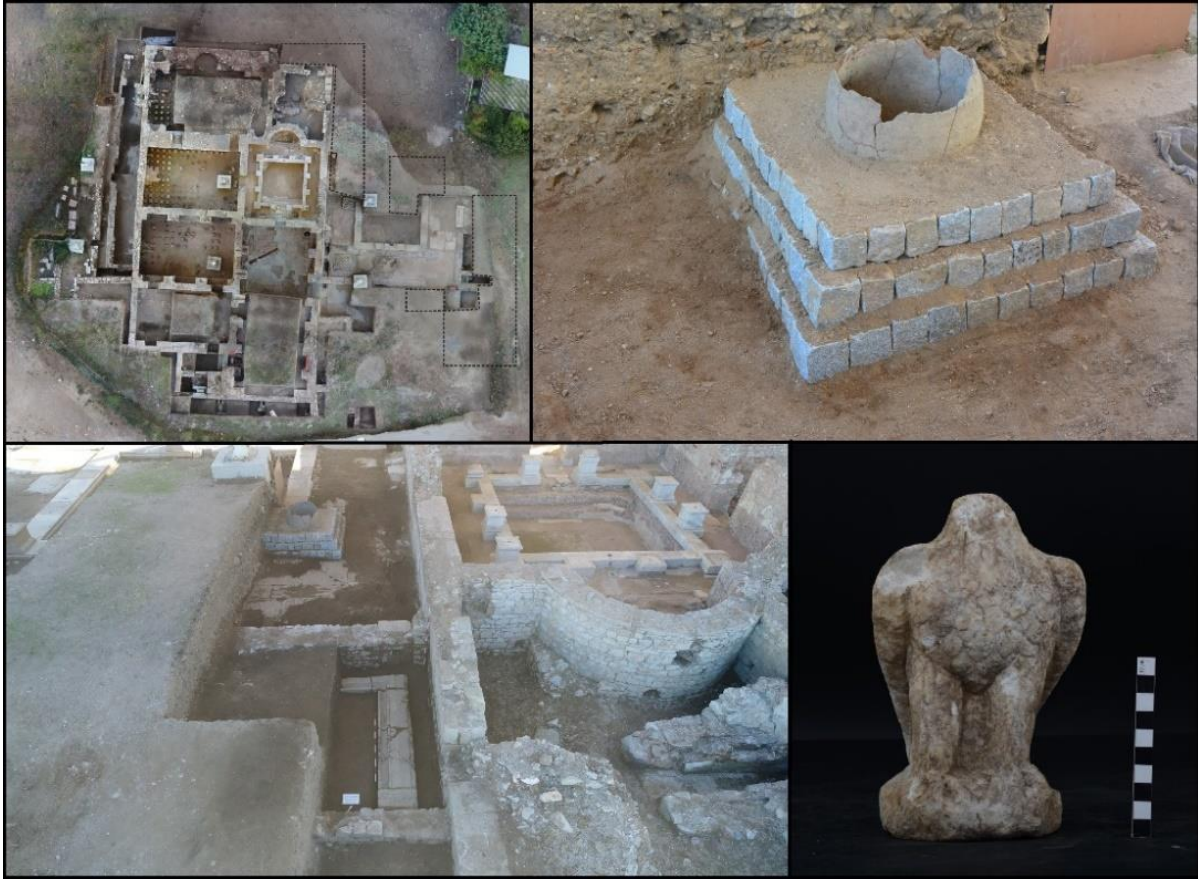
Figür 2: Roma Hamamı