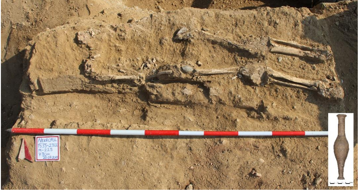
Figür 8: M 225 Numaralı Mezar iç kısmı