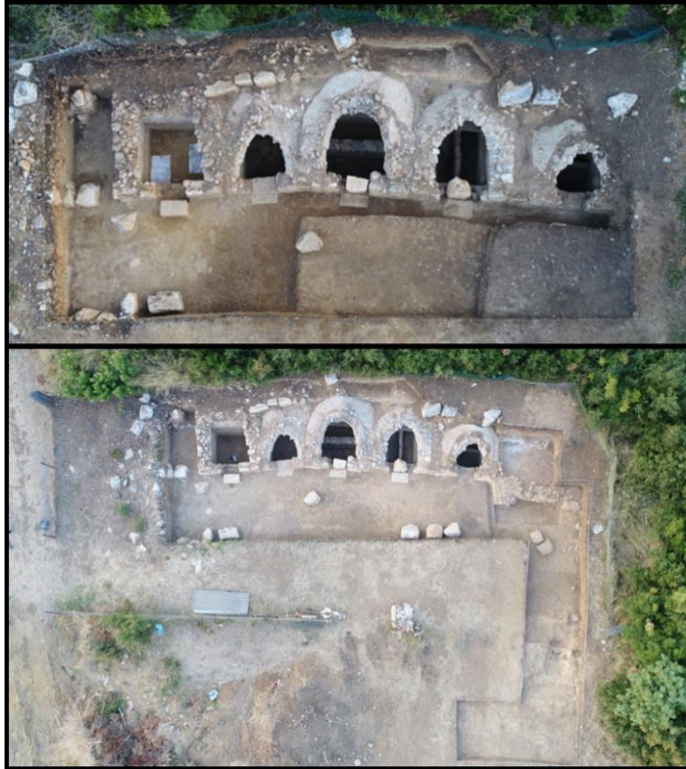
Figür 21: Toprakkule Mevkii Oda Mezarlar