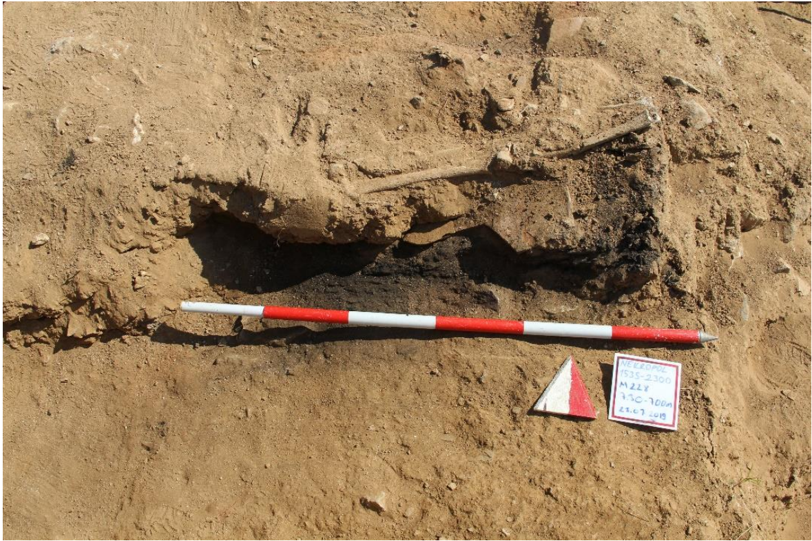
Figür 13: M 228 Numaralı Mezar