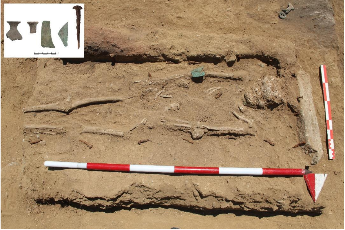
Figür 12: M 227 Numaralı Mezar