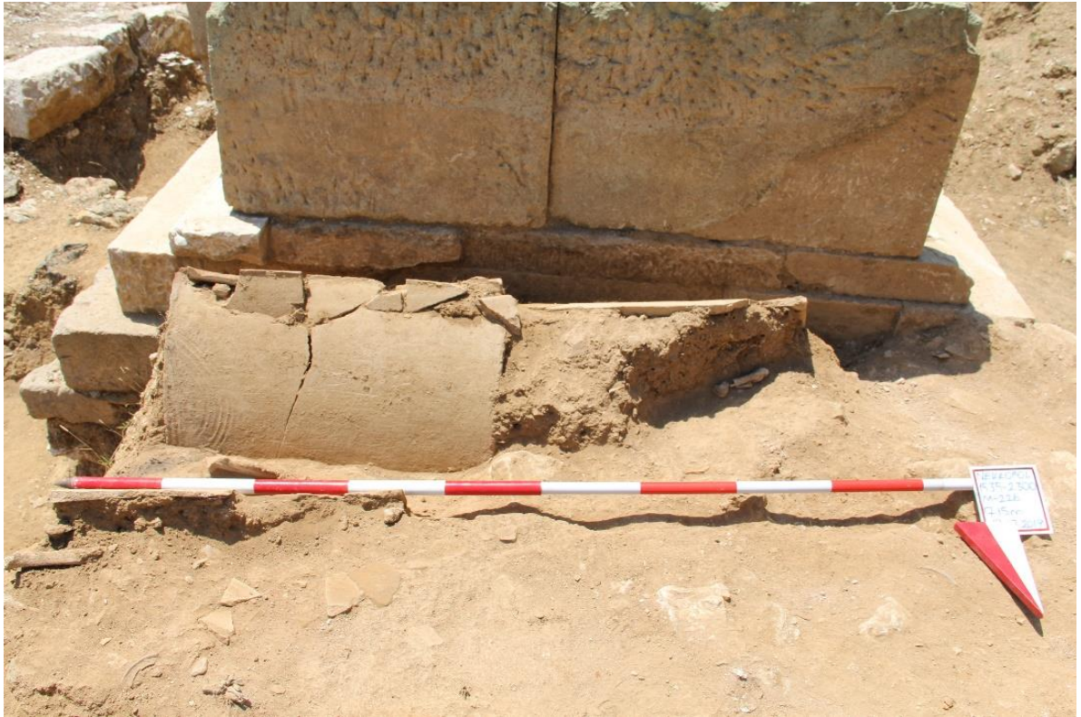
Figür 9: M 226 Numaralı Mezar