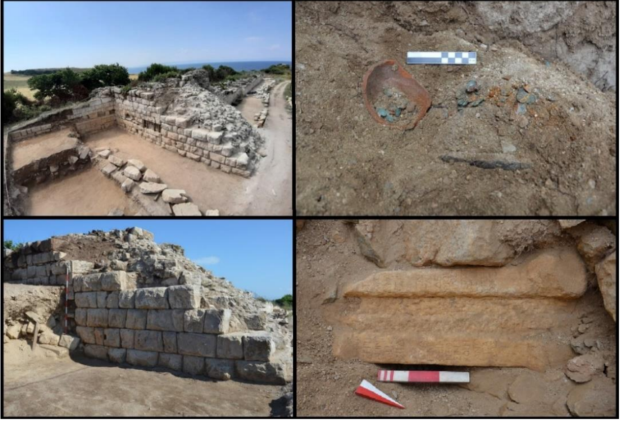
Figür 4: Akropol Dođu (İç) Sur