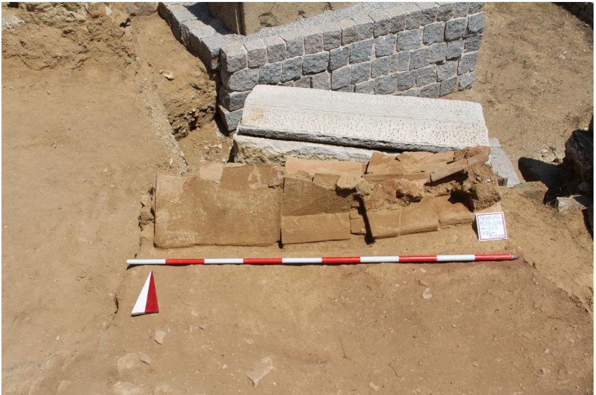
Figür 7: M 225 Numaralı Mezar