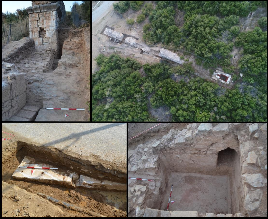
Figür 20: Su Kemer