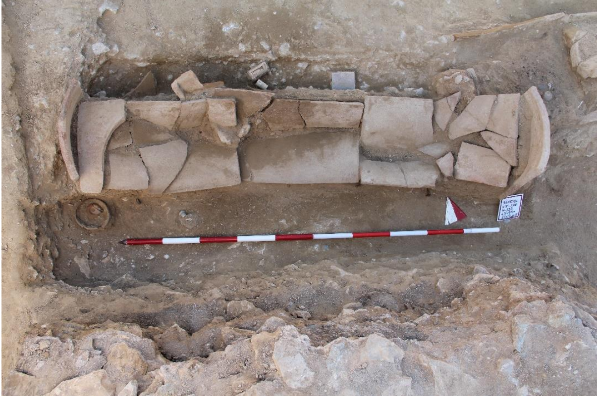
Figür 14: M 229 Numaralı Mezar