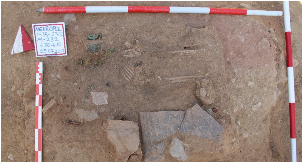
Figür 17: M 231 Numaralı Mezar