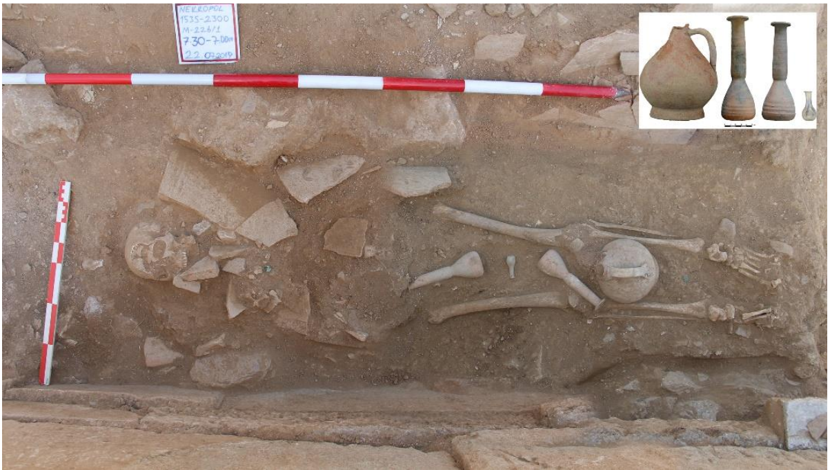
Figür 11: M 226 Numaralı Mezar ikinci gömü evresi