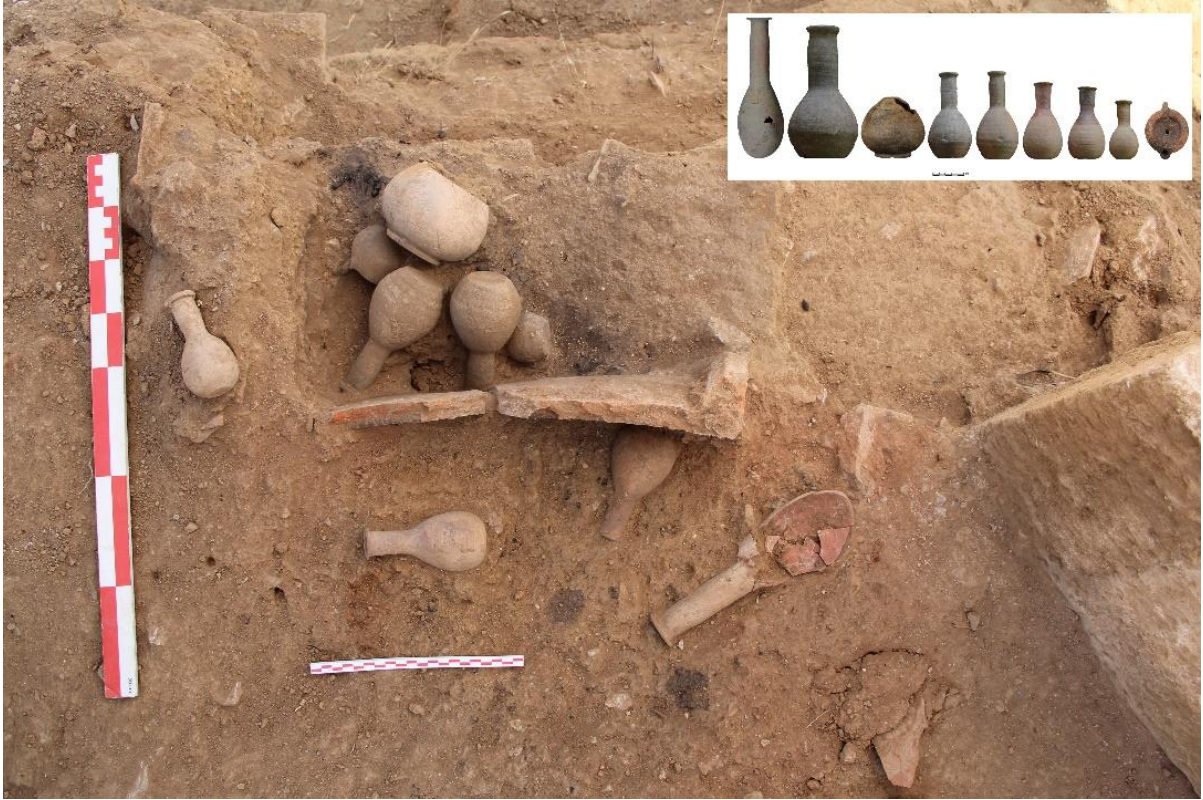
Figür 6: M 224 Numaralı Mezar