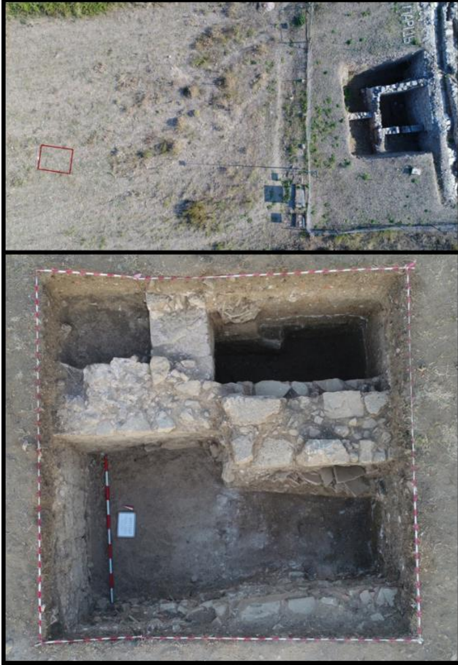
Figür 22: Sondaj 12