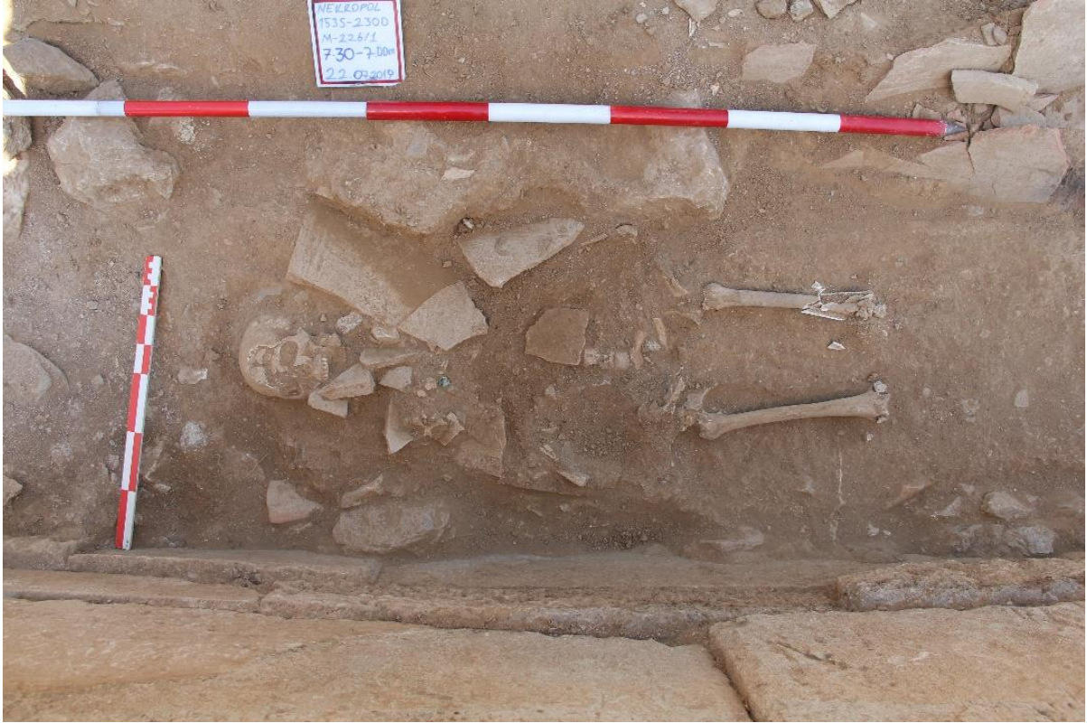
Figür 10: M 226 Numaralı Mezar birinci gömü evresi