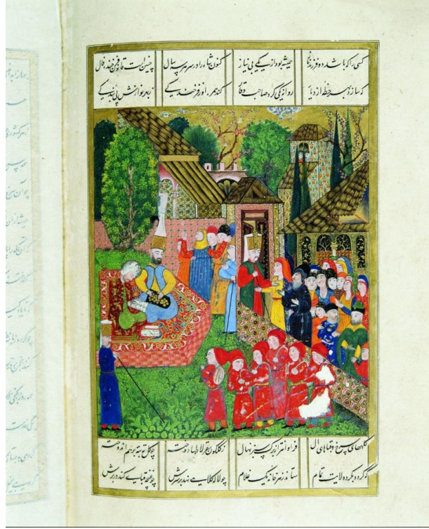
Şekil 1: Devşirme Usûlünün Resmedildiği Bir Minyatür

Saray için ayrılanlar oğlanlar Edirne, Galata ve İbrâhim Paşa saraylarında belli bir eğitime tâbi tutularak içlerinden en kabiliyetli olanları Topkapı Sarayı’na alınırdı (İlgürel, 1998, s.324). İstanbul’a getirilen devşirme oğlanlar tekrar yoklanarak içlerinden vefat etmiş olanlar eşkal defterinden çıkarılır, hasta olanlar ise deftere kaydedilerek iyileştikleri zaman tekrar ağa önüne çıkarılarak yoklamaları gerçekleştirilirdi (Anonim, [yz.] 1606: 13a).