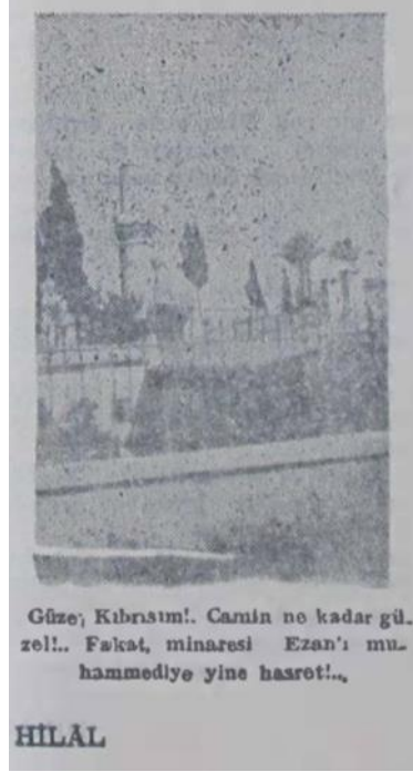
Hilal Dergisi 1. Sayısından bir Resim

Yazının birinci paragrafında bahsi geçen anlaşma 1960 yılında Türkiye, İngiltere ve Yunanistan'ın garantörlüğünde kurulacak olan Kıbrıs Cumhuriyeti için 11 Şubat 1959'da imzalanan Londra ve Zürih anlaşmalarıdır. 26 Bu anlaşma ile Kıbrıs'ta İngiliz idaresi resmen son bulacak Rum ve Türklerin ortak olduğu bir Cumhuriyet kurulacaktır. 27 Hikmetağalar "bu anlaşma pek de müspet neticeler vereceğe benzemiyor" demekle haklı çıkmış, Kıbrıs Cumhuriyeti kurulduktan üç yıl sonra on bir yıl sürecek olan 1963-1974 olayları başlamıştır. Kıbrıs'ta yaşananlara yazar yine İslam aleminin meselesi olarak dikkat çekerek İslamcı kimliğini ortaya koymuştur. Nitekim ikinci paragrafta kendisini mukaddesatçı Türk olarak tanımlamıştır.