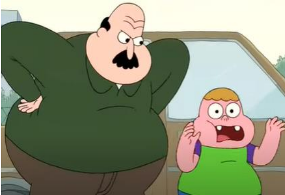
Resim 12. Clarence Sorgulama Bölümü

Cartoon Network kanalında incelenen çizgi filmlerde psikolojik şiddet unsurları; Koca Ayı'nın, Maşa etrafı dağıttığı için ona aşırı kızgın yüz ifadesi ile bakması (Maşa ile Koca Ayı – Bilinmeyen Ayak İzleri Bölümü – Dakika: 04.17), kötü karakterin yardımcısına aşırı kızgın yüz ifadesi ile bakması (Jade Armor – Parfüm Bölümü – Dakika: 10-48), köylülerin ayıcıklara kızgın yüz ifadesi ile bakması (Kafadar Ayıcıklar – Ayı Kılıcı Bölümü – Dakika: 08.40). Grizzly'nin Lemming'e karşı kızgın surat ifadesi ile bakması (Grizzy ve Lemmingler – Ayılar Giremez Bölümü – Dakika: 00.16), Kaslı Gece Kurtları sürüsünün Uncle Grandpa ve Belly'e karşı sivri dişlerini göstermesi (Uncle Grandpa – Göbek Kardeşler Bölümü – Dakika: 04.50), müdürün Clarence ile kızgın yüz ifadesi ile konuşması (Clarence – Sorgulama Bölümü- Dakika: 01.02) şeklinde yansıtılmıştır.