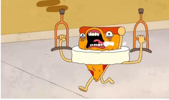
Resim 8. Uncle Granpa Pizza Steve'in Geçmişi Bölümü