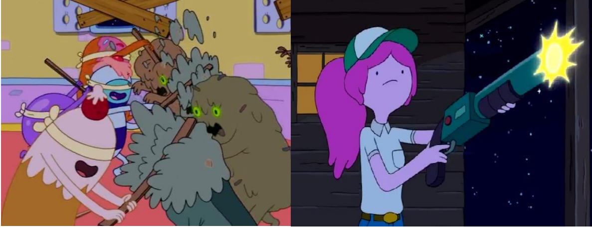
Resim 7. Adventure Time, sırasıyla Pijama Partisi Paniđi Bölümü ve Haşereler Bölümü