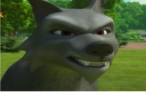
Resim 10. Doru Saklı Göl Bölümü