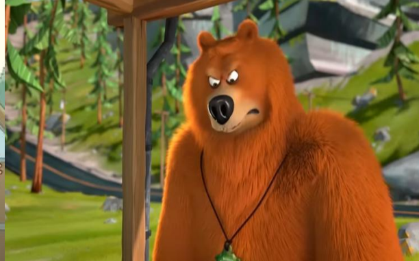
Resim 13. Grizzy ve Lemmingler Ayılar Giremez Bölümü

Örneklere bakıldığında psikolojik şiddet; karakterlerin karşısındaki kişiyi korkutması, diğer karakter üzerinde üstünlük sağlama amacıyla sinirlenme ve kızgınlık sonucunda ortaya çıkmaktadır. Uygulanan şiddet yalnızca kötü karakterler tarafından değil aynı zamanda iyi olarak yansıtılan karakterler tarafından da uygulandığı gözlemlenmiştir.