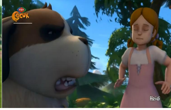
Resim 11. Heidi Minik Kuşu Kurtarmak Bölümü

Cartoon Network kanalında incelenen çizgi filmlerde psikolojik şiddet unsurları; Koca Ayı'nın, Maşa etrafı dağıttığı için ona aşırı kızgın yüz ifadesi ile bakması (Maşa ile Koca Ayı – Bilinmeyen Ayak İzleri Bölümü – Dakika: 04.17), kötü karakterin yardımcısına aşırı kızgın yüz ifadesi ile bakması (Jade Armor – Parfüm Bölümü – Dakika: 10-48), köylülerin ayıcıklara kızgın yüz ifadesi ile bakması (Kafadar Ayıcıklar – Ayı Kılıcı Bölümü – Dakika: 08.40). Grizzly'nin Lemming'e karşı kızgın surat ifadesi ile bakması (Grizzy ve Lemmingler – Ayılar Giremez Bölümü – Dakika: 00.16), Kaslı Gece Kurtları sürüsünün Uncle Grandpa ve Belly'e karşı sivri dişlerini göstermesi (Uncle Grandpa – Göbek Kardeşler Bölümü – Dakika: 04.50), müdürün Clarence ile kızgın yüz ifadesi ile konuşması (Clarence – Sorgulama Bölümü- Dakika: 01.02) şeklinde yansıtılmıştır.