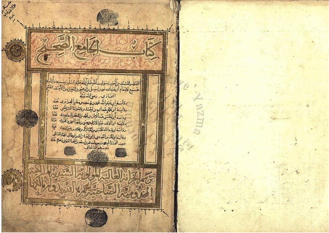
Resim 1: en-Nüveyrî (ö. 733/1333) hattıyla senesinde Sittü'l-Vüzerâ'nın bulunduğu Sahîh-i Buhârî nüshası (Köprülü Yazma Eserler Kütüphanesi, Fazıl Ahmed Paşa, no. 362).

Kaynaklarda Sittü'l-Vüzerâ'nın hocaları arasında babası ile İbnü'z-Zebîdî'den başka bir isim yer almaz. Bu durum akıllara bazı soruları getirmektedir. Hoca-talebe ilişkisinin bu kadar yoğun olduğu ve ilmi bir çevrede yetişen Sittü'l-Vüzerâ'nın babası dışında sadece bir hocadan ders alması mümkün gözükmemektedir. Nitekim Yusuf Ma'tûk da Sittü'l-Vüzerâ'nın hoca sayısının azlığına taaccub etmiş, Meşyaha-Fehrese türü kitapların neşredilmesinden sonra ders aldığı diğer hocalarının da gün yüzüne çıkacağını ümit ettiğini belirtmiştir. 60 Ancak bugün Mu'cem-Meşyaha-Fehrese türü kitapları incelediğimizde Sittü'l-Vüzerâ'nın başka bir hocasının ismine rastlamamaktayız.