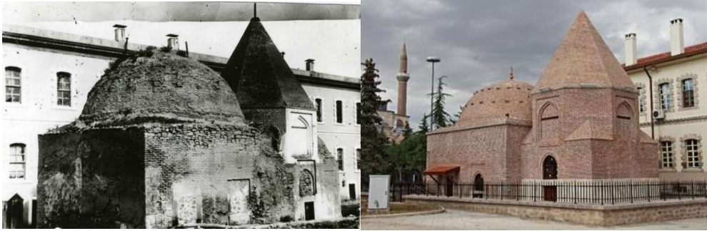
Görsel 9. Ulvi Sultan Türbesi ve Mescidi (Restorasyon Öncesi ve Sonrası)

Konya Valilik binası yanında bulunan Ulvi Sultan Türbesi ve Mescidi'nin 2018 yılında Konya Büyükşehir Belediyesi tarafından restorasyonuna başlanılmıştır. 1924 yılında yıkılan ve toprak altında kalan mescit ve türbe iki yıllık çalışmanın ardından 2020 yılında ziyarete açılmıştır (Tomar, 2021: 38-39).