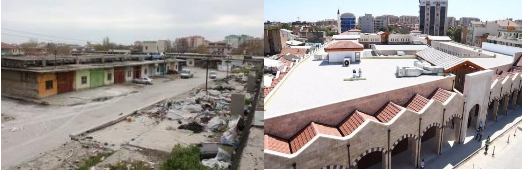
Görsel 11. Eski Buğday Pazarı (Restorasyon Öncesi ve Sonrası)