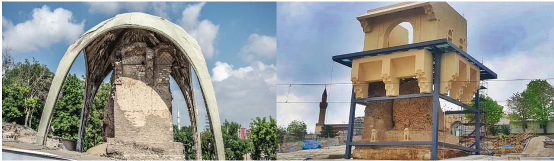
Görsel 7. 2. Kılıçaslan Köşkü (Restorasyon Öncesi ve Sonrası)

Şimdiye kadar 2. Kılıçaslan Köşkü'nün etrafını saran Selçuklu eseri 5 metre yüksekliğinde 6 burçlu iç sur duvarları ortaya çıkarılmıştır. Tarihi Kentler Birliği'nin düzenlediği 'Metin Sözen Koruma Büyük Ödülü'nü kazanan 2. Kılıçaslan Köşkü Arkeolojik Kazı Alanı ve Kentsel Tasarım Projesi tamamlandığında Konya, yeni bir tarihi mekana kavuşmuş olacaktır (KBB, 2016: 29).