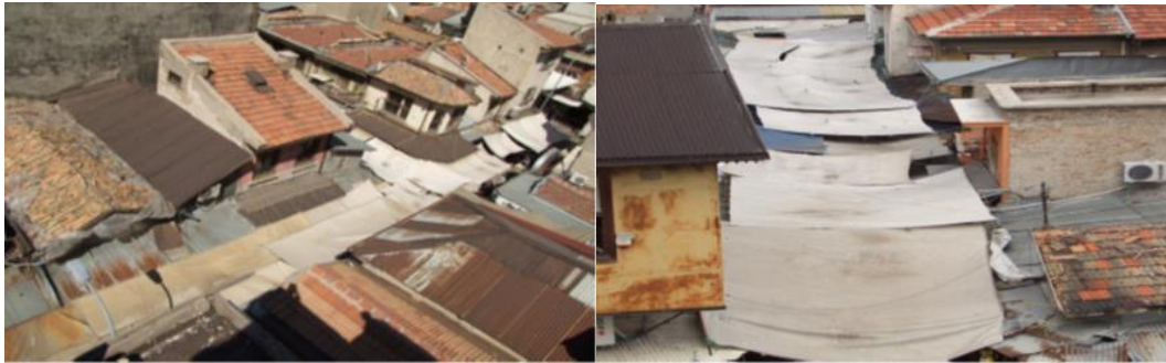
Görsel 5. Tarihî Bedesten Çarşısı (Restorasyon Öncesi)

Mevlana Kültür Vadisi Projesi kapsamında, Bedesten Çarşısı'nda yaklaşık 95 bin m 2 'lik alanda 7 cadde içerisinde bulunan 40 sokaktaki 2 bin 700 civarında dükkânda düzenleme yapılmıştır. Projenin kapalı mekan alanı toplamı yaklaşık 180.000 metrekare olup 66 ada ve 945 parselden oluşan proje kapsamında, düzenleme yapılmıştır. Alanda 3 adet iç, 4 adet dış cadde yeniden düzenlenmiştir. Çarşıda yer alan dükkânların konumu ve ürünlerin sergileniş biçimi geleneksel karaktere uygun olarak düzenlenmiştir. Bölgede toplam 519 bina bulunmaktadır. Bu binaların 138'i tescil edilmiş 381'i ise tescil edilmemiştir. Bölgede 40 adet sokakta gerçekleştirilen sokak cephesi düzenlemesi sonucunda, 2.687 adet dükkânda düzenlemeye gidilmiştir. Proje maliyeti 96.451.739,64 TL olarak gerçekleşmiştir (KBB, 2016: 16). Proje ile Kapı Camii ile Aziziye Cami'nin yanı sıra Bulgur Dede Mescidi, Mecidiye Han, Ahmet Efendi Hamamı, Nakip Hacı İbrahim Hanı gibi tescilli yapılar da restorasyona tabi tutulmuştur. Hatta bu proje ülke genelinde 111 belediyenin katılımı ile gerçekleştirilen yarışmada İdeal Kent Ödülü'ne layık görülmüştür (goKonya).