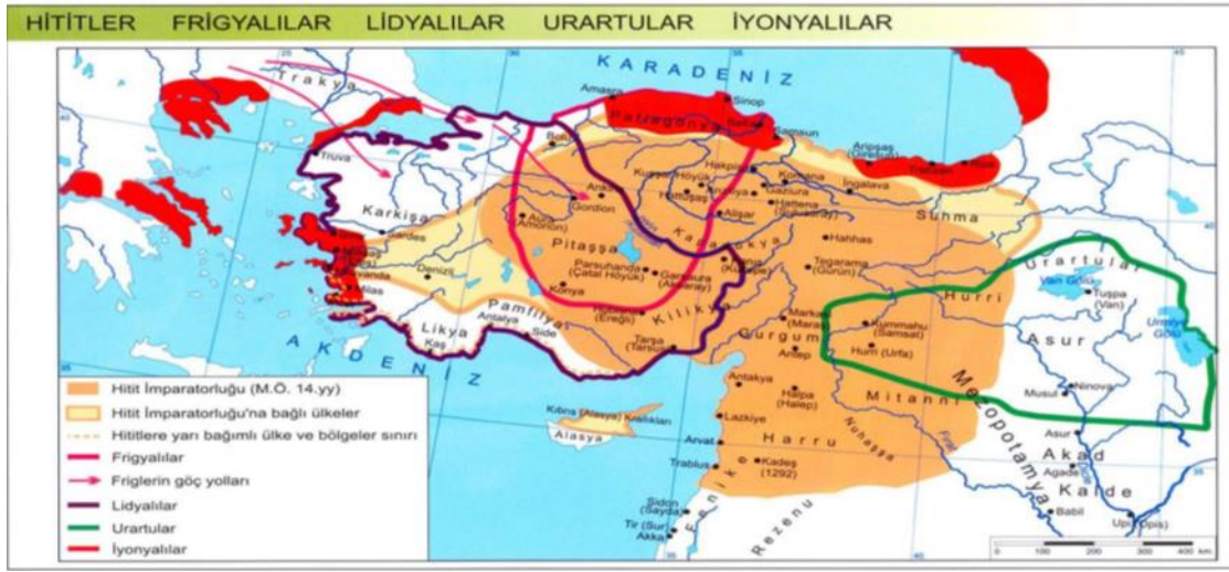
Görsel 1. Medeniyetlerin Beşiği Konya