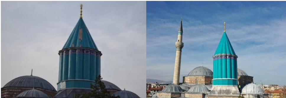
Görsel 4. Mevlana Türbesi Yeşil Kubbe (Restorasyon Öncesi ve Sonrası)

Bugünkü şeklini Kanuni Sultan Süleyman döneminde alan Yeşil Kubbe (Kubbe-i Hadra) 1698, 1798, 1816, 1835, 1912, 1949 ve 1964 yıllarında restorasyonlar geçirmiştir. Haziran 2020'de tarihinin en kapsamlı restorasyonuna başlanmış ve Aralık 2021'de tamamlanarak, Şeb-i Arus Törenleri'ne yetiştirilmiştir. Yeşil Kubbe restorasyonunda yıpranan, yer yer dökülen çiniler (Görsel 5) sökülmüştür. Yeşil Kubbe'nin çinileri ile altındaki tuğla kubbe arasında yer yer 15 ila 18 santimetre kalınlığa ulaşan yaklaşık 100 ton beton ve moloz temizlenmiştir. Bilim kurulunun çalışmaları sonucunda müze arşivinde bulunan 1816 ve 1835 yıllarına ait çini örneklerinden yola çıkılarak aslına en uygun şekilde yeni çiniler üretilmiştir (Özgül, 2022; Doğan, 2021).