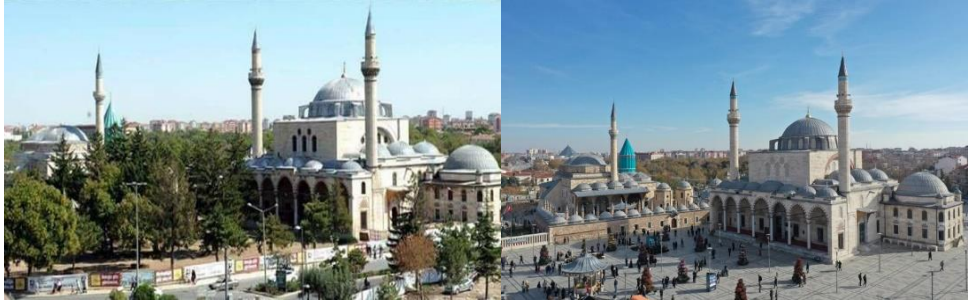
Görsel 3. Mevlana Meydanı (Eski ve Yeni Hali)

Tarihi kent merkezini oluşturan farklı kent parçalarından, gerek sivil mimarlık örneği gerek anıtsal nitelikli tekil yapılardan gerek doku ölçeğindeki yapı adalarından, kentsel altyapı sorunlarının çözümünden kent mekânına eklenecek yeni anıtsal öğelere, karakteristik simgeler ve kent tarihine atıfta bulunan 'imaj'lara, kültürel ve turistik tesislerden bir takım mekâna ilişkin düzenlemelere, tarihi mekânların yeniden canlandırılması, restorasyon ve röleve çalışmaları ile bütün bu yerleşik dokuya ve çalışmalara ekle(mle)necek müze ve sergi salonları gibi tamamlayıcı kültür tesislerinden oluşmaktadır. Proje kapsamında tescilli anıtsal yapıları ve sivil mimarlık örneklerini restore etmek, başarılı çevre düzenlemeleri ile bu kentsel simge değeri taşıyan yapıları öne çıkarmak, korunmasını sağlamak ve yaşatarak gelecek nesillere aktarılmasını sağlamaktır (Eseroğlu, 2018:76-79).