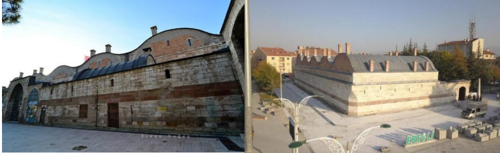
Görsel 10. Rüstem Paşa Kervansarayı (Restorasyon Öncesi ve Sonrası)

Kanuni Sultan Süleyman'ın veziri olan Damat Rüstem Paşa tarafından Ereğli'de Mimar Sinan'a yaptırılan ve geçmişte hac yolcularının uğrak yeri olan (Doğan, 2019) kervansaray Konya Büyükşehir Belediyesi tarafından 2017 yılında restorasyona başlanmış ve 2019 yılında hizmete açılmıştır.