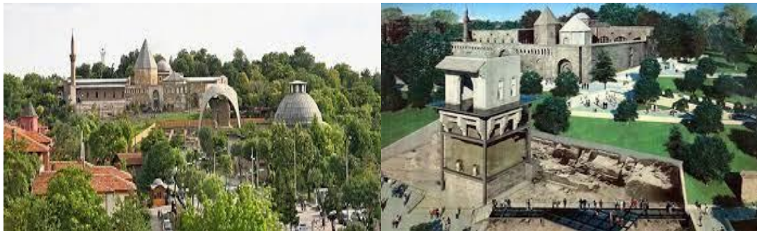
Görsel 8. Alaeddin Tepesi (Restorasyon Öncesi ve Sonrası)