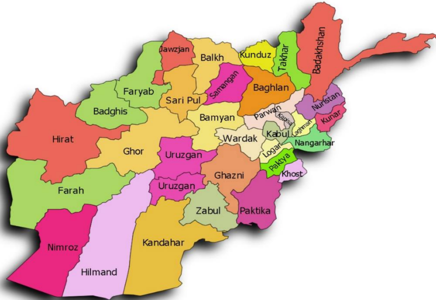
Harita 2: Afganistan Şehir haritası.