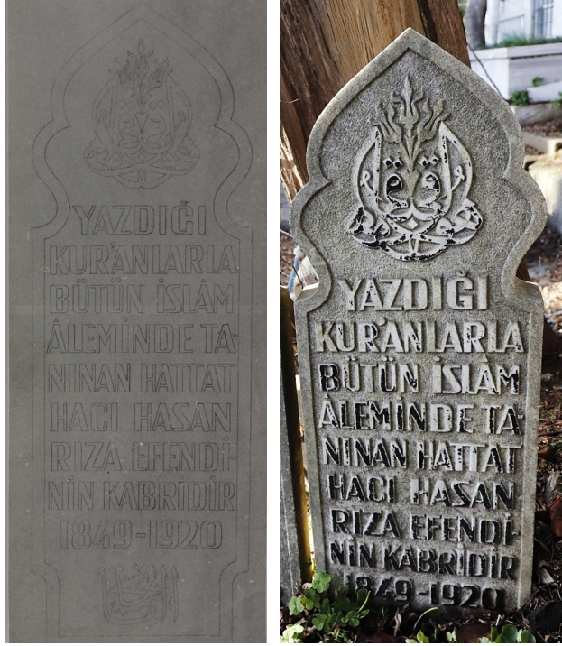
Görsel 4 Hasan Rıza Efendi'nin Atıf Saynaç tarafından hazırlanan mezar taşı yazı kalıbı (Ünver, Hasan Rıza Efendi Dosyası, SK, nr. 27, s.2) ve Rumeli Hisarı Kabristanında bulunan kabir taşı