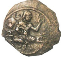
Resim 1. Bağdaş Kurmuş Kağan Tasviri (Babayar, 2007: 57).

Zira bir figürün bu şekilde betimlenmesi, hükümdarlık alameti olarak kabul edilmiştir. Sikkenin ön yüzünde kullanılan kozmik hilal ve yıldız motifleri, Köktürkler için gök kültürünün önemine gönderme yapmasıyla açıklanabilir. Figürün uzun saçlı olması ve sol elinde tuttuğu kuşla birlikte tasvir edilmesi ise söz konusu olan figürün savaşı ya da avcı gibi kişisel meziyetleriyle övülmüş olması şeklinde yorumlanabilir. Türk Sanatında yoğun olarak kullanılan kuş figürü çoğunlukla av hususunda mahir avcılara gönderme yapmak için kullanılmıştır (Öney, 1992: 37). Kartal vb. yırtıcı kuşların hükümdarlık alameti olarak kullanıldığı da söz konudur.