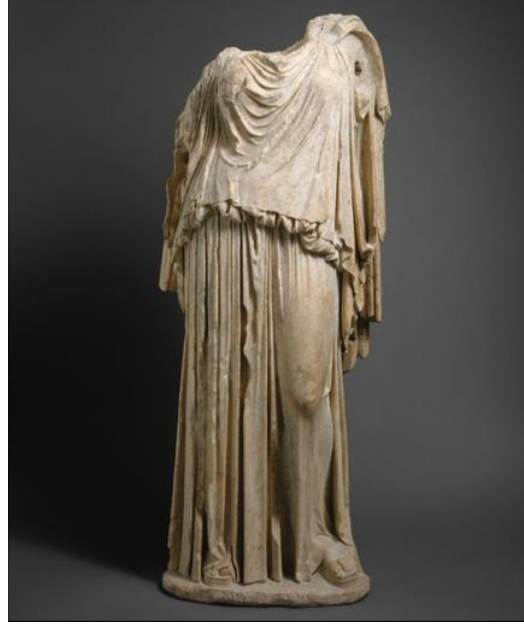
Görsel 1: MÖ 500 yılına ait Antik Yunan Döneminde Kullanılan “Peplos” Adlı Giysi

Ortaçağ heykelinden Veit Stoss’un “Meryem ve Çocuk” (Virgin and Child) adlı ağaç oyma çalışmasında ise giysiye öncelikle drape ağırlıklı bir form yaratma açısından yaklaşılmıştır (görsel 2). Hareketli bir duruş adına, giysinin vücuttan neredeyse tamamen ayrıldığı, derin ve gölgeli girinti çıkıntıların, kırık düzlemler biçiminde şekillendirildiği görülmektedir (Atıl,2013).