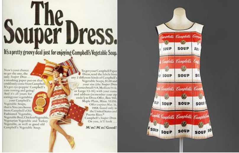
Görsel 5: Andy Warhol, Pamuklu Kağıt Üzerine Serigrafi Baskı, 1965