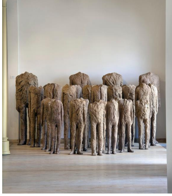
Görsel 6: Magdalena Abakanowicz, Crowd, Karışık Teknik, 1990-2000