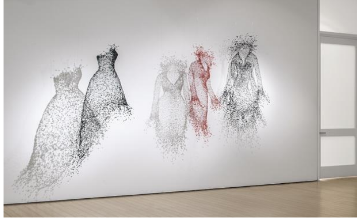
Görsel 8: Key-Sook Geum, Tel ve Boncuklar, 2012

Key-Sook Geum adlı Koreli sanatçı bir başka örnek olarak verilebilir. Geleneksel Kore giysi formlarından ve haute couture soyundan esinlenerek heykelsi nesnelere yaratan bu sanatçı, giysinin kendisinden ziyade giysinin formundan yola çıkarak eserlerini oluşturmuştur (görsel 8). Hassas ve dramatik konuları, renkli teller, ipek tüller, boncuk, kristal, mercan ve yarı değerli taş gibi malzemelerle birleştirerek kültürler arasında yankı bulan manevi ve hümanist idealleri somutlaştırdığı heykeller yapmaktadır. Aynı zamanda heykeltıraş olarak bu sanatçı tekstil ve heykel disiplinine ait hacim olgusunu tekstil disiplinine ait teknik ve malzeme birlikteliği ile birleştirerek, iki disiplini ortak noktada buluşturmuştur.