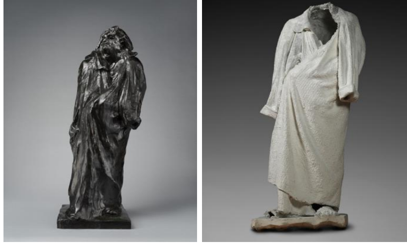
Görsel 4: Auguste Rodin, “Balzak Anıtı”(1897), alçı, “Balzak Anıtı” (1898)