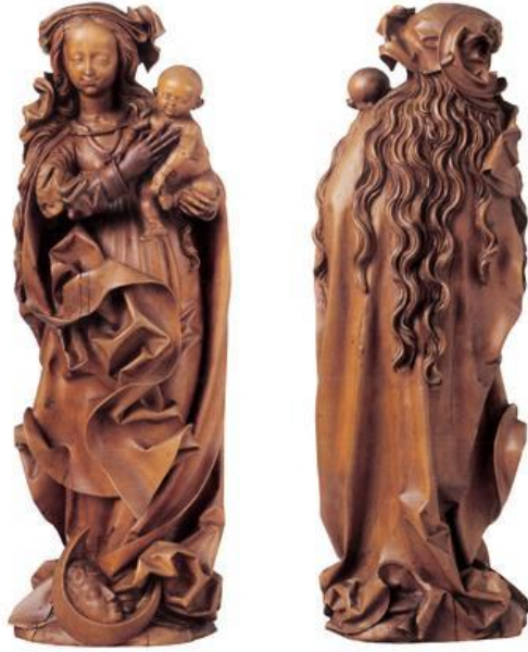
Görsel 2: Veit Stoss, ”Meryem ve Çocuk İsa”, Londra

Ortaçağ heykelinden Veit Stoss’un “Meryem ve Çocuk” (Virgin and Child) adlı ağaç oyma çalışmasında ise giysiye öncelikle drape ağırlıklı bir form yaratma açısından yaklaşılmıştır (görsel 2). Hareketli bir duruş adına, giysinin vücuttan neredeyse tamamen ayrıldığı, derin ve gölgeli girinti çıkıntıların, kırık düzlemler biçiminde şekillendirildiği görülmektedir (Atıl,2013).