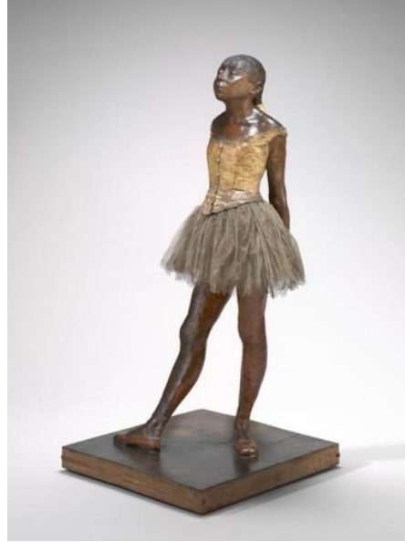
Görsel 3: Edgar Degas, “14 Yaşında Küçük Dansçı Kız”( Balmumu, Saç, Kurdele, Pamuk Bluz, Bale Ayakkabısı, Muslin Tutu, Ahşap Kaide, 1878-1881