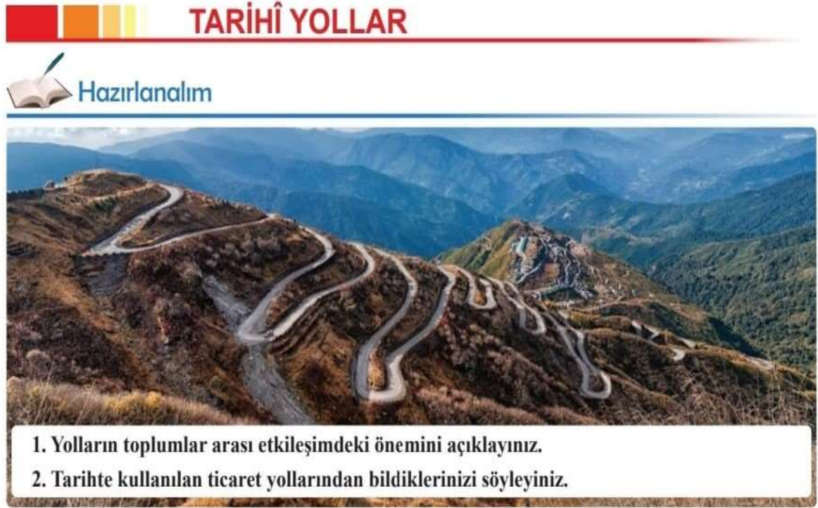
2.64: İpek Yolu'nun bir güzergâhı

“Tarihî Yollar” başlıklı konu, ders kitabının 95-98. sayfaları arasında yer almaktadır. Konu içeriğinde iki tane fotoğrafın yanı sıra üç tane harita kullanılmıştır.