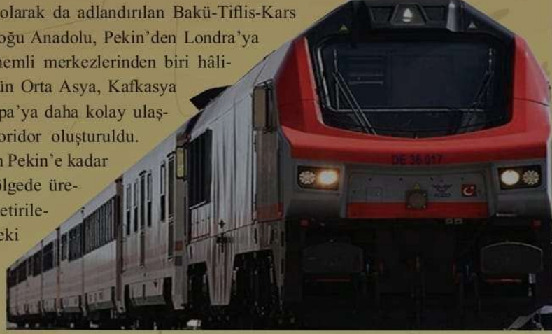
2.67: BTK Demir Yolu Projesi'nde Bakü'den Kars'a Yola Çıkan Tren

"Demir İpek Yolu" olarak da adlandırılan Bakü-Tiflis-Kars Demir Yolu Projesi ile Doğu Anadolu, Pekin'den Londra'ya uzanan İpek Yolu'nun önemli merkezlerinden biri hâline geldi. Türkiye ile bütün Orta Asya, Kafkasya ve Asya ülkelerinin Avrupa'ya daha kolay ulaşmasını sağlayacak bir koridor oluşturuldu. Londra'dan kalkan bir tren Pekin'e kadar kesintisiz gidebilecek. Bölgede üretilen ürünler, bölgeye getirilecek ham madde, o bölgedeki ürünlerin pazarlara ulaştırılmasında kesintisiz demir yolu taşımacılığı çok önemlidir.