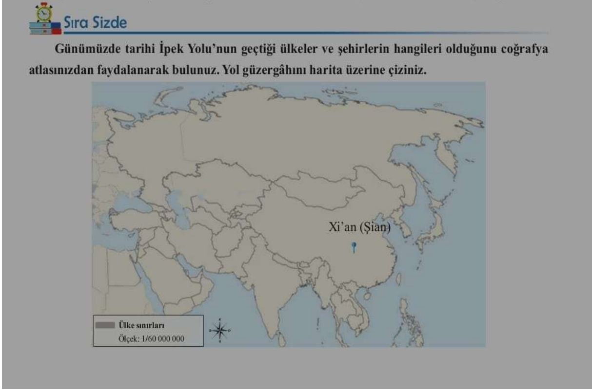
Görsel 3: Dilsiz harita (Yıldırım vd., 2023: 96)

İpek Yolu konusunun sonunda yer alan “Sıra Sizde” bölümünde, üzerinde sadece İpek Yolu’nun başlangıç noktası Çin’in Xi’an (Şian) kentinin işaretli olduğu dilsiz haritaya yer verilmiştir. Öğrencilerden de coğrafya atlası yardımıyla, İpek Yolu’nun günümüzde geçtiği ülke ve şehirleri bularak tarihî ticaret yolunun güzergâhını çizmeleri istenmiştir. Dilsiz haritalar öğrenmeyi kalıcı hale getirme noktasında etkili olabilmektedir. Başıbüyük & Çıkkılı (2002), Sosyal Bilgiler dersinde dilsiz harita kullanımı üzerine yaptıkları çalışmada, dilsiz haritaların öğrencilerin sınıf içi etkinliklere katılımını olumlu yönde etkilediği ve bu haritaların öğrencilerin akademik başarılarına katkı sağladığı sonucuna ulaşmışlardır. Dolayısıyla, konu sonunda dilsiz harita etkinliğinin kullanılmasının, öğrenmeyi kalıcı hale getirme açısından doğru bir yaklaşım olduğu değerlendirilmektedir.