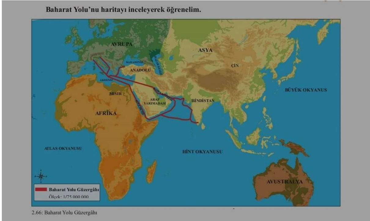
Görsel 4: Baharat Yolu güzergâhı (Yıldırım vd., 2023: 97)

Sosyal Bilgiler dersi öğretim programında bulunan coğrafya ve tarihî coğrafya unsurlarının anlatımı haritalarla zenginleştirilmelidir. Çünkü Sosyal Bilgiler derslerinde kullanılan haritalar, öğrencilerin mekânsal yön tayinini yapabilmelerine ve dünyayı algılayabilmelerine yardımcı olmaktadır (Demirkaya, 2003). Bu bilgiler ışığında, ders kitabında yer alan Baharat Yolu içeriğine ilgili harita ile başlanmasının öğretim etkinliği açısından olumlu bir durum olduğu düşünülmektedir.