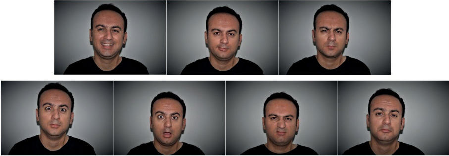
řekil 1. Evrensel Duygu İfadeleri 1