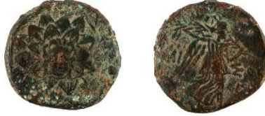
Figür 6: Amisos sikkesi (Env. No. 3041)