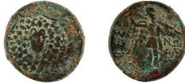
Figür 7: Komana sikkesi (Env. No. 3052)