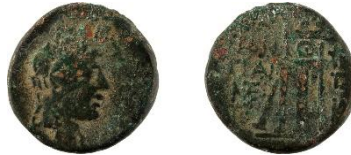
Figür 8: Pantikapaion sikkesi (Env. No. 3234)