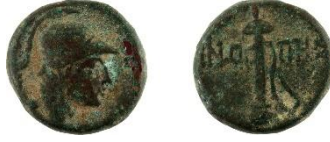
Figür 5: Sinope sikkesi (Env. No. 3066)