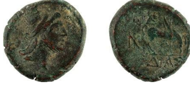
Figür 3: Dia sikkesi (Env. No. 3180)