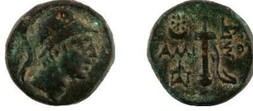
Figür 4: Amisos sikkesi (Env. No. 3083)