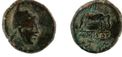
Figür 2: Amisos sikkesi (Env. No. 3124)