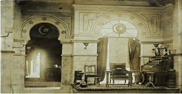
Resim 2: Liverpool İslâm Cemiyetinin içerden bir görünümü (Interior of the Moslem Institute, Liverpool) 46

1896 yılında şehirde istenmeyen veya gayr-i meşrû çocuklar için "Medina Home for Children" (çocuklar için Medine Evi) kuruldu ki el-