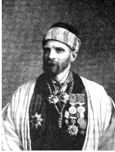
Resim 3: Şeyhülislâm Abdullah Quilliam Efendinin bir portresi 75