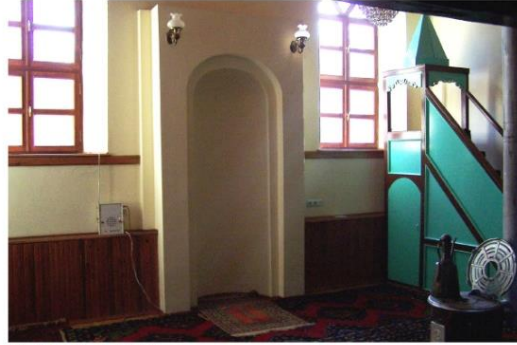
Mihrap ve Minber Görünüşü

lanmaktadır. Kible ve karşısındaki cephede ikişerden dört pencere mevcuttur. Yuvarlak kemerli pencereler iki kanatlıdır ve sonraki dönemlerde yenilenmiştir. Tavan kontrplak kaplıdır. Mihrap ve minber sanatsal karakterli olmayıp sonraki dönem ilavesidir.