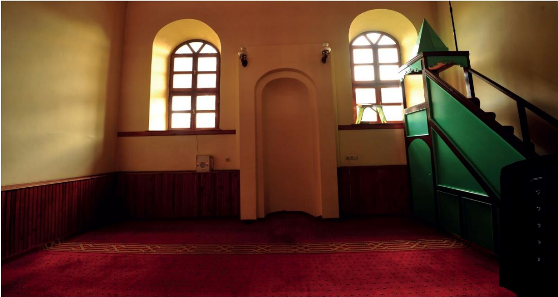
Ek 2. İhtiyârüddin Hasan Camii'nin son hâli ve iç görünümünden bir kesit (Boran, Meram , 1/392)