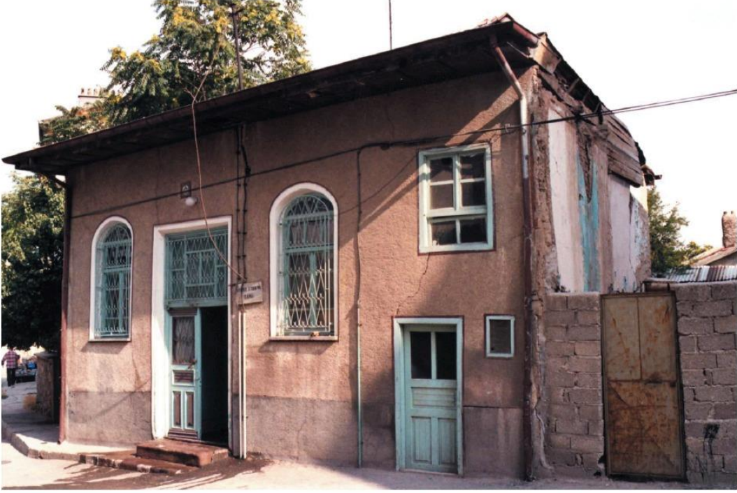
Ek 1. İhtiyârüddin Hasan Camii'nin eski hâli. (Karpuz, Konya Kültür Evnanteri , 1/179-180)