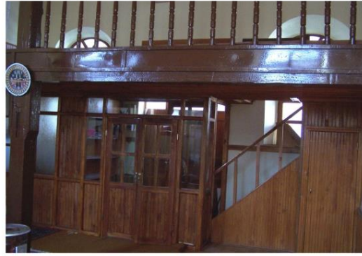
Kadınlar Mahfili Görünüşü