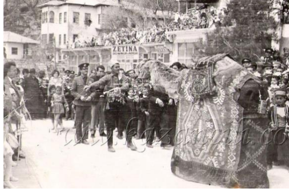
Görsel 5. 1968 Yılında Ermenek Meydanında Saya Oyunu (Ermenek Haber Gazetesi)

Günümüzde bayram günlerinde ve festivallerde görsel şölen olması için oynanmaktadır. Saya oyunu geçmişte Türkmen geleneği olarak bilinmektedir (Görsel 5). Hayvancılık ile uğraşanların geleneksel bahar eğlencesi olarak da bilinmektedir. Günün geç saatlerinde oynanan oyunda çanlar çalınarak ev ev gezilerek bahşiş veya erzak toplanmaktadır. Bu toplanan erzaklar fakir olan ailelere dağıtılır veya orada toplanan grup tarafından paylaşılır.