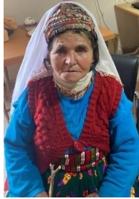
Görsel 7.İncilli Fes

Fes, Takke (Başlık): Orta Anadolu ve Karaman Bölgesi'nde kadınların giyim kuşamlarında tepelik denilen ve takkenin üst tarafta başı tamamen saran modeli kullanılmaktadır. Takkenin arkasında iki tarafı birbirine bağlayan kaskı bulunur. Bu kask ikili, üçlü bazen de dörtlü olarak saçların arasından geçirilerek kullanılır (Görsel 7). Takkelerin böyle kullanılması takkenin baştan kaymasını önlemiş olur (Sarı, 2016:72). Takke kartondan baş kısmının ölçülerine göre istenilen ölçü genişliğinde başa göre yapılmaktadır. Genel olarak tepelik kısmı biraz çukur bırakılır, ancak görüntü olarak bir daireyi andırmaktadır.