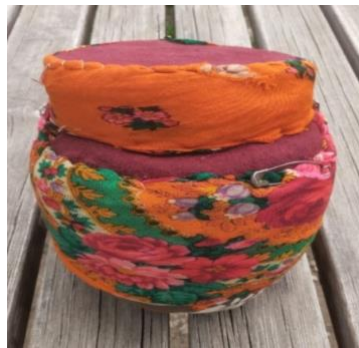
Görsel 8. Fes

Takkenin kenarlarında işlemler, çeşitli takılar ve boncuklar bulunur. Bunların yapılarak takılması inanç kültürü içinde önemlidir. Çünkü takılan süsler ve boncukların nazardan koruyacağına ve bolluk getireceğine inanılmaktadır (Aşgar, 2023). Takke yapılışında keçe, renkli tülbent ve kadife kullanılmaktadır (Görsel 8). Özellikle kırmızı, yeşil ve lacivert renkler canlı olarak kullanılır.