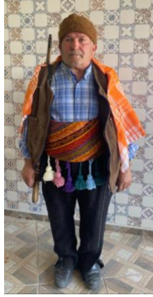
Görsel 2. Saya Oyunu Grup Başı

Heybeci: Kapılarda verilen erzakları geleneksel olarak dokunmuş yün heybesine koyan erzak taşıyıcıdır. Heybenin yanında helkesi de bulunur. Kuru erzakları (mısır, ceviz, buğday) heybeye koyar, sıvı olan (yağ, pekmez gibi) ürünleri de helkesinde taşımaktadır (Görsel 3).