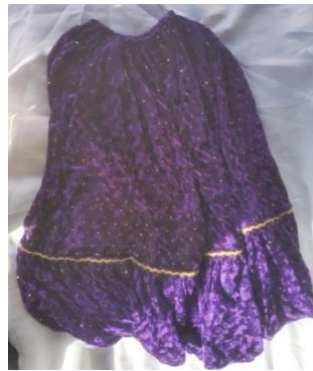
Görsel 9. Şalvar

Şalvar: İç kıyafet üzerine giyilen, ağ kısmı uçkurlu olup bel kısmı kullanım kolaylığı sağlaması için lastiklidir. Şalvar bir alt giyim eşyası olmakla birlikte dış görünüşünün güzel olması için kadife ya da parlak kumaşlardan yapılmaktadır (Görsel 9). Boyu uzun olanlar için dikildiğinde ayak bileğinin üzerinden bağlanarak paça kısmında bol görünümlü ve dökümlü bir görüntü oluşturur. Bazen astarlı örnekleri olmaktadır. Yörede çok fazla kullanılan şalvarlar, Türk geleneksel giyim ve kuşamların örnekleri arasında olan önemli parçalar arasındadır. Cep ağız kısımları ve paçalarda süsleme detayları olmaktadır. Bu detaylar dikiş teknikleri ile yapılmaktadır.