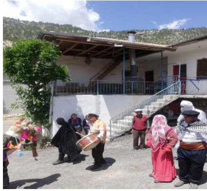
Görsel 6. Kapı Önünde Ses Çıkarma ve Erzak İsteme Süreci

Oyunun sergilenmesi esnasında alınan bahşış sonrasında deveye tükürülerek nazar değmesi engellenmiş olur. Sesler çıkarılarak ve davul çalınarak kapı önüne gelen ekip tarafından ev sahibine seslenilir (Görsel 6). Ev sahibi kapıyı açar açmaz, ayı kapının eşliğine uzanmaktadır. Nazar değmiş denilerek para istenir ev sahibi parayı verdikten sonra eşikten kaldırılır. Bu sürede çanlar çalar, gelin davul eşliğinde oynamaya başlar. Ev sahibi gelinin güzel oynama derecesine göre erzak ya da ücretini belirlemektedir.