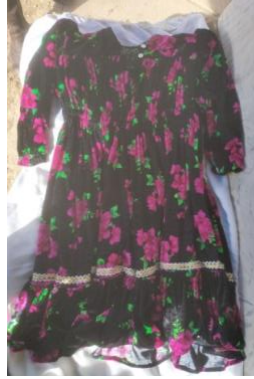
Görsel 11. Farfarlı Fistan

Gaytanlı Fistan (Entari işleme): Yöre halkının binlerce yıllık geleneksel olarak kullandığı fistan aynı zamanda birçok kişinin bu işleri yaparak geçim kaynağı olmuştur. Özel günlerde ve bayramlarda kadınların vazgeçilmez giyimi olarak karşımıza çıkmaktadır (Tufan, 2014:634). Rengarenk olması doğanın insan üzerindeki yansıması olarak orada yaşayan halk tarafından yorumlanmaktadır (Görsel 11).