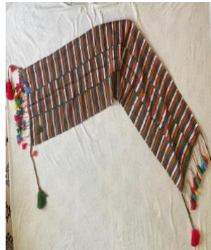
Görsel 10. Toka Süslemeli Darabulus

Kuşaklık: Giyim kuşam ifadesi giyim şeklinin tamamını kapsamaktadır. Kuşanmak ise, giyinmeyi tamamlayan ek olarak kullanılan parçalardan yani ek aksesuarlardan oluşur. Kuşak, bele bağlanarak kullanılan giyim parçasının adıdır (Görsel 10). Kuşaklar iki çeşit olarak karşımıza çıkar. Bir çeşit kuşak dar ve uzun kumaş veya şallar şeklinde olup, bele birkaç defa dolanarak sarılır ve saçakları dışarıda sarkacak şekilde bırakılır.