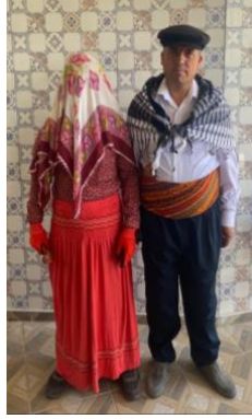
Görsel 4. Saya Oyununda Gelin Damat

Ayılar: Üzerinde hayvan postundan yapılmış ürkütücü bir örtü bulunur. Günümüzde keçe giysiler giyilmektedir. Ayı rolüne giren kişilerde sayı sınırı yoktur. Üzerinde sıralı halde bulunan çanlar vardır. Bu çanlar iyi ses çıkarması için 11-12 numaralı olmalıdır. Ses ve gürültü yaparak hem duyulmalarını sağlarlar hem de kötü ruhların oradan uzaklaşmasını amaçlar.