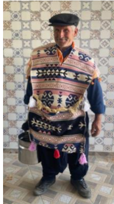
Görsel 3. Saya Oyununda Heybeci

Heybeci: Kapılarda verilen erzakları geleneksel olarak dokunmuş yün heybesine koyan erzak taşıyıcıdır. Heybenin yanında helkesi de bulunur. Kuru erzakları (mısır, ceviz, buğday) heybeye koyar, sıvı olan (yağ, pekmez gibi) ürünleri de helkesinde taşımaktadır (Görsel 3).