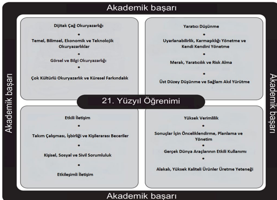
Şekil 2. enGauge 21. Yüzyıl Becerileri: Dijital Çağ için Dijital Okuryazarlıklar (Lemke, 2002) (Kaynak: Lemke, C. (2002). enGauge 21st Century Skills: Digital Literacies for a Digital Age. )

Başka bir beceri çerçevesi, öğrenciler için teknolojinin etkili kullanımı konusunda kritik faktörleri açıklayan Kuzey Merkez Bölgesel Eğitim Laboratuvarı (NCREL) tarafından geliştirilmiştir. Bu çerçeve, iş hayatına atılacak olan öğrenciler için giderek daha önemli hale gelecek olan bir dizi 21. yüzyıl becerisini ortaya koymaktadır. Bu beceriler, geleneksel eğitim becerileriyle çelişmez, ancak aslında bu becerilerin yeni teknolojilere ve yeni çalışma ortamlarına uyarlanmış uzantılarıdır. Eğitim sistemi, bu 21. yüzyıl becerilerinin ilgili ve anlamlı yollarla gelişimini teşvik etmeye zorlanacaktır (Lemke, 2002).