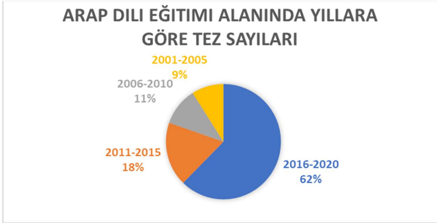
Grafik 1. Lisansüstü tezlerin 5 yıllık periyotlara göre yüzdelik dağılımları

Grafik 1 incelendiğinde, Arap Dili eğitimi alanında hazırlanan tezlerin %9'u 2001-2005 yılları arasında, %11'i 2006-2010 yılları arasında, %18'i 2011-2015 yılları arasında ve %62'si 2016-2020 yılları arasında hazırlandığı görülmektedir. En yüksek oranın son 5 yılda hazırlandığı dikkat çekmektedir. 2016-2020 yılları kapsayan dönemin Arap Dili Eğitimi alanında yazılan tezlerin sayısı bakımından en yüksek dönemi olduğu görülmektedir. Bu durumun bir sebebi olarak öğretim görevlisi/okutman alım şartlarına ek bir şart olarak yüksek lisans tamamlama maddesinin eklenmesi gösterilebilir.