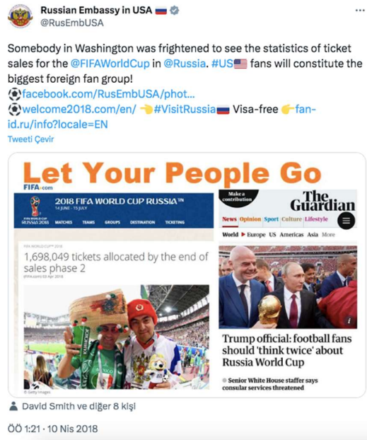
Görsel 2. Rusya'nın ABD Büyükelçiliği'nin 10 Nisan 2018 tarihli paylaşımı ( Russian Embassy in USA ru on X , 2018)

Rusya'nın ABD Büyükelçiliği hesabından paylaşılan içerikler genel olarak değerlendirildiğinde Rusya ile İngiltere arasında yaşanan krizin ABD'ye ve diğer "müttefik ülkelere" sıçramış olmasının ülkeler arasındaki ikili ilişkilerin bozulmasına sebep olduğu ve bunun sorumlusunun Rusya değil, İngiltere'ye desteklerini açıklayan Batılı ülkelerin yöneticilerinin olduğu vurgusuna sıkça rastlanmaktadır.