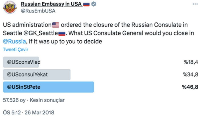
Görsel 1. Rusya'nın ABD Büyükelçiliği'nin 26 Mart 2018 tarihli paylaşımı ( Russian Embassy in USA ru on X , 2018)

Eski Rus casusu Sergei Skripal ve kızının zehirlenmesinin ardından İngiltere ile dayanışma içerisine giren Avrupa devletleri ve ABD, Rus diplomatları sınır dışı etmeye başladı. Yirmiden fazla Batılı ülke onlarca Rus diplomatın sınır dışı edilmesi emrini verdi (Borger vd., 2018). 26 Mart 2018 tarihinde Başkan Trump, 60 Rus yetkilinin ABD'den sınır dışı edilmesi ve Seattle'daki Rus konsoloslğunun kapatılması emrini verdiğini duyurdu (Wamsley, 2018). Bunu takiben 29 Mart 2018 tarihinde Rusya 60 ABD'li diplomatı sınır dışı etti ve Moskova'yı kınayan Londra ve Washington'a katılan diğer ülkelerin diplomatlarından da göndermelerin devam edeceğini duyurdu ("Russia Orders out 60 U.S. Diplomats over Spy Poisoning Affair", 2018). Bu karşılıklı restleşmeler devam ederken Rusya'nın ABD Büyükelçiliği Twittr hesabından takipçileriyle bir anket paylaştı. Bu ankette kullanıcılara ABD yönetiminin Seattle'daki Rusya Konsolosluğu'nu kapatma emri verildiği bilgisi verildikten sonra "Eğer siz karar verecek olsaydınız, Rusya'daki hangi ABD Konsolosluğunu kapatırdınız?" sorusu soruldu. Verilen şıklarda, ilgili konsoloslukların Twitter kullanıcı adları işaretlenmişti ve 57,526 kişinin katıldığı ankette St. Petersburg seçeneği en çok oyu aldı.