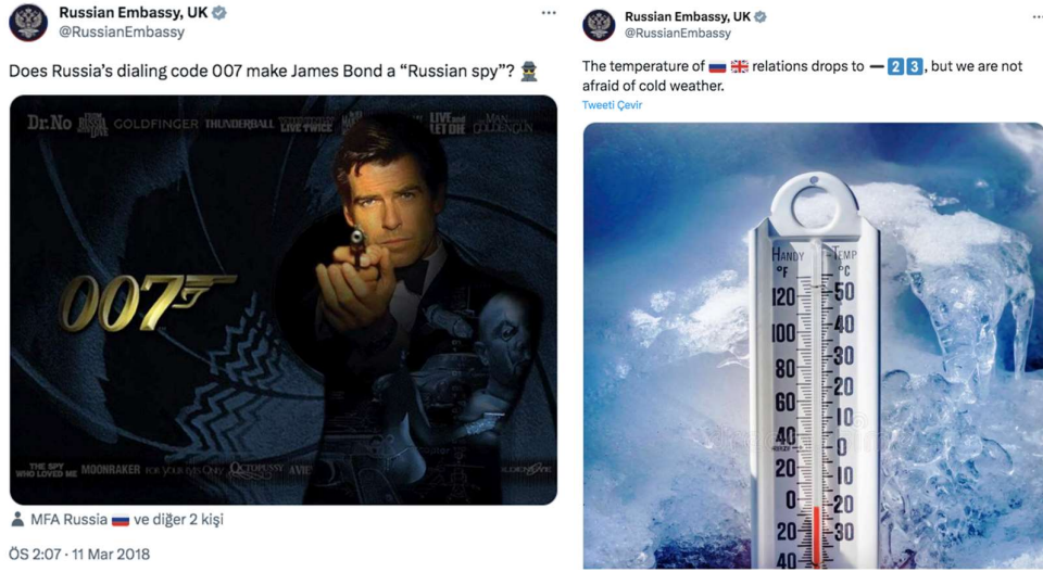
Görsel 7. ve 8. Rusya'nın İngiltere Büyükelçiliği'nin sırasıyla 11 Mart 2018 tarihli ve 14 Mart 2018 tarihli paylaşımları ( Russian Embassy, UK on X, 2018 )