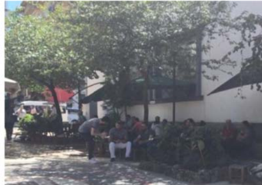
Şekil 4. Alan içinde çay ocağının mekânsal yayılımı ve kullanıcılar (Fot. Sema Mumcu)

Kadın ve erkek kullanıcıların sergiledikleri davranışlarda cinsiyet rollerinin baskısıyla farklılıklar olması, kadınların erkekler kadar özgür olamaması nedeniyle erkekler kadar çeşitli kullanım sergilemeyecekleri beklenilmiş ancak bu sonuç saptanamamıştır. Çeşitlilik olarak kadınlar ve erkeklerin birbirlerine yakın oranlar sergilediği, kadınların 16 etkinlik türü, erkeklerin ise 15 etkinlik türü gerçekleştirdiği gözlemlenmiştir. Kentin merkezinde yer alan, kent hayatının kalbinin attığı merkezi konumlardan biri olan çalışma alanının hava koşullarından bağımsız sürekli canlı, hareketli ve yoğun bir alan olması nedeniyle kadınları daha güvenli ve rahat hissetmeye teşvik ettiği, bunun da davranışsal içeriğe yansıdığı düşünülmektedir. Cinsiyet rollerinin “sergilenmeyen” etkinliklerle daha iyi yansıtıldığı düşünülmektedir; kadınların erkeklere has kabul edilen