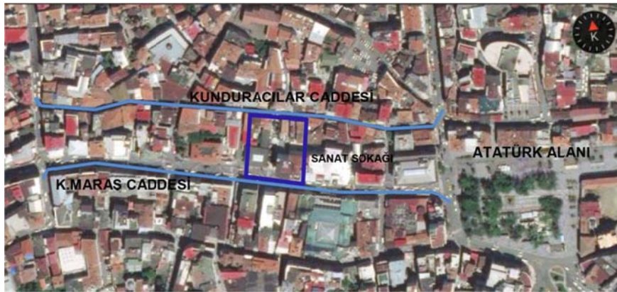
Şekil 1. Çalışma alanı olarak seçilen Sanat Sokağı'nın kent merkezindeki konumu

Araştırma “Kadın Dostu Kentler” projesinin yürütüldüğü altı kentten biri olan Trabzon’da yürütülmüştür. BMOP (2010, s. 151) raporuna göre kent nüfusunun %49,4’ü erkek, %50,6’sı kadındır. Nüfusun %52,2’si kent merkezinde yaşamaktadır. Erkeklerin okuma yazma oranı %97,5, kadınlarda %83,8’dir. Çalışan erkek oranı %74,5 iken kadın oranı ancak %48,2 düzeyindedir. Eğitim ve iş gücüne katılım oranları arasındaki fark kadın ve erkek statüleri arasındaki eşitsizliğin göstergesidir.