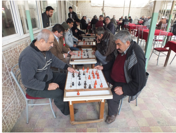
(Fot.1: Bülent Ayberk, 2014)

Dama oyuncularının kahvehane içinde yerleşmiş oldukları bölüm; oyun masası, sandalyeler ve ara birim olan sehpadan oluşan oyun biriminin yinelenmesiyle, doğrusal olarak oluşmuştur (Fot.1). Burada, diğer masa oyun türlerinin de yer aldığı plan yerleşimi içinde; dama oyun oynama kültürünün, mekân içinde yer seçiminde ve yerleşimdeki etkisi gözlenebilmektedir (Fot. 2).