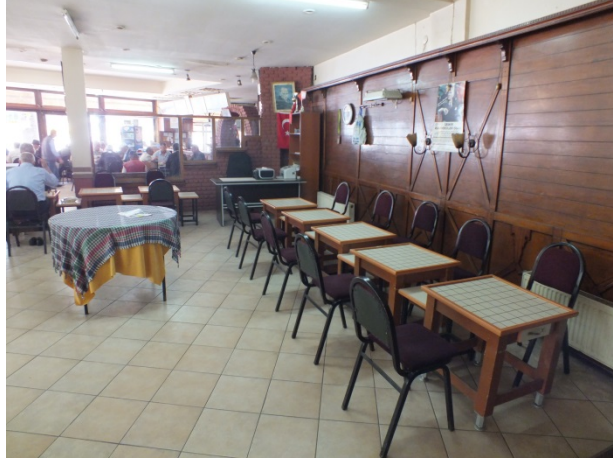
(Fot.16: Bülent Ayberk, 2012)