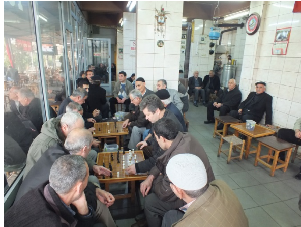
(Fot.11: Bülent Ayberk, 2014)

Doğu illerimizdeki kahvehanelerde kürsü olarak adlandırılan oturma mobilyasının yaygın kullanımı, dama masasının ölçülerini biçimlendiren başat etken olduğu gibi kullanıcı açısından da mekânla etkileşiminde belirleyici olmaktadır. Oturma mobilyası olan kürsüde sırt için yaslanma yüzeyinin olmayışı kullanıcılar açısından mekânın tüm duvarlarını ve ayırıcı yüzeyleri -pencereler gibi- yaslanma yüzeylerine dönüştürmektedir.