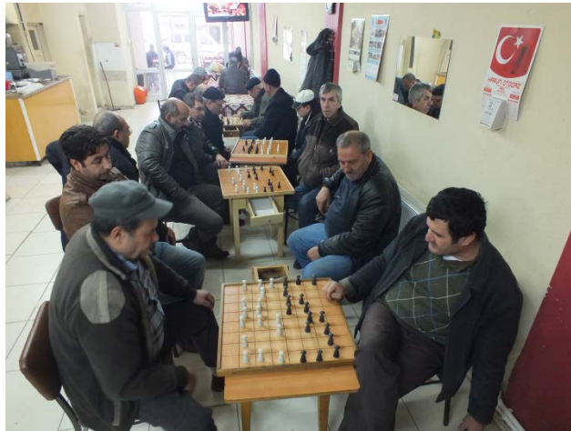
(Fot.29: Bülent Ayberk, 2013)

Manisa'ya bağlı Turgutlu'da dama oyunu oynanması için özelleşmiş bir dama kahvesi bulunmaktadır. Açık ve kapalı olmak üzere iki bölümden oluşan kahvehane, L biçiminde bir plana sahiptir. Burada dama masaları mekânın geneline doğrusal bir planlama ile konumlandırılmış olmakla beraber (Fot.29) mekân, işlevsel olarak verimsiz kullanılmaktadır.