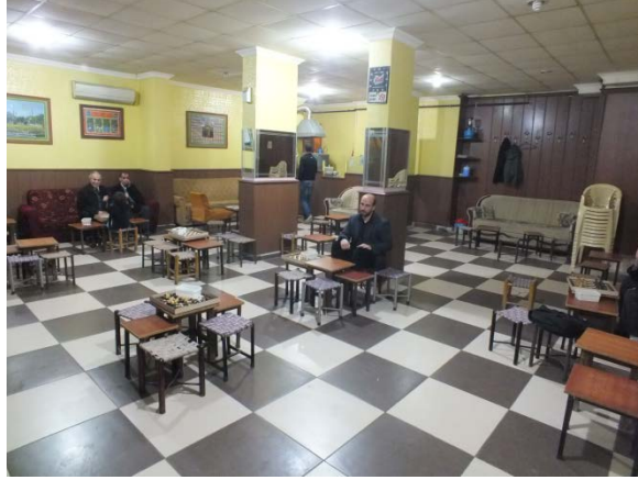
(Fot: 10: Bülent Ayberk, 2014)

anlatılırken değinildiği üzere; halk arasında “ranza” olarak adlandırılan oturma mobilyasının ve oturma biçimi kültürünün (Fot. 8) günümüzde üretilen mobilyalarla karşılanarak oluşturulmuş bir yorumudur.