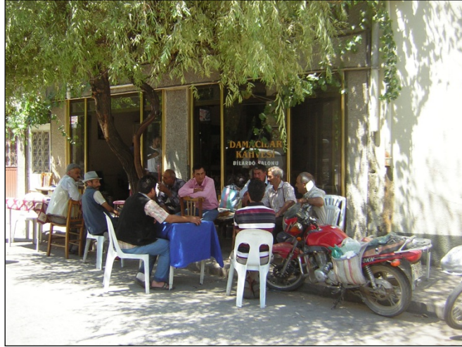
(Fot.27: Bülent Ayberk, 2014)

Tire'deki diğer kahvehanelerde de dama masaları bulunmakta; oyun oynamak isteyenler bu masalardan yararlanabilmektedir.