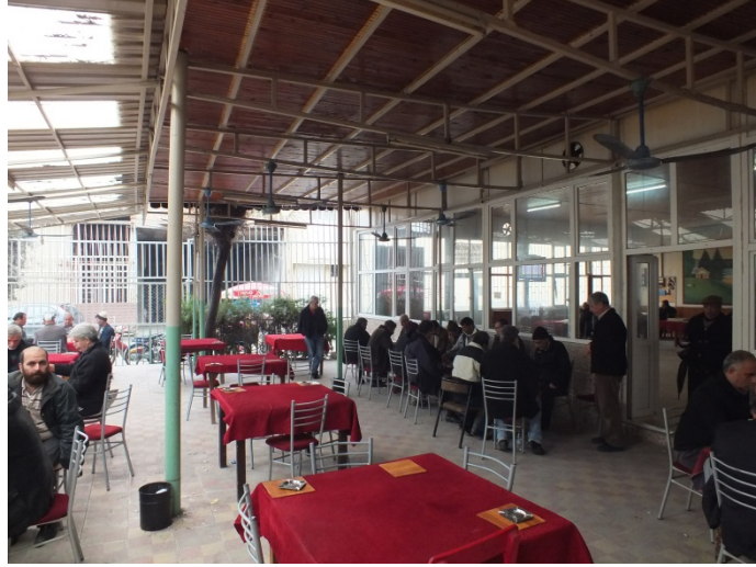
(Fot.2: Bülent Ayberk, 2014)