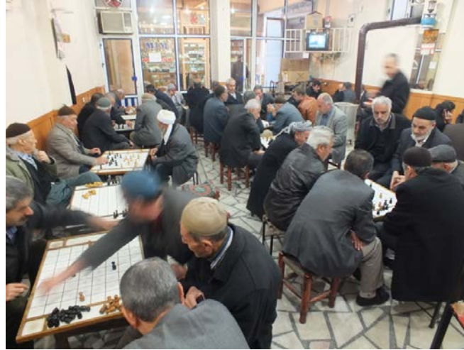
(Fot. 3: Bülent Ayberk, 2014)

Yalnızca dama oynanan kahvehane kalabalık bir oyuncu kitlesine sahiptir. Doğrusal bir yerleşimin egemen olduğu bu planlama, oyun kültürünün etkisi ile ihlal edilebilmektedir. Rakip oyuncuları izlemek amacıyla toplanan izleyicilerin yoğun müdahalesi ve oyuna katılım alışkanlıkları dama masası merkezli toplanmalara neden olmaktadır (Fot.3). Bu durum, doğrusal dizilimin dağılmasına neden olabilmektedir.