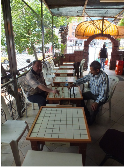
(Fot.15: Bülent Ayberk, 2012)

Konak ilçesi sınırları içerisindeki Eşref Paşa semtinde bulunan damacılar kahvesi özelleşmiş bağımsız bir mekân olarak değil; kiraathanenin bir parçası olarak kullanılmaktadır. İzmir’li usta dama oyuncularının uğrak yeri olan bu mekân, İzmir’li dama topluluğunun merkezi olarak kullanılmaktadır. Teras bölümü tüm mevsimlerde etkin olarak kullanılmaktadır (Fot.15).