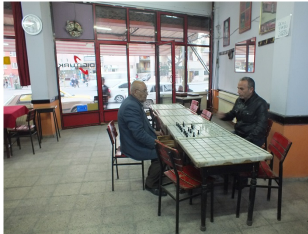
(Fot.9: Bülent Ayberk, 2013)

Ancak benzerini diğer dama oynanan kahvehanelerde görme olanağı bulunmayan ve iyi bir mermer işçiliğinin eseri olan bu masaların, iç mekânda kullanılıyor olması, Kırmızı Kahvehane'yi önemli bir konuma getirmektedir (Fot.9).