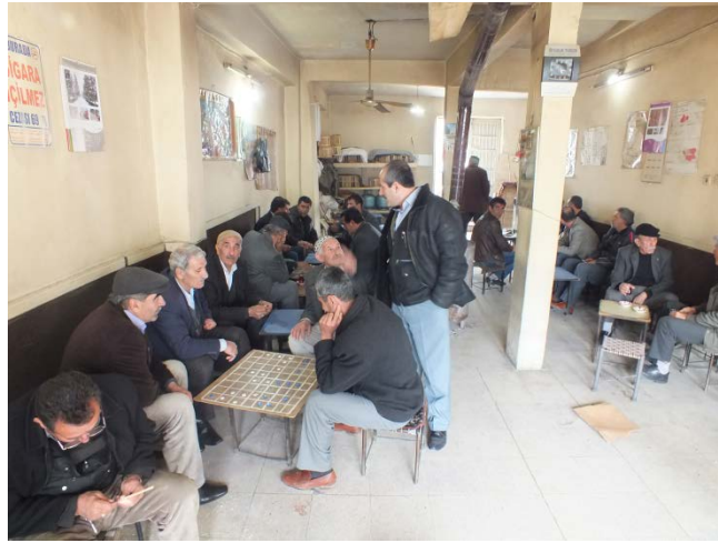
(Fot.4: Bülent Ayberk, 2014)

Aşağıdaki görsellerde yer verilen Keklikçiler Kahvesi (Fot.4), Petrol Çayevi (Fot.5), Dostlar Çayevi'nde (Fot.6) gözlenebileceği üzere doğrusal ve noktasal yerleşim biçimi kullanılabilir. Ayrıca oturma kültürünün biçimlendirdiği oturma mobilyası ve buna bağlı olarak oyun masası ile arasındaki biçimsel ve oransal ilişki bir dama oyun birimi tipolojisi ortaya çıkarmaktadır.