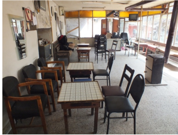
(Fot.13: Bülent Ayberk, 2012)

Kahvehanenin uygun mevsimlerde kullanılan dikdörtgen plana sahip bir açık alanı ve aşağıda görsellerine yer verilen kapalı mekânı bulunmaktadır. Doğrusal olarak bir araya gelen dama masaları, mekânın kullanımını etkileyen en önemli etmendir (Fot.13).