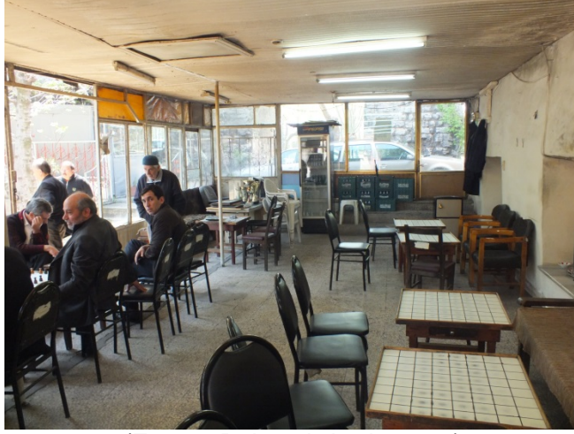
(Fot.14: Bülent Ayberk, 2012)