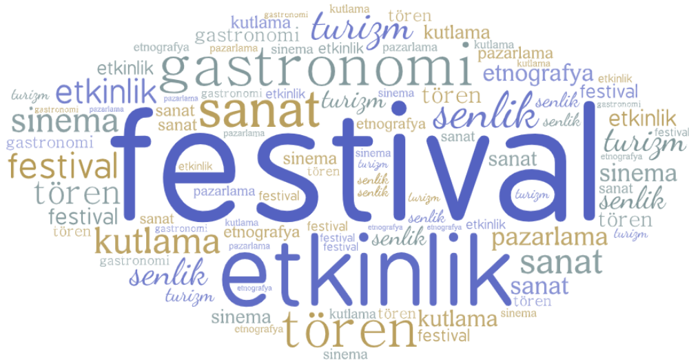
Şekil 2. Lisansüstü Tezlerde Kullanılan Anahtar Kelimeler

Lisansüstü tezlerde kullanılan araştırma yöntemlerinin yer aldığı Tablo 6’ya göre; tezlerde hem nitel hem nicel hem de karma araştırma yöntemlerinin kullanıldığı anlaşılmaktadır. Üretilen 166 tezdən 49’u nitel, 55’i nicel, 62’si de karma yöntemi kullanmıştır. Bu bulguya dayanarak festival konusunun nitel, nicel ve karma yöntemle