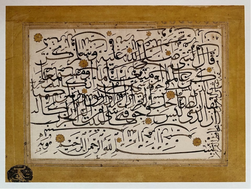
Şekil 1. Hafız Osman (1090/1679) 20x27cm, Aharlı kâğıt, is mürekkebi, sülüs-nesih Süleymaniye Kütüphanesi- Hamidiye, Murakkaat 33, (Dere, 2009; ss.169).

olumsuzluklarına dikkat çekmiş ve eski üstatlardan örnekler vermişlerdir. Hattatlar eser yazmıyorlarsa herhangi bir sebepten yazamadıkları zaman karalama yapmışlar seyahate çıksalar dahi yazıya ara vermemişlerdir. Osmanlı hat ekolünde önemli bir yere sahip olan hafız Osman'ın seyahati sırasında konakladığı yerde yazdığı karalamanın altına yer adını da belirtmesinden anlaşılabilir.