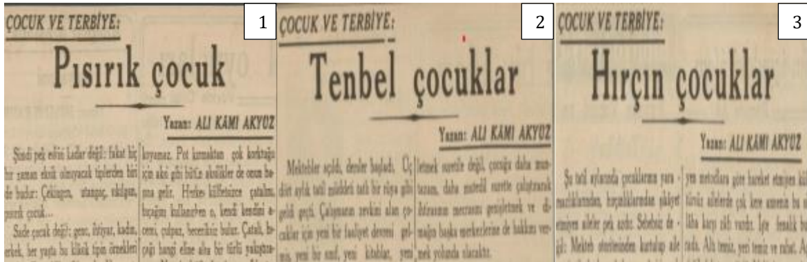
Şekil 1. Çocukların Özellikleri Bakımından Çocuk ve Terbiye Yazıları