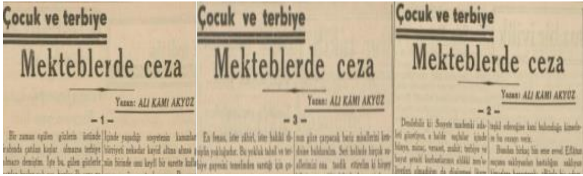
Şekil 2. Ceza konusunda Çocuk ve Terbiye Yazıları-I