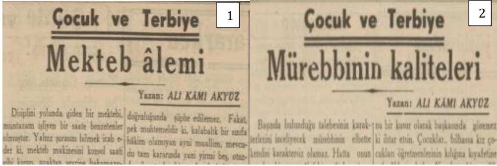
Şekil 5. Öğretmen Temalı Yazılar