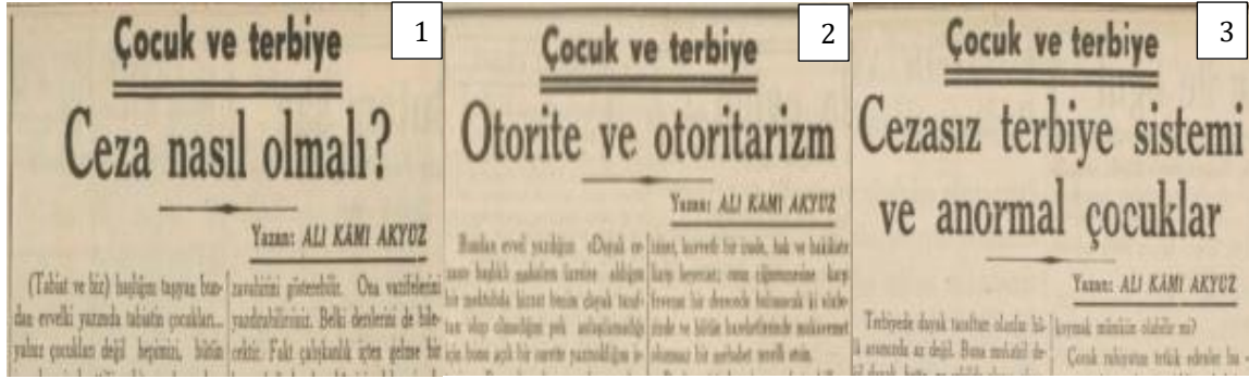
Şekil 3. Ceza konusunda Çocuk ve Terbiye Yazıları-II