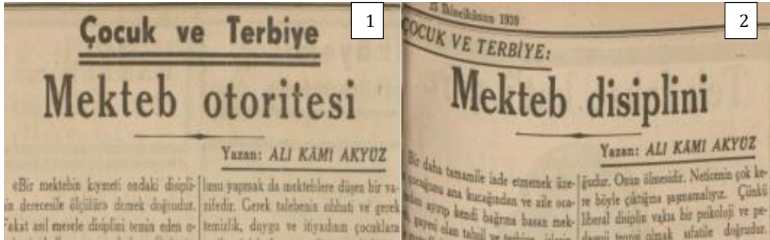
Şekil 4. Okul temalı yazılar