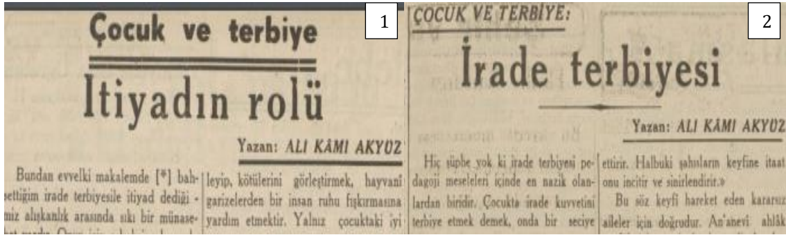
Şekil 6. İrade ve İtiyad Temalı Yazılar