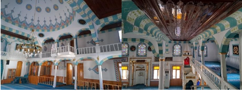
Görsel 4 (solda): Çıkrık Camii, kuzey cephe mahfil

arasına kemerler atılmıştır. Mihrap ekseninde mahfilin orta bölümü güneye doğru çıkıntı yapmaktadır. Mahfili beyaz renkli yağlı boyalı ahşap korkuluklar çevrelemektedir (Görsel 5).