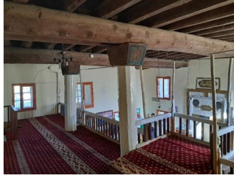
Görsel 15: İbek Köyü Camii, mahfil katı