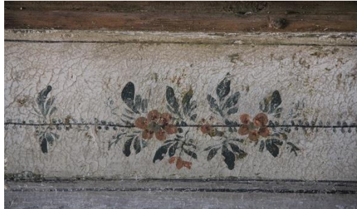
Görsel 10: Çorum Ulu Camii, kalem işi süslemeler detay (URL 4)