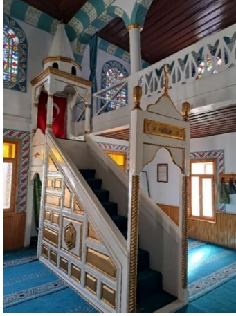
Görsel 8: Çıkrık Camii, minber