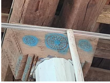
Görsel 16 (solda): İbek Camii, ahşap sütun başlıkları