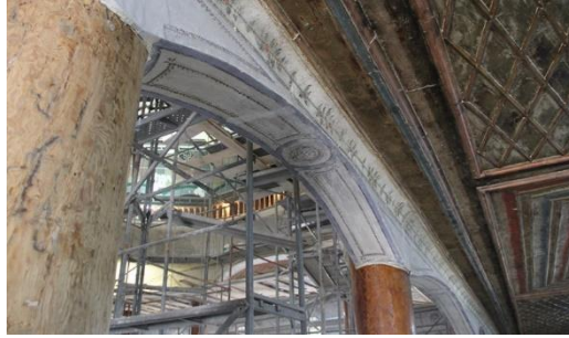
Görsel 9: Çorum Ulu Camii, pandantiflerde kalem işi süslemeler (URL 3)