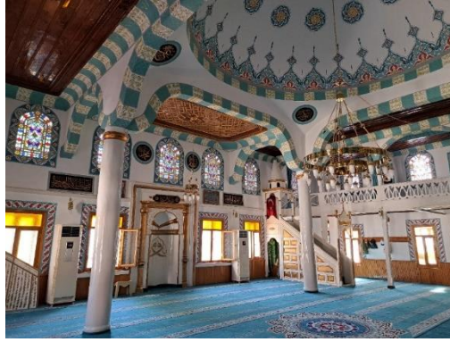
Görsel 3: Çıkrık Camii, harim

Dış mekânın sadeliğine karşın harim dinamik bir etkiye sahiptir. Harime girildiğinde ilk dikkat çeken iç mekânın aydınlığıdır. Harim, güney, doğu ve batı cephelerde 20 pencereden ışık almaktadır. Pencerelemeler iki sıralıdır. Caminin batı cephesinde üst sırada iki, alt sırada iki pencere vardır. Üst sıra pencereler yuvarlak kemerli, alt sıra pencereler düşey dikdörtgen biçimindedir. Simetrik konumlanan alt sıra pencerelerin kuzey yönünde harime girişi sağlayan bir kapı bulunmaktadır. Kadınlar mahfiline çıkışı sağlamak için sonradan açılan bu kapının yerinde önceleri bir pencere olduğu anlaşılmaktadır. Doğu cephede üst sırada yuvarlak kemerli üç, alt sırada düşey dikdörtgen üç pencere vardır. Yapının en hareketli cephesi güney duvarıdır. Güney cephede üst sırada yuvarlak kemerli altı pencere, alt sırada düşey dikdörtgen dört pencere yer almaktadır (Görsel 3).