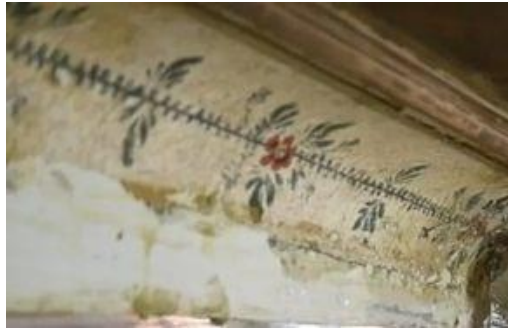
Görsel 11: Kulaksız Camii, kalem işi süslemeler (URL 6)

Çorum'da restorasyon çalışmaları devam eden bir diğer cami Kulaksız Camii'dir. 2020 yılının Eylül ayında ihalesi yapılmış ve Tokat Vakıflar Bölge Müdürlüğü koordinesinde restorasyon çalışmalarına başlanmıştır (URL-5). Ulu Camii'nin küçük bir benzeri olan caminin inşa kitabesi bulunmamaktadır. Ancak caminin 1814-1815 yıllarında yapıldığı kabul edilmektedir. Camide kare planlı harim bağdadi kubbe ile örtülmüştür. Ortasındaki göbek dışında süsleme bulunmayan kubbede vitraylı dört pencere bulunmaktadır. Kubbe dışındaki ahşap tavanlar çitakâri motiflerle süslenmiştir (Dündar, 2004: 50-56). Restorasyon çalışmaları esnasında raspanarak alçı ve çimentonun temizlenmesi ile Kulaksız Camii'nde özgün kalem süslemeler ortaya çıkarılmıştır (Görsel 11), (URL-6).