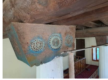
Görsel 17 (sağda): İbek Camii, ahşap sütun başlıkları