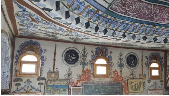
Görsel 14: Mecitözü Doğla Köyü Camii, harim