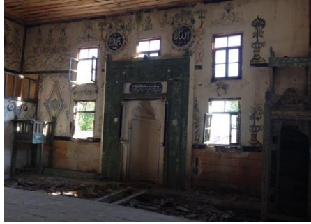
Görsel 13: Mecitözü Alören Köyü Camii, harim, restorasyon öncesi, (URL 8)

18. yüzyıl sonu ve 19. yüzyıl başlarında Çorum ve Mecitözü'nde camileri süsleyen kalem işi nakışların zamanla köylerde de yaygınlaşmaya başladığı görülmektedir. Mecitözü'nün Alören köyünde bulunan cami buna güzel bir örnektir. Alören Camii'nin inşa kitabesi bulunmamaktadır. Çerkez (2019: 496-502), harim mekânı içerisindeki minare kapısında yer alan 1899 tarihinin, caminin mimari ve süsleme özellikleri de göz önüne alındığında yapım yılına ait olduğunu belirtmektedir. Harimin kuzeybatı köşesinde dikdörtgen panodaki kitabede okunan 1942 yılının ise kalem işi süslemelerin yapıldığı yıla işaret ettiğini kabul etmektedir. Caminin yoğun duvar resimlerinde stilize bitkisel motifler, stilize ağaçlar, yazı, mimari tasvirler ve nesneli bezeme görülmektedir (Görsel 13). Günümüzde metruk vaziyette olan camide 2023 yılında Tokat Vakıflar Bölge Müdürlüğü koordinesinde restorasyon çalışmalarına başlanmıştır. Camide kalem işi nakışlar aslına uygun olarak yenilenmektedir. Restorasyon çalışmaları tamamlandığında cami ibadete açılacaktır (URL-7).