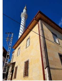
Görsel 1(solda): Çıkrık Camii, kuzey cephe genel görünüş