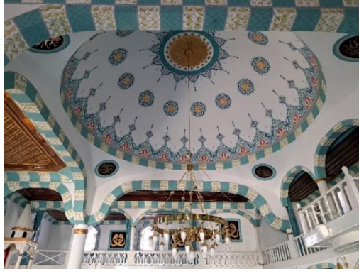
Görsel 6: Çıkrık Camii, Bağdadi kubbe tezyinat

Harimde kalem işi süsleme pencerelerde de yoğun olarak görülmektedir. Stilize iki yaprak arasında şaşırtmalı olarak tasvir edilen stilize çiçek motiflerinden oluşan kompozisyon üst sıra pencerelerin etrafını bordür gibi çevrelemektedir. Alt sıra pencerelerde düşey dikdörtgen pencere etrafında stilize yaprak motifleri yinelenmektedir. Kullanılan renkler, Bağdadi kubbede olduğu gibi turkuaz, mavinin tonları, kırmızı, sarı ve beyazdır (Görsel 3).