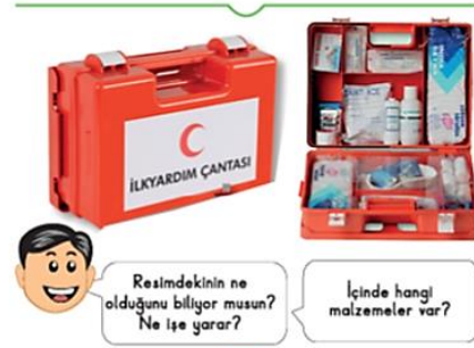
Şekil 2. İlk yardım çantası

Tablo 1’e göre Hayat Bilgisi 1-İkinci Kitapta rüzgâr-fırtına, heyelan ve deprem ile ilgili bilgilere yer verilmiştir. Kitapta ilk olarak rüzgârın nelere yola açabileceği kısaca açıklanmış ve fırtınanın ne olduğu anlatılmıştır (s. 36). Toprak kayması (veya heyelan) ile ilgili olarak açık bir bilgi verilmemiştir. Ağaçların faydalarından bahsedilirken sadece “Güçlü köklerim ile toprağa sınımsız tutunurum. Böylelikle toprak başka yerlere gitmez.” şeklinde bir ifadeye yer verilmiştir (s. 40). Bunun dışında heyelanla alakalı doğrudan ve ayrıntılı bir bilgiye yer verilmemiştir. Kitapta deprem konusunda oldukça ayrıntılı bilgilere yer verilmiştir. Bunlar arasında