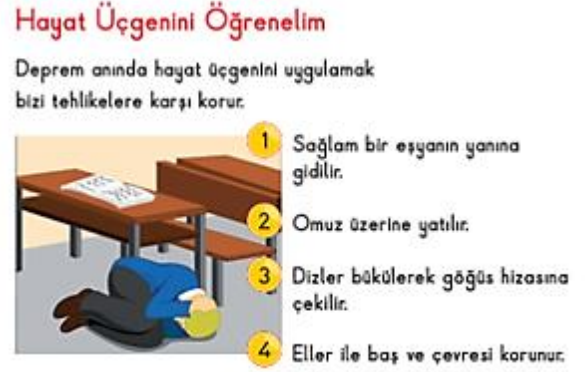
Şekil 4. Hayat üçgeni