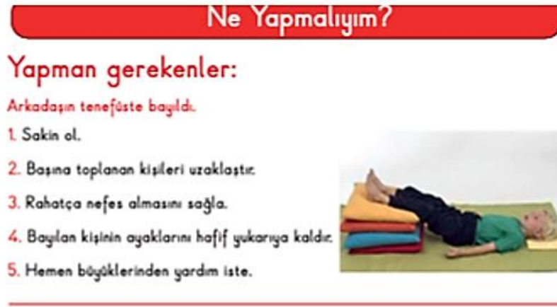
Şekil 5. Bazı acil durumlarda yapılması gerekenler