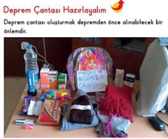
Şekil 3. Deprem çantası

depremin oluşumu (s. 67), yaşanan evin sağlamlığı (s. 69), deprem çantasının (Şekil 3) hazırlanması (s. 70), hayat üçgeninin (Şekil 4) öğrenilmesi (s. 71) ve deprem anını sınıfta canlandırma etkinliği (s. 72) yer almaktadır.