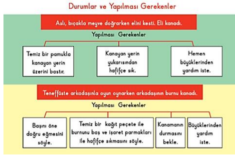
Şekil 6. Acil durumlar ve yapılması gerekenler

158-159, 161). Özellikle temel kurallar kısmı ayrıntılandırılmıştır. Acil durum örnekleri sayfasındaysa deprem, yangın ve sel baskınının görselleri verilerek bunların adlarının yazılması istenmiştir (s. 165). Acil yardım numaraları kısmında ambulans, itfaiye ve polisin numaraları sorulmuş (s. 166); kurum olarak da itfaiye, polis, sivil savunma, sağlık kurumu gibi kurumlara yer verilmiştir (s. 167). Sonraki sayfalarda ise bu gibi kurumların olmaması durumunda neler olabileceği üzerine sorular sorulmuştur (s. 169). Birinci ve ikinci sınıf Hayat Bilgisi ders kitaplarında olduğu gibi bu kitapta da “acil durum kartı” yer almaktadır (s. 175). Kitapta ilk yardım ile ilgili örnek durumlar (Şekil 6) ve ne yapılabileceğine ilişkin bilgilere yer verilmiştir (s. 175-177, 181).