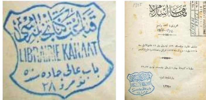
Görsel 2. (Kitap: Menakıb-ı İslam kısmı Evvel, Ahmed Rasim [İkrar Gazetesi muharrirlerinden], 1909. ) (Mühür: Kanaat Kütüphanesi, Bab-ı Âli caddesi Numara 28)

Görsel 1’de yer alan mühür, oval forma sahip erken Osmanlı mühürlerini çağrıştırmaktadır ve içeriği bilinmeyen bir kitap kapağında yer alan bir kütüphane mührüdür.