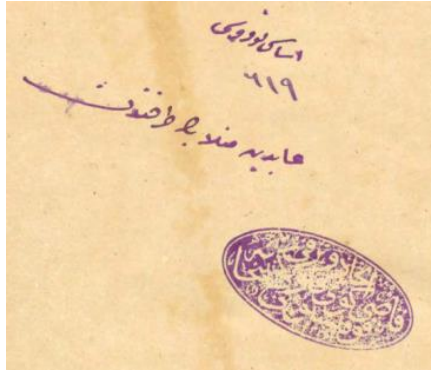
Görsel 1. Kütüphane mührü

Görsel 1’de yer alan mühür, oval forma sahip erken Osmanlı mühürlerini çağrıştırmaktadır ve içeriği bilinmeyen bir kitap kapağında yer alan bir kütüphane mührüdür.