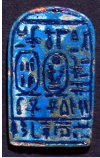
Görsel 5. III. Amenofis'e Ait M.Ö.1400 Mısır'da Bulunan Levha

için kullanılan ağaç sandıklara takıldığı tahmin edilmektedir (Pektaş, 2003:15). Bazı araştırmacılar da exlibrisin, M.Ö. 600 yıllarında yaşamış, kültür ve sanata büyük önem veren Asur Kralı Asurbanipal zamanından kaldığını öne sürmektedir (Rona, 2003:92).