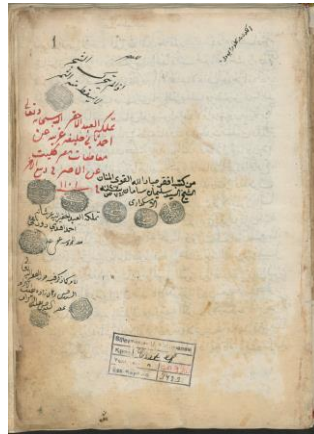
Görsel 12. Çoklu okuma notları ve mühürlere örnek

Avrupada doğan exlibrisin kitaplarda aidiyet belgesi olarak kullanılması daha özel bir işleve sahiptir. Şahıs mühürlerinin, kitaplarda yer alması exlibrislere göre okuma kültürü açısından biraz daha ayrılmaktadır. Şöyle ki; Osmanlılar ellerindeki bir kitabı çoğu zaman tek başlarına okumuyorlardı. Osmanlı döneminde genellikle okuma anlayışı bireysel olmamıştır, toplulukta okunur ve kişiye ait olmadan birçok farklı insanların da eline geçip faydalanılmasına fırsat tanınmıştır. Öyle ki bir okuyucudan diğerine kim olduğunu bile bilmeden bırakılan notlar vardır (İpek, 2022). Mühürler, yıllarca kitap sahibini betimlemede, mülkiyeti göstermede ve özellikle yazma kitaplarda tıpkı exlibrisler gibi hırsızlığa karşı bir önlem olarak kullanılmıştır (Pektaş, 2010:1). Osmanlı döneminde kitap herkes tarafından paylaşılabilen hatta içerisine diğer okuyucular için notlar bırakılıp kişisel mühürlerinin de basıldığı bir kaynaktır. Exlibrisler ise bireyin aidiyet sembolü olarak kullanılması bakımından, kitabı bireysel özel mülkiyetin bir parçası olarak tanımlama amacına yöneliktirler.