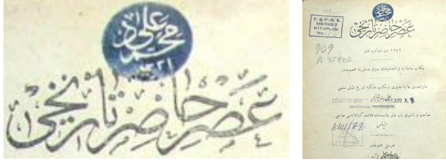
Görsel 3. (Kitap: Asr-ı Hazır Tarihi , Ali Reşad [Sabık Maarif müsteşarı ve darülfünun müderrislerinden]) (Mühür: Mehmet Ali, 1914-15)

Görsel 3’de Ali Reşad’ın Asr-ı Hazır Tarihi adlı eserinin iç kapağında görülen yuvarlak forma sahip ve yine erken dönem Osmanlı mühürlerini çağrıştıran 1915 yılına ait bir mührdür. Sülüs ve rık’a yazı tipi kullanılmıştır.