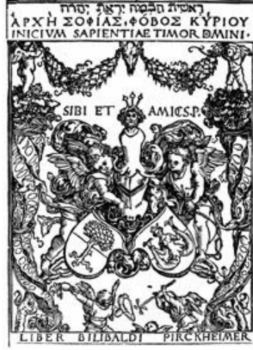
Görsel 7. A. Dürer'in Willibald Pirckheimer'e yaptığı exlibris

19. yüzyılla birlikte, bütün gelişmiş Avrupa ülkelerinde, ekonomik gücün değişmesi ve beraberinde getirdiği yaşam düzeninin modernleşmesi ile kitap yayıncılığında da büyük bir gelişim yaşanmıştır. Gelişen ekonomi toplum yapısını değiştirmekte, değişen toplum yapısına paralel kitap da gelişmektedir. Teknolojik ilerlemeler, 1875 yılında kâğıt üretimini tamamen ağaç hamurundan yapılmasına olanak vermiş, kâğıt maliyetleri düşmüş ve yayıncılık hızlanmıştır. Kâğıt, kesik kâğıtlar şeklinde değil, tomarlar biçiminde üretildiğinden dergi, gazete ve sıradan incelenmiştir. Kitaplar için kullanımı çok uygun hâle gelmiştir, bu durum bilginin hızlı yayılmasında ve daha yoğun bir şekilde halka ulaşmasında etkili olmuştur (Doğan, 2009).