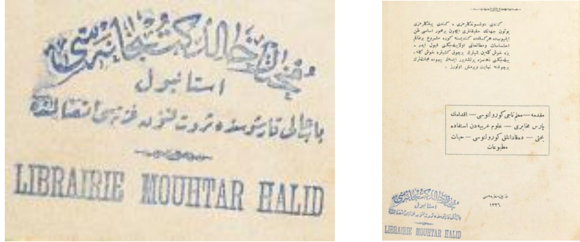
Görsel 4. (Kitap: Kavgalarım , Hüseyin Cahit, 1910-11) (Mühür: Muhtar Halid Kütüphanesi, İstanbul Bab-ı Âli karşısında Servet-i Fünun gazetesi ittisalinde)

Görsel 3’de Ali Reşad’ın Asr-ı Hazır Tarihi adlı eserinin iç kapağında görülen yuvarlak forma sahip ve yine erken dönem Osmanlı mühürlerini çağrıştıran 1915 yılına ait bir mührdür. Sülüs ve rık’a yazı tipi kullanılmıştır.