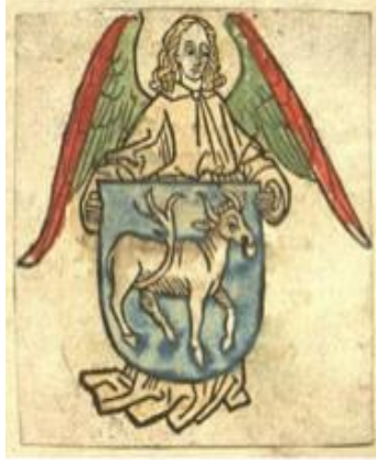
Görsel 6. 1470-1480 yıllarında Brandenburg ailesi için yapılmış olan exlibris