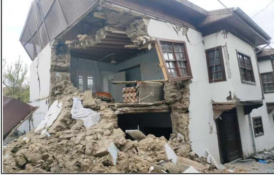
Fotoğraf 7. Depremın Yıkıdığı Geleneksel Yeşilyurt Evi, (Çırmıhtı)

Ülkemizde 6 Şubat 2023 tarihinde meydana gelen Kahramanmaraş merkezli depremde Yeşilyurt ilçesinde bulunan ve kültürel miras değeri taşıyan pek çok geleneksel Yeşilyurt Evi de yıkılmış veya büyük hasar almıştır. Özellikle Gündüzbey, Çırmıhtı, Konak, Yakınca ve Battalgazi ilçesindeki Çınar mahallelerinde bulunan çok sayıda kültürel değere sahip olan ev hasar almıştır. Fotoğraf 7’de Yeşilyurt ilçesine bağlı Çırmıhtı Mahallesi’nde depremden hasar alan geleneksel Yeşilyurt evinin bir görüntüsü verilmiştir.