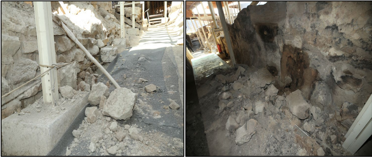
Fotoğraf 5. Arslantepe Höyüğü Ören Yeri Müzesi'nde Oluşan Hasarlar

Dünya Mirası Listesi'nde de bulunan Arslantepe Höyüğü Ören Yeri Müzesi de depremden hasar gören bir mekândır. Arslantepe, Battalgazi ilçesinde yer almakta olup, Malatya ilinde yerleşimin ilk başladığı yer olarak bilinmektedir. Hititliler döneminde yerleşime açılan bu bölge Malatya ilinin yerleşim tarihi açısından oldukça önemli bir noktadır. Gerçekleştirilen arkeolojik çalışmalar esnasında ören yeri içerisinde Hitit Aslan Heykelleri ve Hitit Sarayı keşfedilmiştir (T.C. Malatya Valiliği, 2023). Deprem esnasında müzenin iç taraflarının kerpiç duvarlarında kayma ve yıkılmalar meydana gelmiştir. Ayrıca ören yerinin korunması için inşa edilen çatı örtüsünde de yer yer çökmelerin meydana geldiği tespit edilmiştir. Arslantepe Höyüğü Ören Yeri Açık Hava Müzesi'nde meydana gelen çökme ve yıkılmalar aşağıda yer alan Fotoğraf 5'te ayrıntılı olarak fotoğraflanmıştır.