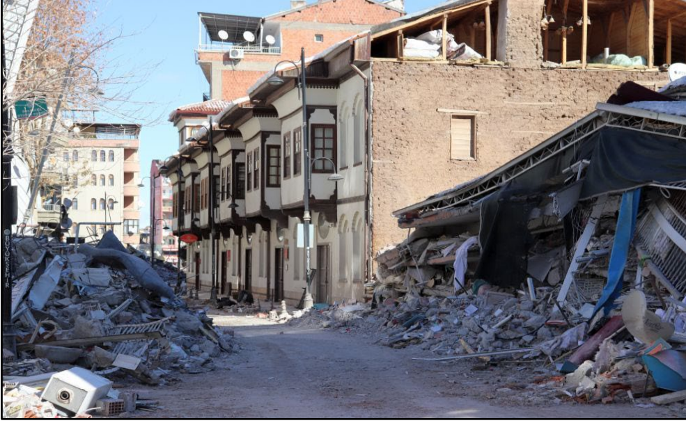
Fotoğraf 8. Depremin Beşkonaklar Etnografya Müzesi ve Sokağına Etkisi

Malatya ilinin Battalgazi ilçesinde bulunan ve içerisinde 250’den fazla dükkânın bulunduğu Malatya Şire Pazarı ve Bakırcılar Çarşısı da depremde tamamen yıkılmıştır. Bu pazar yeri bölgesinde deprem nedeniyle yıkılan dükkânların yanında tonlarca kayısı da enkaz altında kalarak, pazarda hem maddi hem de manevi ciddi bir hasar oluşmuştur. Yaşanan deprem sonucunda Malatya esnafının büyük bir çoğunluğunun ekmek kapısı olan bu pazar yeri günümüzde boş bir meydana dönmüştür. Bu depremde hasar gören diğer tarihi ve kültürel öneme sahip yapılar Atatürk Evi, Tarihi Hükümet Konağı ve Akçadağ Ören Cemevi’dir. Akçadağ Ören Cemevi depremde büyük bir tahribat görmüş durumdadır. Cemevinin çatısı çelikten inşa edildiği için depremde yıkılmamış ancak geriye kalan bölümleri tamamen yıkılmıştır.