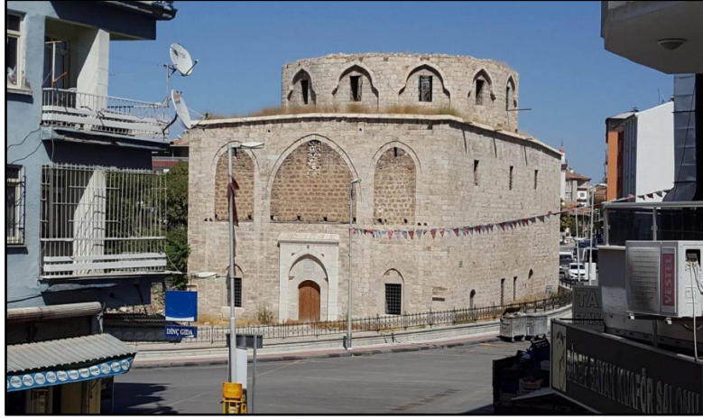
Fotoğraf 4. Depremde Hasar Alan Yeşilyurt İlçesindeki Taşhoron Kilisesi

Dünya Mirası Listesi'nde de bulunan Arslantepe Höyüğü Ören Yeri Müzesi de depremden hasar gören bir mekândır. Arslantepe, Battalgazi ilçesinde yer almakta olup, Malatya ilinde yerleşimin ilk başladığı yer olarak bilinmektedir. Hititliler döneminde yerleşime açılan bu bölge Malatya ilinin yerleşim tarihi açısından oldukça önemli bir noktadır. Gerçekleştirilen arkeolojik çalışmalar esnasında ören yeri içerisinde Hitit Aslan Heykelleri ve Hitit Sarayı keşfedilmiştir (T.C. Malatya Valiliği, 2023). Deprem esnasında müzenin iç taraflarının kerpiç duvarlarında kayma ve yıkılmalar meydana gelmiştir. Ayrıca ören yerinin korunması için inşa edilen çatı örtüsünde de yer yer çökmelerin meydana geldiği tespit edilmiştir. Arslantepe Höyüğü Ören Yeri Açık Hava Müzesi'nde meydana gelen çökme ve yıkılmalar aşağıda yer alan Fotoğraf 5'te ayrıntılı olarak fotoğraflanmıştır.