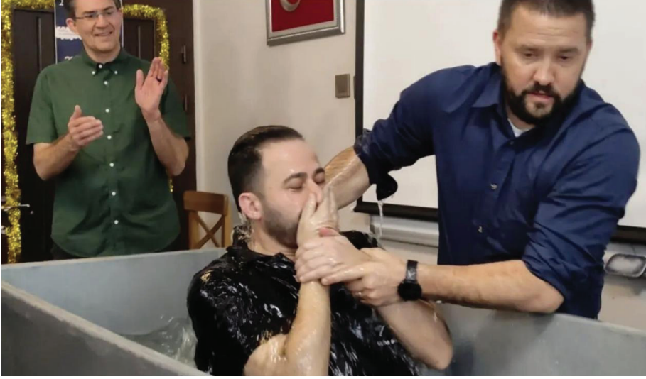
Resim 2. Kilisede İcra Edilen Bir Vaftiz Töreni, 2022.