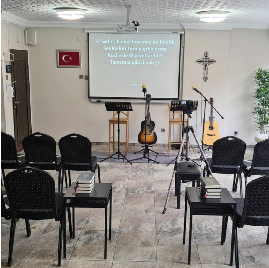
Resim 1. Başkent Protestan Kilisesi İç Görünümü, 2023.

Cemaat genel olarak genç ve orta yaşta kişilerden oluşmaktadır. Kiliseye devam ettiğimiz sürece kilisenin ortalama 20-25 kişiden oluşan devamlı bir cemaatinin olduğu görülmüştür. Bazı üyeler ise daha seyrek gelmektedir. Ankara'daki diğer kilise cemaatlerinin de ibadet için zaman zaman burayı tercih ettiği görülmüştür. Mensupları dışında her hafta 2-3 kişi de merak sebebiyle gelmektedir. Cemaatin genç ve erkek ağırlıklı olma nedenini kilisenin pastörüne sorduğumuzda kendisi genel olarak kadınların ve yaşlı ilerlemiş kişilerin din değiştirme konusunda isteksiz olduklarını ve kendi inançlarına daha bağlı olduklarını ifade etti. Ayrıca o, henüz yeni sayılabilecek bir kilise oldukları için mensuplarının diğer kiliselere göre gençlerden oluştuğunu belirtti.