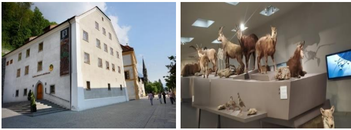
Görsel 10-11. Landes Müzesi

Ulusal Müze, Lihtenştayn Prensiği'ne bağlı bir devlet müzesidir. Müze hem ülkenin ulusal tarihini hem de bölgenin doğa tarihine ilişkin önemli bilgileri ziyaretçilerle paylaşmaktadır. Müzenin kuruluşu, 19. yüzyılın sonlarında Prens Johann II tarafından başlatılmış ve eyalet valisi Friedrich Stellwag von Carion tarafından yürütülmüştür. Amaç, hem Lihtenştayn tarihi için önemli olan kültürel varlıkları hem de ülkedeki arkeolojik buluntuları korumak ve kısmen de ulusal bir kimlik oluşturmaktır.