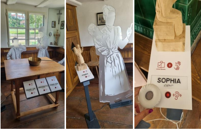
Görsel 13, 14-15. Bauernhaus Müzesi Engelsiz Müze Konseptine uygun sergi tasarımı

Sergi alanındaki tüm metinler sesli betimleme olanağı sunarken aynı zamanda görme engelli ziyaretçiler için Braille alfabetiyle öğrenme ve tanıma olanağı da sağlamaktadır. Sergi metinlerinde Almanca işaret dili de mevcuttur. Dinlemek, dokunmak ve denemek için çok sayıda istasyon farklı duylara hitap etmektedir. Her sergi ünitesinin önünde yer alan dokunma tasarımları görme engelli ziyaretçilerin sergilenen nesneye benzer bir yapıya dokunmalarını sağlamaktadır. Bu dokunsal modeller, çiftliğin eski sakinlerinin gündelik yaşamını "somut" bir deneyim haline getirmektedir.