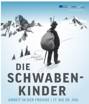
Görsel 12. Schwaben Göç Eden Çocuklar Sergisi afişi

Sergide "zaman aracı" olarak tanımlanan üniteler yer almaktadır. "Zaman araçlarında" oturabilen ve anlatıları dinleyerek tarihte kısa bir yolculuğa çıkabilen ziyaretçiler görgü tanıklarının hikayelerini dinlemektedir. Göçmen işçilerin çalışmasıyla Ravensburg'da endüstrinin ve ekonominin nasıl geliştiği de anlatılar arasında yer almaktadır. Sergideki dosya dolabı yerleştirilmesi, 1950'lerden 1970'lere kadar birçok sektördeki renkli kurumsal manzarayı gözler önüne sermektedir. Ravensburg haritası üzerine yansıtılan bilgiler ve projeksiyon yansıması da o dönemde ülkede sanayinin nasıl geliştiğini istatistikî bilgilerle ve haritalandırma yöntemleriyle aktarmaktadır. Aynı alanda "misafir işçi çocukların" deneyimlerini içeren ses kayıtları da çocukların yaşantısını deneyimlemeyi sağlamaktadır. Bu sergi "19. ve 21. yüzyıllarda Yukarı Swabia ve Vorarlberg'e Göç" isimli Avrupa Birliği Projesinin bir çıktısı olarak ortaya çıkmıştır. Sergi, çiftlik evi müzesinin proje başlatıcısı olarak Vorarlberg'den dört proje ortağıyla birlikte göç konusunu bilimsel olarak araştırdığı ve kendi sergilerinde, okumalarında konuyu ele aldığı sınır ötesi bir AB projesinin başarılı bir şekilde sonlandırılmasıyla ziyaretçilerle buluşmuştur.