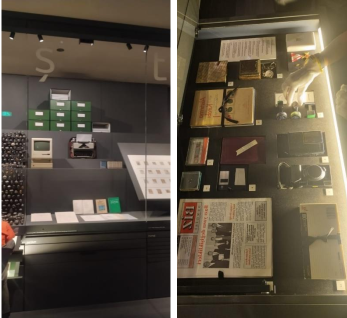
Görsel 1-2. Vorarlberg Müzesi sürekli sergisine yerleştirilen Ş harfi ve Kundeyt Şurdum seçkisi

Dornbirn’de bulunan önemli müzelerden biri kent müzesidir. Dornbirn Kent Müzesi Dornbirn’in kamusal yaşam, bilgi, bilgi depolama, ağ oluşturma, yansıtma ve etkileşim alanıdır.