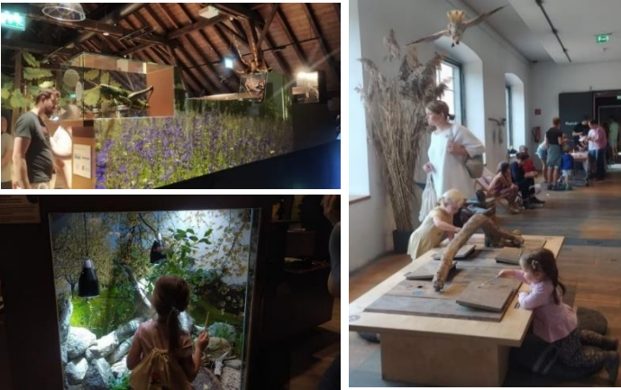
Görsel 4, 5-6. Inatura Müzesi Sergi ve etkinliklerden görseller

Inatura, tekstil üreticisi ve koleksiyoncusu Siegfried Fussenegger'in (1894-1966) girişimleriyle kurulmuştur. Inatura 2003 yılında "inatura- Macera Doğa Gösterisi" adıyla ziyarete açılmıştır. Müzenin yer aldığı Rüşch bölgesi, Vorarlberg'in sanayi tarihinin önemli bir parçasıdır ve endüstri tarihi ile sanat tarihini bir araya getirmektedir. Inatura bilimsel açıdan ilgi çekici nesnelerin yanı sıra tarihsel veya estetik açıdan değerli öğeleri bir araya toplamaktadır. Görüntü ve ses belgeleri de müze koleksiyonunda bulunmaktadır. Müzede bölgenin doğa tarihine ilişkin endemik hayvan ve bitki örnekleri, yaparak ve yaşayarak öğrenmeyi destekleyen müze materyali ve etkinlikler, canlı hayvanlara ilişkin vivaryum ve akvaryum benzeri yaşam alanları ile araştırmacılar için hazırlanmış büyük bir kütüphane ile çeşitli laboratuvarlar yer almaktadır. Müze, eğitim etkinlikleri ile dikkat çekmektedir. Vorarlberg'in doğal çeşitliliği adına inatura, doğa rehberi olmak için uzmanlık eğitimleri sunmaktadır. Bu etkinliklerin amacı, Vorarlberg'deki doğanın çeşitliliğini doğaya ilgi duyan Vorarlberg sakinlerine aktarmak ve onları doğa rehberi olacak şekilde yetiştirmektir. Aynı zamanda müze, bölgeye göç eden çocukların, gençlerin bölgeye uyum sağlaması ve bölgenin endemik türlerini tanıması açısından da önemli bir araçtır.