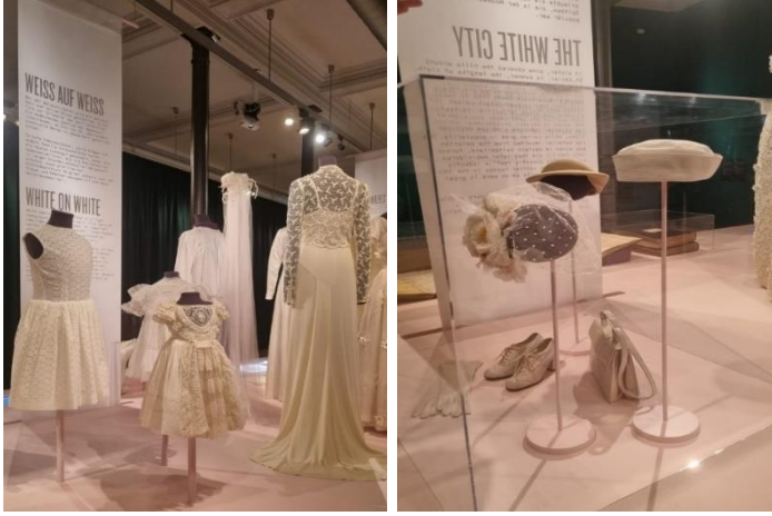
Görsel 8-9. St. Gallen Tekstil Müzesi, Beyazın Farklı Tonları Sergisine ilişkin görseller

değiştirilmiştir. 1991 yılında Tekstil Müzesi ve kütüphane «İHK Vakfına» devredilmiştir. St. Gallen Tekstil Müzesi, 2012'den beri, İHK Vakfı'nın 2019'da birleştiği Tekstil Müzesi Vakfı ile yakın çalışan Tekstil Müzesi Derneği'nin sponsorluğundadır. Müzede "100 Shades of White" sergisi birçok ünlüye ait beyaz renk giysilerden oluşmakta ve aynı zamanda köklü tekstil tarihi geçmişini de gözler önüne sermektedir.