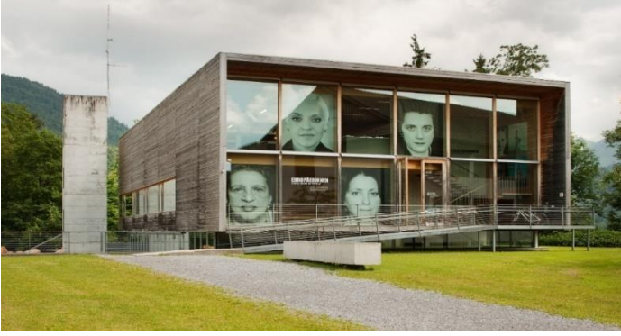
Görsel 3. Hittisau Kadın Müzesi, Hittisau Avusturya

Inatura, tekstil üreticisi ve koleksiyoncusu Siegfried Fussenegger'in (1894-1966) girişimleriyle kurulmuştur. Inatura 2003 yılında "inatura- Macera Doğa Gösterisi" adıyla ziyarete açılmıştır. Müzenin yer aldığı Rüşch bölgesi, Vorarlberg'in sanayi tarihinin önemli bir parçasıdır ve endüstri tarihi ile sanat tarihini bir araya getirmektedir. Inatura bilimsel açıdan ilgi çekici nesnelerin yanı sıra tarihsel veya estetik açıdan değerli öğeleri bir araya toplamaktadır. Görüntü ve ses belgeleri de müze koleksiyonunda bulunmaktadır. Müzede bölgenin doğa tarihine ilişkin endemik hayvan ve bitki örnekleri, yaparak ve yaşayarak öğrenmeyi destekleyen müze materyali ve etkinlikler, canlı hayvanlara ilişkin vivaryum ve akvaryum benzeri yaşam alanları ile araştırmacılar için hazırlanmış büyük bir kütüphane ile çeşitli laboratuvarlar yer almaktadır. Müze, eğitim etkinlikleri ile dikkat çekmektedir. Vorarlberg'in doğal çeşitliliği adına inatura, doğa rehberi olmak için uzmanlık eğitimleri sunmaktadır. Bu etkinliklerin amacı, Vorarlberg'deki doğanın çeşitliliğini doğaya ilgi duyan Vorarlberg sakinlerine aktarmak ve onları doğa rehberi olacak şekilde yetiştirmektir. Aynı zamanda müze, bölgeye göç eden çocukların, gençlerin bölgeye uyum sağlaması ve bölgenin endemik türlerini tanıması açısından da önemli bir araçtır.