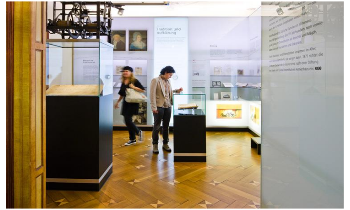
Görsel 7. Hohenheim Yahudi Müzesi

çevredeki bölgelerin (Bregenz ve St. Gallen'e kadar) gelişimine yaptığı çeşitli katkıları anlatan yerel bir müzedir. Aynı zamanda Avrupa'da, diasporada ve İsrail'de mevcut Yahudilerle ve Avrupa göçmen toplumunun geleceğiyle ilgili soruları da ele alan sergilere yer vermektedir. Hohenems'te günümüzde yerleşik bir Yahudi cemaati bulunmamaktadır ancak müze geçmişte bölgede yaşayan Yahudilerin tarihine ilişkin araştırma yürüten bir merkez görevi görmektedir. Müze, daha çok turistik amaçlı olarak müzeyi ziyaret eden ziyaretçilere 1864'te inşa edilen Heimann-Rosenthal villasında hizmet vermektedir. Müze, Nazi döneminde yok edilene kadar üç asırdan fazla bir süredir Hohenems'da varlığını sürdüren Yahudi toplumunun tarihini belgelemektedir. Bu kapsamda ziyaretçiye kapsamlı bir etkinlik programı sunulmaktadır.