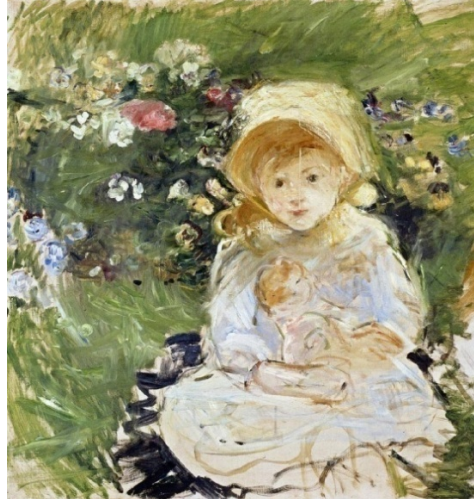
Resim 3: Berthe Morisot, Oyuncak Bebek ile Küçük Kız, 1883, Tuval Üzerine Yağlı Boya, 73x70 cm, Özel Koleksiyon.

Berthe Morisot için çocukluğun masumiyeti, önemli bir ilham kaynağıydı. Kızını eserlerinin odak merkezi haline getiren Morisot'un, Julie'ye verdiği değer ve düşkünlüğü resimlere de yansımıştır. Küçük kızını oyun oynarken (Resim 3), flüt çalarken, kiraz toplarken birçok farklı aktivite içerisinde defalarca resmetmiştir. Morisot'un sınırlı konuları resmetmesi, cinsiyeti ve sosyal konumunu da kapsamaktadır. Sanatçı diğer sanatçılar gibi gezip görerek resimler yapmamıştır. Morisot, eserlerinin özünü kendi çevresinden betimlemeler ile oluşturur. Berthe Morisot'un yeğenlerinden biri ile evli olan Paul Valery, 1941 yılında Morisot resimleri hakkında şu sözleri söylemiştir: “Eskizleri ve resimleri kendi yaşam akışını yakından izler ve biz onu önce bir genç kız, daha sonra bir eş ve sonra da bir anne olarak görürüz. Yaptığı resimler, bir bütün olarak ele alındığında kendisini, yazı yerine renkler ve desenlerle anlatan kadının günlüğünü hatırlatmaktadır” (Arka, 1997, s. 185-194).