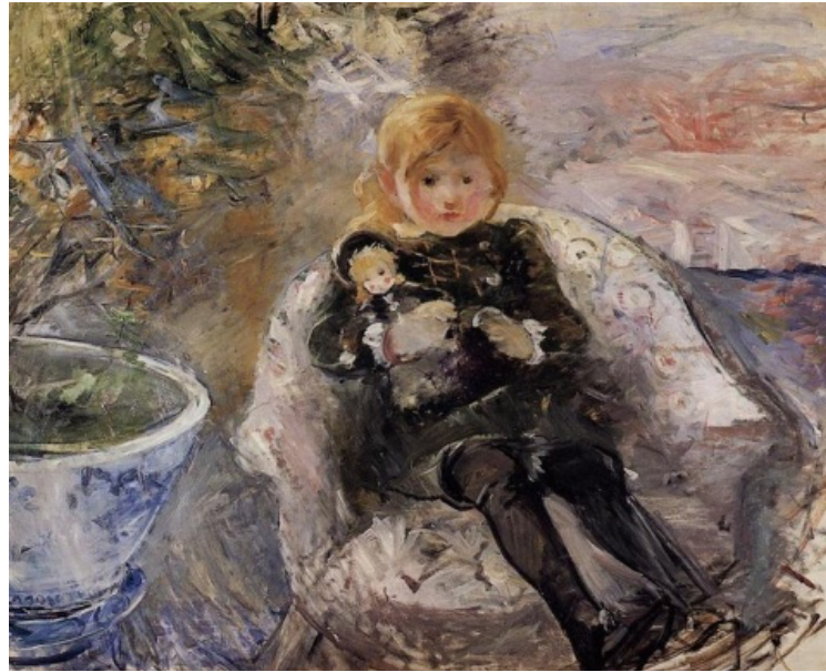
Resim 2: Berthe Morisot, Bebekli Küçük Kız , 1883, Tuval Üzerine Yağlı Boya, 73,03x70,17 cm.

Ayrıca, Morisot'un kızını resmetmesi, o dönemde kadın sanatçıların toplumsal olarak maruz kaldığı engelle meydan okumasına da işaret eder. Morisot, genellikle doğal ışık altında açık havada yapılan portreler, manzaralar ve ait hayatını konu alan resimleriyle tanınmaktadır. Kadın figürlerine özel bir ilgi gösteren Morisot, özellikle anne ve çocuk resimleriyle ün kazanmıştır.