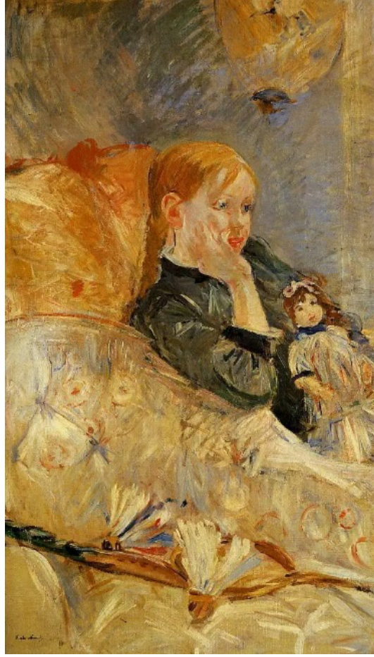
Resim 5: Berthe Morisot, Oyuncak Bebek ile Küçük Kız, 1886, Tuval Üzerine Yağlı Boya, 60,5 x 73,3 cm, Özel Koleksiyon

Resim 5’de Morisot, çağdaşlarından farklı olarak izleyiciye belki de bir kadın sanatçının acısını, hüznünü hissettir; Julie ve Morisot’un arasındaki yakınlık katmanlarıyla oluşan sanatsal bir deneyimi canlandırır. Annelik 19. yüzyılın ikinci yarısında güncel bir tema olarak kullanılmıştır. Rönesans’ta yer alan klasik bakire ve çocuk teması Fransa’da yeniden şekillendirilmiştir. 1880’lerde laik orta öğretim okulları oluşturmak ve ilköğretimde reform yaparak kız çocukları içinde fırsat eşitliği sağlamak amacı ile bir dizi yasa çıkarılmıştır. Orta sınıftan kadınlar, kız çocuklarını evde yetiştirirken artık gerçek eğitimlerine destek olarak ilgilenmişlerdir. Morisot ise, bu temayı resimlerine yansıtmayı başaran bir sanatçı olmuştur (Moran, 2021, s. 7).