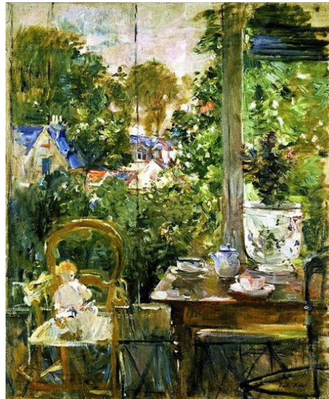
Resim 4: Berthe Morisot, Verandada Bebek, 1884, Tuval Üzerine Yağlı Boya, 81x100 cm, Özel Koleksiyon.

Berthe Morisot için çocukluğun masumiyeti, önemli bir ilham kaynağıydı. Kızını eserlerinin odak merkezi haline getiren Morisot'un, Julie'ye verdiği değer ve düşkünlüğü resimlere de yansımıştır. Küçük kızını oyun oynarken (Resim 3), flüt çalarken, kiraz toplarken birçok farklı aktivite içerisinde defalarca resmetmiştir. Morisot'un sınırlı konuları resmetmesi, cinsiyeti ve sosyal konumunu da kapsamaktadır. Sanatçı diğer sanatçılar gibi gezip görerek resimler yapmamıştır. Morisot, eserlerinin özünü kendi çevresinden betimlemeler ile oluşturur. Berthe Morisot'un yeğenlerinden biri ile evli olan Paul Valery, 1941 yılında Morisot resimleri hakkında şu sözleri söylemiştir: “Eskizleri ve resimleri kendi yaşam akışını yakından izler ve biz onu önce bir genç kız, daha sonra bir eş ve sonra da bir anne olarak görürüz. Yaptığı resimler, bir bütün olarak ele alındığında kendisini, yazı yerine renkler ve desenlerle anlatan kadının günlüğünü hatırlatmaktadır” (Arka, 1997, s. 185-194).