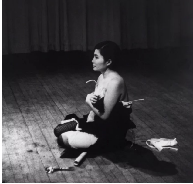
Görsel 6. Yoko Ono, Kesme Parçaları