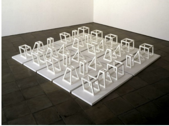
Görsel 1. Sol LeWitt, Geometric Structures, 1979.

sanatçı kavramsal bir sanat formu kullandığında, bu; tüm planlama ve kararların önceden yapılmış olduğu ve uygulamanın formalite icabı olduğu anlamına gelir' (Lewitt, 1967: 73-83).