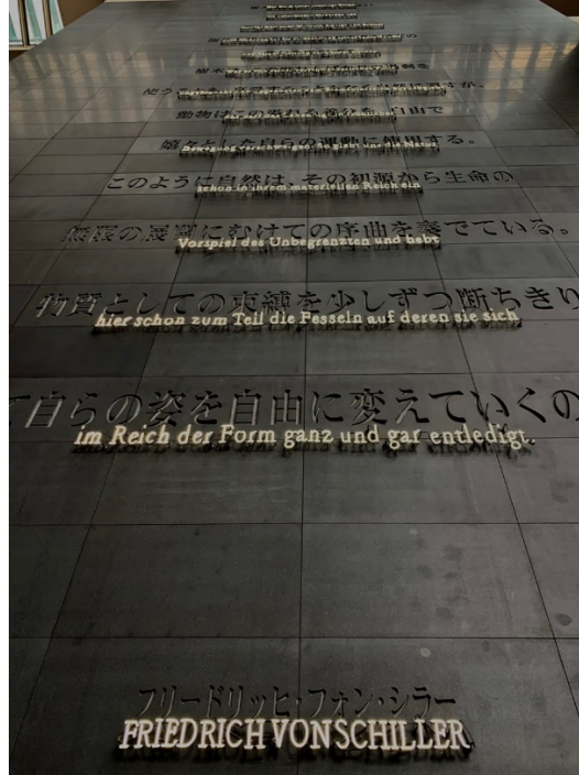
Görsel 4. Kosuth's "The Boundaries of the Limitless" in Queen's Square Yokohama, Japan, 1997

Sanatçılar, sanat eserlerini müzelerin ve galerilerin dışına çıkararak kamusal alana veya doğal çevreye entegre etmişler, ayrıca, sanat eserini ticari bir nesne olarak değil, fikri bir varlık olarak değerlendirme eğiliminde olmuşlardır. Kosuth; Görsel 4'te Beethoven'ın 9. Senfonisinin yazarı olarak ünlü Friedrich Schiller'in metninden alıntı yaparak, bugün karşı karşıya olduğumuz ekolojik sorunları, neon tüpler ve taşlarla ifade etmiştir.