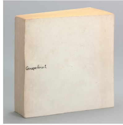
Görsel 7. Yoko Ono, Talimat Tabloları

Ono ayrıca "Instruction Paintings" (Talimat Tabloları) (Görsel 7) adını verdiği bir dizi çalışma yapmıştır. Bu tablolarında, izleyicilere resimleri tamamlamaları için talimatlar verir. Örneğin, "Yorganınızı bir ağacın dalına asın" veya "Yavaşça odadan çıkın ve asla geri dönmeyin" gibi talimatlar verilir. İzleyiciler, bu talimatlara uyarak sanatın aktif bir parçası haline gelir ve kendi yorumlarını ve deneyimlerini yaratırlar.