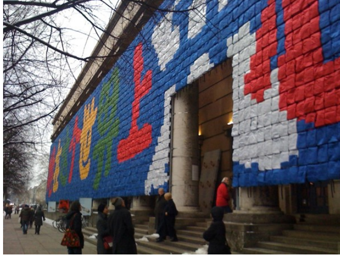
Görsel 5. Ai Weiwei, Haus der Kunst, Münih, 2009. Üzgünüm adlı retrospektifinde binanın cephesine yaptığı Hatırlama adlı duvar resmi.

Aktivist kimliğiyle tanınan Ai Weiwei, Çin hükümetine eleştirileri ve insan hakları savunuculuğu nedeniyle sık sık hedef olmuştur. 2011 yılında, Pekin hükümeti tarafından tutuklanarak hapse atılmış ve 81 gün boyunca gözaltında tutulmuştur. Bu deneyim, onun mücadelesini ve sanatını daha da güçlendirmiştir. Dünya çapında birçok kişi ve kuruluş, Ai Weiwei'nin özgürlüğü için kampanyalar yürütmüş ve destek göstermiştir.