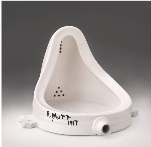
Görsel 2. Marcel Duchamp, Fountain, 1917/1964

Kavramsal sanat, 20. yüzyıl sanatının geleneksel malzemelerine ve formlarına meydan okuyan önemli bir akımdır. 20.yy'da sanat-nesne ilişkisi bu kavramlara yüklenen anlamlarla birlikte devamlı bir değişim sürecine girmiştir. Kübizm, Dadaizm, Sürrealizm vb. gibi akımlar sanatta nesne faktörünü derin bir şekilde sorgulamışlar, bu kavramlarda felsefi anlamlar aramışlardır. Gerek nesnenin geçiciliğine eleştiri, gerekse nesnenin "sanatta olması gereken şey" savunmalarıyla nesne her zaman sorgulanan bir kavram olmuştur. 1960'larda tanımlansa da, kökenleri, Marcel Duchamp'ın ünlü bir tesisatçı dükkânından bir pisuar satın aldığı ve onu New York'ta bir açık sanat sergisinde heykel olarak sunduğu 1917 yılına kadar uzanır (Görsel 2). Jüri tarafından eserin sanat olarak adlandırılmaya değer bulunmadığı anda, Duchamp'ın; Sanat nedir? Sanatın sınırları nerede yatıyor? Soruları, kavramsal sanat hareketinin temel parçası haline gelecek bir tohum olmuştur (http-1).