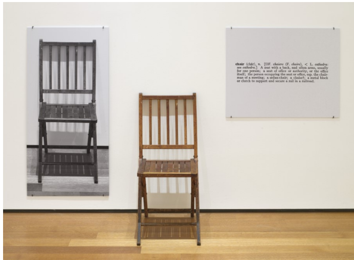
Görsel 3. One and Three Chairs, Joseph Kosuth (1965)

Kavramsal sanatçılar, sıklıkla sanat eserini gerçekleştiren fiziksel nesnelere yerine dil, yazı, fotoğraf, video veya performans gibi farklı medya ve formatlara başvururlar. Sanatçılar, işlerini çoğunlukla belgeler, açıklamalar, talimatlar veya kavramsal çizimler şeklinde sunarlar. Joseph Kosuth'un "bir ve üç sandalye" çalışması bu anlamda güzel bir örnektir (Görsel 3). Bu eserde, üç farklı bileşen vardır. Bunlar; gerçek bir sandalye, bir sandalyenin fotoğrafı ve "sandalye" kelimesi üzerinden bir tanım yazısı posteridir. İzleyiciye sunulan düşünce, bir nesnenin farklı temsil biçimlerinin ve tanımının nasıl bir araya geldiğini sorgulatmaktadır. Bu eser, kavramsal sanatın temel örneklerinden biridir ve görsel olarak karmaşık olmasa da düşünsel olarak derin bir anlam taşır. Bu tür çalışmaların gerçekleştirilmesi, izleyici veya katılımcıların eylemiyle tamamlanır ve sanat eseri kendisinden çok kavramsal bir olgu olarak ortaya çıkar. Kavramsal sanat pratiği, izleyicinin pasif bir gözlemci olmaktan ziyade düşünme ve yorumlama sürecine aktif olarak katılmasını gerektirir. Sanat eseri, bir nesne olarak algılanmayabilir; ancak fikirleri, kavramları veya düşünceleri üzerinden etkileşim ve iletişim sağlar. Kavramsal sanatın amacı zaten, sanatın sınırlarını zorlamak, izleyicinin zihnini açmak ve sanatın salt görsel bir deneyimden daha fazlası olduğunu vurgulamaktır. Bu açıdan bakıldığında Kavramsal sanat pratiği, geleneksel sanat anlayışını altüst eden bir yaklaşımdır, denilebilir.