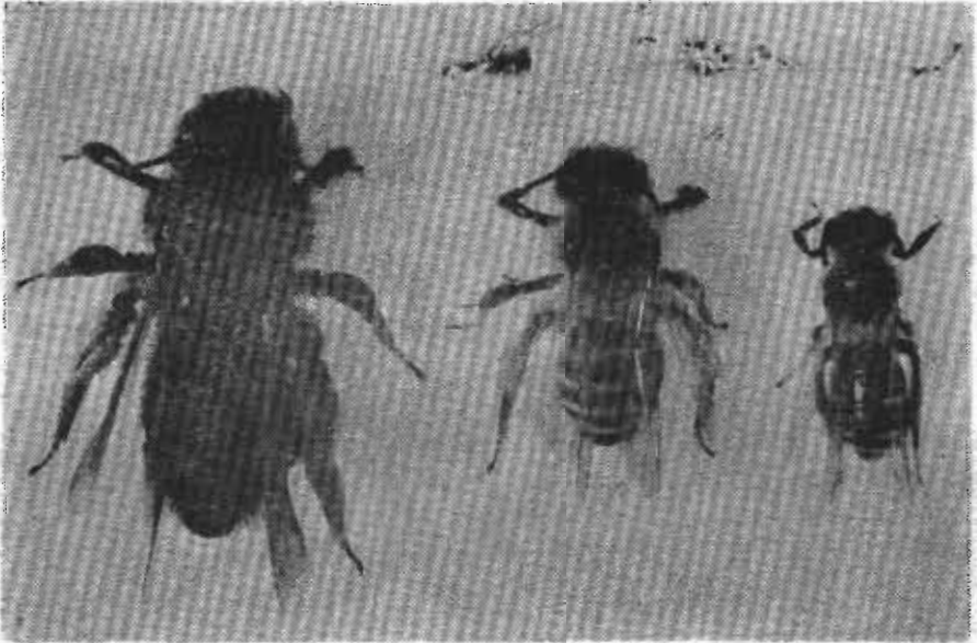
Şekil 1: Elma çiçeklerini tozlamada önemli olan bazı Andrena türleri. Soldan sağa; Andrena limata , A. flavipes , A. dorsata .

Brul., A. cineraria L., A. thoracica F., A. nitida (Mül.), A. assimilis Rod., A. nigroaenae K., A. bicolor F., A. limata Sm., A. ranunculorum Mor., A. incognita War., A. cypria Pit., A. dorsata (K.) A. transitoria Mor., A. congruens Schm., A. thomsoni Duc., A. combinata menelyi Alf., A. carbonaria L., A. bimaculata K., A. tibialis porzana War., A. truncatilabris Mor., A. humilis indigena War., A. panurgimorpha Mav. gibi türler elma çiçeklerini ziyaret etmektedir.