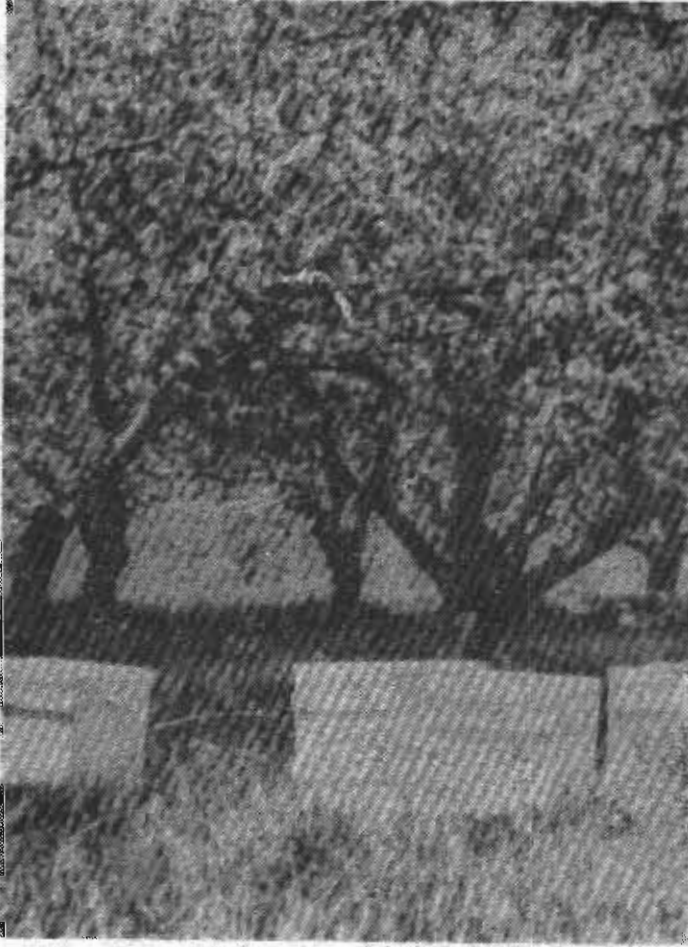
Şekil 2. Elma bahçesinde arı kovanları.

hası içerisinde hemen her yörede rast- lanmıştır. Ancak popülasyon çok dü- şüktür. Elmanın çiçeklenme zamanı bunların sadece ana arıları faaliyet göstermektedir. Kışlamış olan bu ana arılar, elma çiçeklerinden polen ve bal özü almakta hem kendi gıda ge- reksinimlerini karşılamakta, hem de yeni kurmakta oldukları koloniler için yuva- larında polen depo etmektedirler. İşçi ve erkek arılar daha sonra çıkacaklardır ki o zaman elma ağaçları çiçeklenme