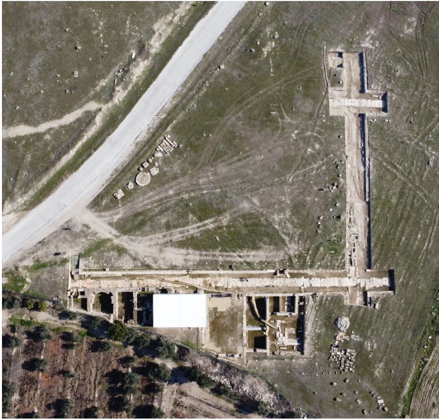
Resim 8 Konut Alanı hava fotoğrafı.

Şehir merkezinde odaklanan bu çalışmaların yanı sıra, kent sakinlerinin konut alanı olarak değerlendirdikleri, surun hemen güneyinde bir yaşam alanı meydana getiren insulalarda, 2013, 2018- 2021 yılları arasında toplamda beş sezon kazı çalışmaları yapılmış ve kentin güneyine bakan bölümünde, Lykos Vadisi’ne ve Büyük Menderes Nehri’ne hâkim yamaçlar üzerindeki eğimli arazinin teraslandırılarak Geç Antik Çağ boyunca çok sayıdaki sivil konutun Tripolis’in seçkinleri için tasarlanarak buraya yerleştirildiği anlaşılmıştır (Duman - Koçyiğit 2019: 12-18). Konut Alanı olarak belirlenen alan; Agora, Kemerli Yapı, Hamam, Hierapolis Caddesi ve Bouleuterion gibi önemli kamu yapılarının yer aldığı, kent merkezinin yaklaşık 300 m güney doğusunda yer alır (Res. 8).