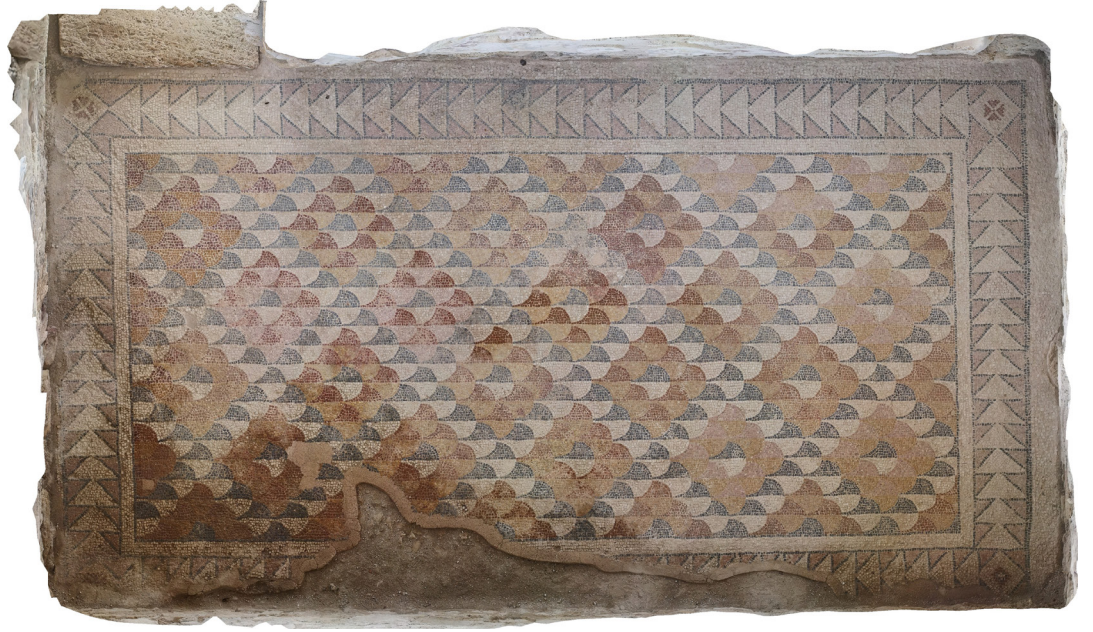
Resim 13 Mekân 2 mozaïği ortofoto.

etrafı, her iki yanı tek sıra siyah renkli tesseralardan oluşturulan krem renk zeminli ince bir bordür ile çevrelenmektedir. İnce çerçevenin çevresinde ise zemini pembe renkli tesseralardan oluşturulan ortalama 55 cm genişliğe sahip ikinci bir çerçeve yer alır. Bordürün dış çerçevesi çift, iç çerçevesi tek sıra siyah renkli tesseralardan oluşturulmuştur. Bordür içerisinde bordüre paralel olarak ardı sıra yerleştirilen koyu gri- siyah renk çerçevesi ve krem renk zeminli teğet eşkenar üçgenler dizisi yer alır. Tüm mozaïğin etrafında çerçeve oluşturan teğet üçgenler dört köşede etrafı tek sıra siyah renkli tessera ile çevrelenmiş, krem renk zeminli kare şekil içerisine yerleştirilen iki farklı süsleme ile kesintiye uğrar. Bunlardan ilkinde her bir karenin ortasında birbirlerinden aralıklı olarak yerleştirilen dört eşkenar üçgenin uçlarının merkezde yer alan kırmızı- kahve renkli tek tesseralardan oluşan noktaya yönelmiş pozisyondaki, kırmızı- kahve renkli malta haçı şeklinde geometrik öğelerden oluşan süsleme yer almaktadır. İkincisinde ise yine tek sıra siyah renkli çerçeve içerisinde krem renk zeminli bir karenin merkezinde kırmızı- kahve renkli ikinci bir kare bunun da içerisinde etrafı tek sıra siyah renkli tesseralardan oluşturulan krem renkli bir haç yer almaktadır. Geometrik süslemelerin yer aldığı mozaikli alanın en dışında ise dört tarafta krem renkli zemin ile mozaik sınırlandırılmıştır (Res. 14).