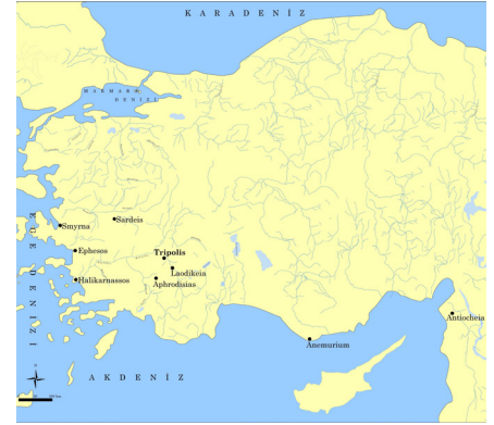
Resim 1 Tripolis'in yerini ve metinde adı geçen kentleri gösteren harita.

2012-2021 yılları arasında gerçekleştirilen arkeolojik çalışmaların büyük bir kısmı, İS 400 civarına tarihlenen Geç Antik surun çevrelediği alan içerisinde gerçekleştirilmiştir (Res. 2).