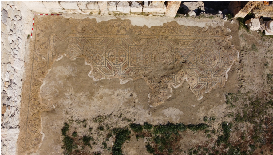
Resim 15 Mekân 7 doğu yarısındaki mozaik kalıntıları.

Mekân 1 olarak adlandırılan odanın güney bitişiğinde yer alan Mekân 7, konut yapısının karşılama salonu olarak tanımlanmıştır. 15.26 x 10.80 m ölçülerine sahip odanın 165 m 2 'lik alana sahip zemininde 1 dm 2 'lik alanda 73 tessera kullanılmıştır. (Res. 15). +180.28 m kodunda tespit edilebilen mozaik döşemenin nispeten mekânın batı, kuzey ve doğu duvar kenarları boyunca korunduğu, odanın güneyi ile merkez kısımlarında kalan büyük bir bölümünde