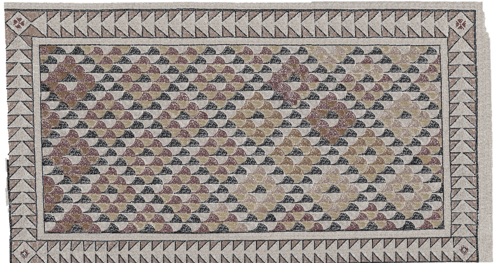
Resim 14 Mekân 2 mozaik çizimi.

etrafı, her iki yanı tek sıra siyah renkli tesseralardan oluşturulan krem renk zeminli ince bir bordür ile çevrelenmektedir. İnce çerçevenin çevresinde ise zemini pembe renkli tesseralardan oluşturulan ortalama 55 cm genişliğe sahip ikinci bir çerçeve yer alır. Bordürün dış çerçevesi çift, iç çerçevesi tek sıra siyah renkli tesseralardan oluşturulmuştur. Bordür içerisinde bordüre paralel olarak ardı sıra yerleştirilen koyu gri- siyah renk çerçevesi ve krem renk zeminli teğet eşkenar üçgenler dizisi yer alır. Tüm mozaïğin etrafında çerçeve oluşturan teğet üçgenler dört köşede etrafı tek sıra siyah renkli tessera ile çevrelenmiş, krem renk zeminli kare şekil içerisine yerleştirilen iki farklı süsleme ile kesintiye uğrar. Bunlardan ilkinde her bir karenin ortasında birbirlerinden aralıklı olarak yerleştirilen dört eşkenar üçgenin uçlarının merkezde yer alan kırmızı- kahve renkli tek tesseralardan oluşan noktaya yönelmiş pozisyondaki, kırmızı- kahve renkli malta haçı şeklinde geometrik öğelerden oluşan süsleme yer almaktadır. İkincisinde ise yine tek sıra siyah renkli çerçeve içerisinde krem renk zeminli bir karenin merkezinde kırmızı- kahve renkli ikinci bir kare bunun da içerisinde etrafı tek sıra siyah renkli tesseralardan oluşturulan krem renkli bir haç yer almaktadır. Geometrik süslemelerin yer aldığı mozaikli alanın en dışında ise dört tarafta krem renkli zemin ile mozaik sınırlandırılmıştır (Res. 14).