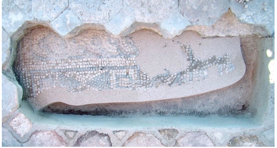
Resim 7 Agora kuzey portiğinin opus sectile döşemesi ve altındaki mozaik.