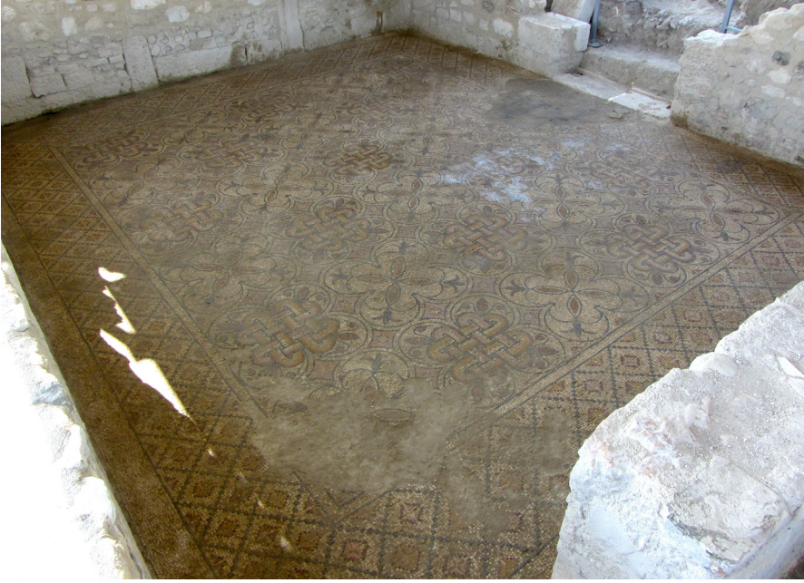
Resim 10 Mekân 1 içindeki mozaik döşeme.

yer alır. Oldukça sağlam biçimde açığa çıkarılmasına rağmen, odanın batı ve kuzey duvarları üzerindeki kapı boşluğu önünde mozaik zemin döşemesinin bir kısmı olasılıkla antik çağda meydana gelen bir deprem neticesinde kapı lentosu ve duvar taşlarının bir kısmının mozaik zeminin üstüne yıkılması nedeniyle tahrip olmuştur (Res. 10).