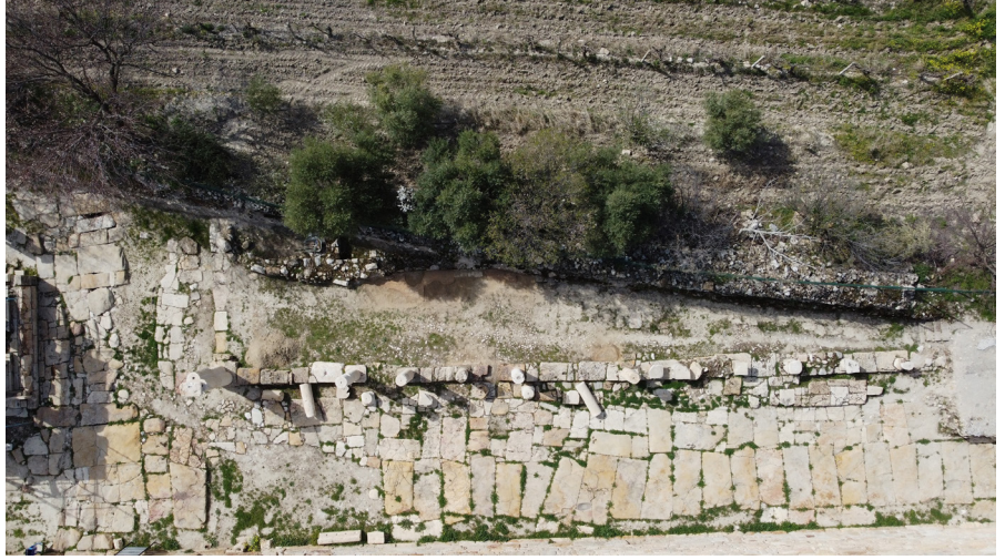
Resim 4 Sütunlu Cadde portiği üzerindeki mozaik döşeme detayı.