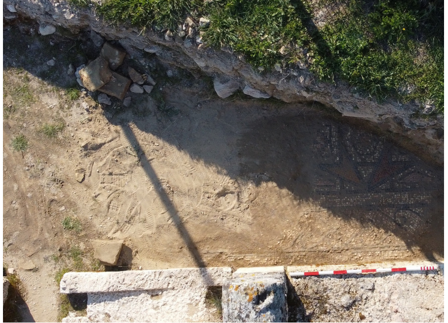
Resim 17 Mekân 14 doğusundaki mozaik kalıntıları.

Siyah, açık krem, hardal rengi, kırmızı kahve, bordo ve pembe renklere sahip tesseralarla oluşturulmuştur. Mozaik dölşemenin en dışında krem renk zeminli bordür içerisinde koyu gri renkli tesseralarla oluşturulan, iç içe geçmiş çizgisel görünümlü birbirini takip eden, teğet kalp şekilli süsmeden oluşturulan bordürün çerçevelediği görülmektedir (Decor I: pl. 94c). Bu bordürün her iki yanında açık krem renk zemine sahip birer ince bordür yer alır. Mozaikte asıl süslemenin yer aldığı panoda birbirine bitişik kare ve baklava dilimlerinin içerisinde altıgen, kare ve daireler yer almaktadır (Res. 18). Çok küçük bir