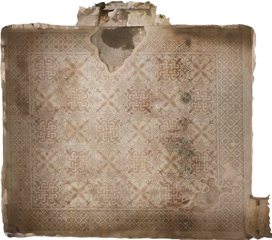
Resim 11 Mekân 1 mozaiği ortofoto.

Genel olarak bakıldığında oldukça canlı ve parlak renklerin kullanıldığı mozaik döşeme krem, pembe, kırmızı, kırmızı- kahve, turuncu, siyah ve koyu gri renk ve tonlarının kullanıldığı ortalama 1 x 1 cm ölçülerindeki tesseralardan oluşur. Mozaik ana zemininde krem, bezemeleri oluşturan süsleme unsurlarının konturlarında siyah, dolgu unsuru olarak ise kırmızı, pembe ve turuncu renkli tesseralar kullanılmıştır (Res. 11).