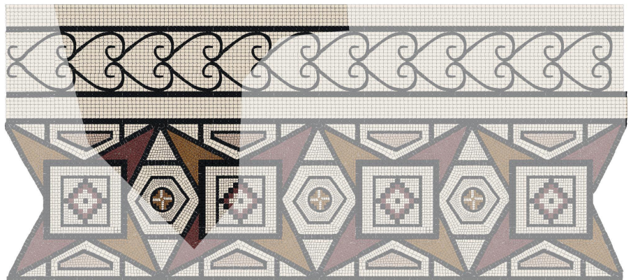
Resim 18 Mekân 14 doğusundaki mozaik çizimi.

Siyah, açık krem, hardal rengi, kırmızı kahve, bordo ve pembe renklere sahip tesseralarla oluşturulmuştur. Mozaik dölşemenin en dışında krem renk zeminli bordür içerisinde koyu gri renkli tesseralarla oluşturulan, iç içe geçmiş çizgisel görünümlü birbirini takip eden, teğet kalp şekilli süsmeden oluşturulan bordürün çerçevelediği görülmektedir (Decor I: pl. 94c). Bu bordürün her iki yanında açık krem renk zemine sahip birer ince bordür yer alır. Mozaikte asıl süslemenin yer aldığı panoda birbirine bitişik kare ve baklava dilimlerinin içerisinde altıgen, kare ve daireler yer almaktadır (Res. 18). Çok küçük bir