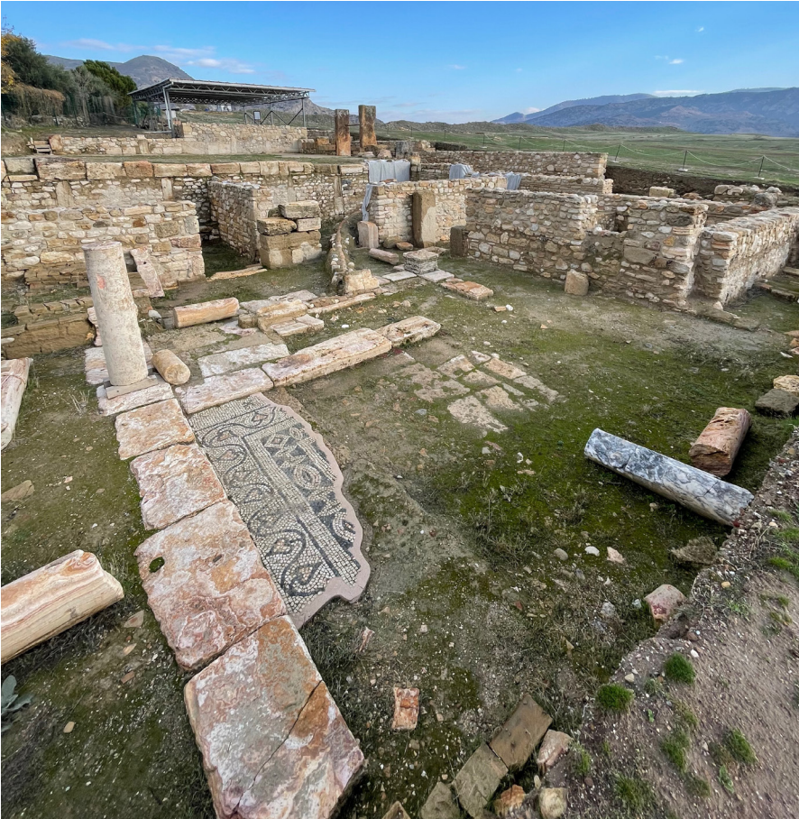
Resim 19 Peristil Avlu ve implivium içindeki mozaik döşeme.

Tripolis konut alanında güney (alt) teras olarak adlandırılan ve mekânlar bütününe odak noktasında yaklaşık 100 m 2 büyüklüğünde peristil bir avlu etrafında gelişim gösterdiği anlaşılan ikinci bir konut yapısı yer alır. Peristil avlunun ortasında yer alan dikdörtgen planlı bir süs havuzunun (implivium) zemininde, +177.80 m kodunda yaklaşık olarak 2.8 x 1 metrelik bölümü korunabilmiş mozaik süsleme tespit edilmiştir (Res. 19). 1 dm 2 'lik alanda 17 tessera yer alır. Açık krem, koyu gri ve açık kahve olmak üzere üç farklı