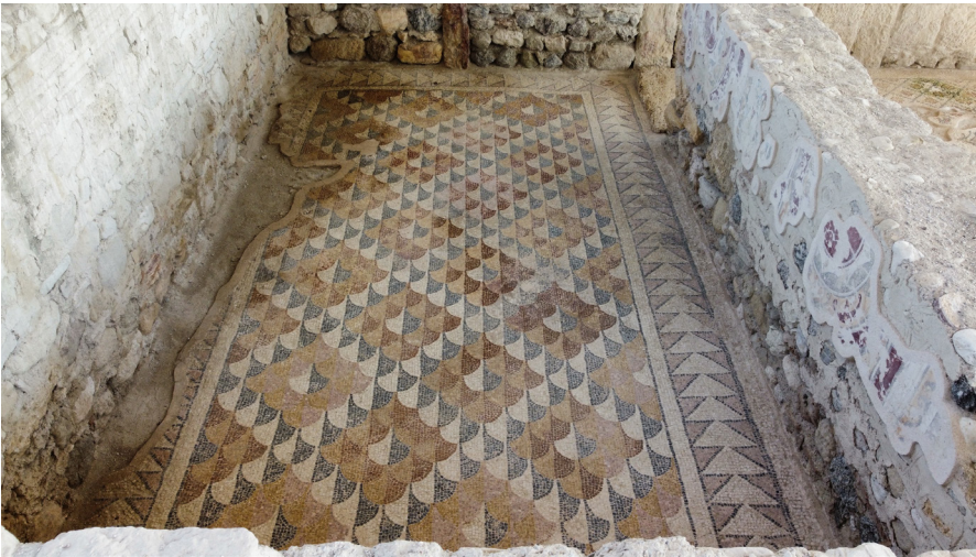
Resim 12 Mekân 2 içindeki mozaik döşeme.

Mekân 1'in kuzeyinde 3.30 x 6.10 m iç ölçüleriyle 20 m 2 genişliğe sahip ve Mekân 1 ile organik bağlantısı bulunan bu odada mozaik döşeme +180.29 m kodunda açığa çıkarılmıştır (Res. 12). 1 dm 2 lik alanda 52 tessera yer alır. Tıpkı MK1'de açığa çıkarılan mozaik döşemede olduğu gibi oldukça canlı ve parlak renklerin kullanıldığı mozaik zeminin krem, sarı, pembe, kırmızı, turuncu ve koyu gri renklerdeki 1 x 1 cm ölçülerindeki tesseralardan yapılmıştır (Res. 13).