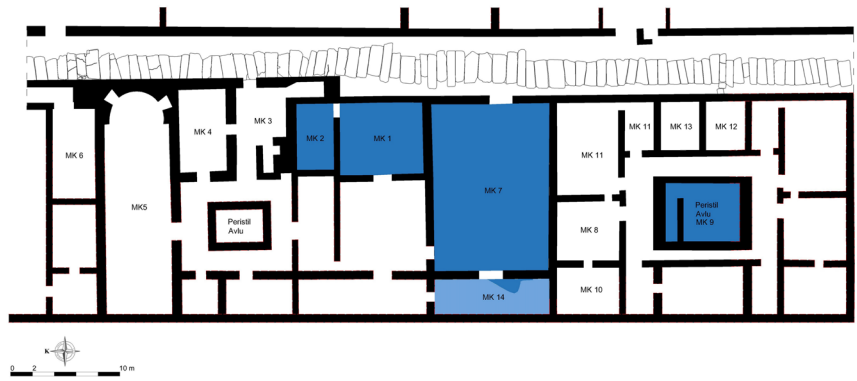
Resim 9 Konut Alanı'ndaki mozaik döşemeli odaları gösteren plan.

Peristil avlulu bu yapılardan ilki, üç odasının tabanında yer alan gösterişli mozaikleri sebebiyle, 'Mozaikli Ev' olarak tanımlanmıştır. Diğerleri ise bu konutun hemen güneyinde, büyük peristil avlusu ile öne çıkar ki bu konut yapısını oluşturan mekânların tamamının avlu etrafında geliştikleri anlaşılmıştır. Mozaikli Ev olarak tanımlanan konut yapısının kuzeyindeki terasta ise, sadece bir mekânı ortaya çıkarılabilen bir başka konut daha yer almaktadır.