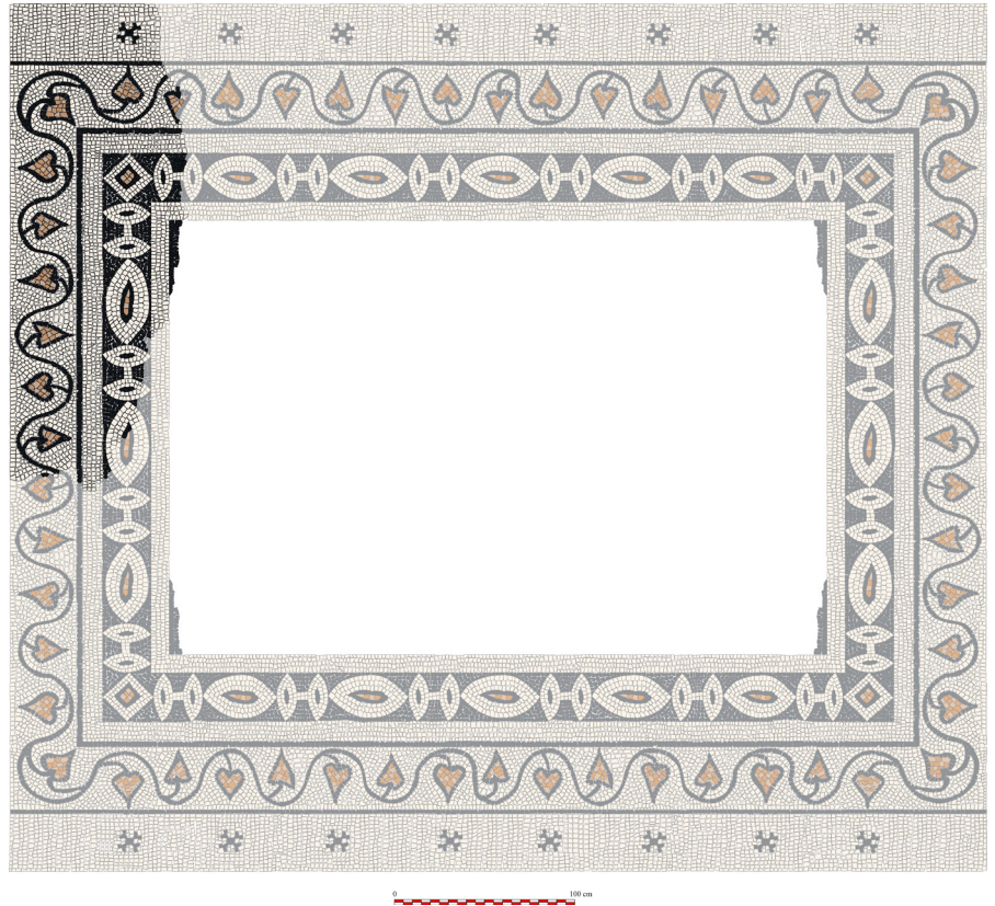
Resim 20 Implivium içindeki mozaik döşeme çizimi.

Söz konusu alanda birkaç sezon gerçekleştirilen kazı çalışmalarında ağırlıklı olarak İS 4-6. yüzyıla ait günlük kullanım kaplarının yanı sıra aynı tarihlere işaret eden sikkelerde ele geçmiştir. Yukarıdaki satırlarda da ifade edildiği gibi bu alanda önceden gerçekleştirilen çeşitli tarımsal faaliyetler nedeniyle ve konut alanının günümüz zeminine en yakın bölümünü oluşturan Güney Teras Peristil söz konusu faaliyetlerden en çok zarar gören alan olmasının yanı sıra buluntular vasıtasıyla sağlıklı bir kronoloji elde edilmesini de zorlaştırmaktadır.