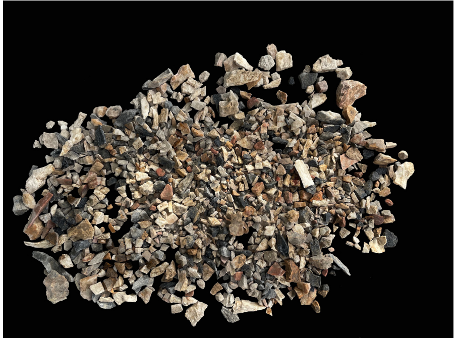
Resim 21 Tessera yapmak için kırılan taş atıkları.

Tripolis'te bulunan mozaiklerin yerel unsurlarca mı yoksa gezici atölyeler tarafından mı yapıldığına dair sorulara şu an için çok net olarak cevap bulunamasa da 2015 yılı kazı çalışmalarında kentin merkezi konumdaki kuzey- güney yönlü ana caddesinin sütunlu galerisinde tespit edilen mozaikte kullanılan tesseraları oluşturmak için kesilen ve çeşitli işlemlerin evrelerine ait izler taşıyan küçük taş kırıklarından oluşan buluntu topluluğu, kentte mozaik işçiliğine yönelik çeşitli faaliyetlerin ilk izlerini oluşturmaktadır (Res. 21).