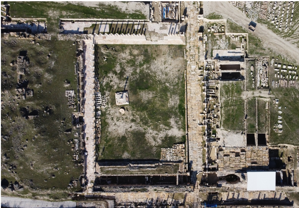
Resim 5 Agora hava fotoğrafı.

Tripolis kent merkezinde Bouleuterion, Kutsal Alan, Latrina ve Anıtsal Çeşme gibi birçok kamu binasının merkezinde yer alan yapı, yaklaşık 3500 m 2 lik bir alanı kaplamaktadır. Sütunlu galerilerle çevrili Agora’nın kuzey ve güneyinde doğu- batı yönlü, 7 basamaktan oluşan tribünler ve bunların gerisinde sütunlu galeriler yer almaktadır. Sütunlar arasında yer alan yazıtlı kaidelerin verdikleri bilgiler ve heykellerin üsluplarından anlaşıldığı kadarıyla Agora ve çevresinde İS 4. yüzyılın ikinci yarısında büyük bir mimari faaliyetin gerçekleştiği anlaşılmıştır. 48 m uzunluğunda ve 4.60 m genişliğindeki kuzey tribünün gezinti alanının zemini sekizgen ve dörtgen şekilli bantlı traverten ve mermer plakaların yan yana getirilmesiyle oluşturulmuştur (Res. 5). Tripolis’te özellikle